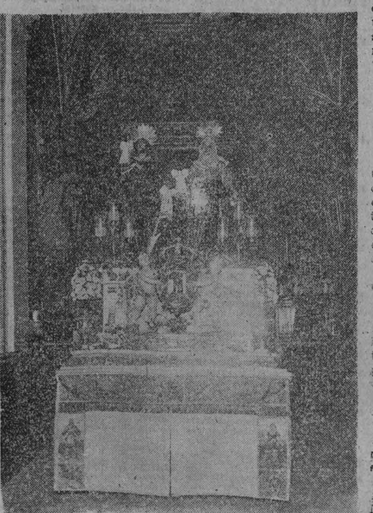
El altar del Santo Patrón de Madrid

el yugo del Islam, cuando vino al mundo, hijo de padres, sin duda, ricos, aquel sencillo y dulce mortal que rotó los campos matritenses, una vez ayudado por los buyes y otra por los ángeles. La lectura de aquel pasaje del Géne-