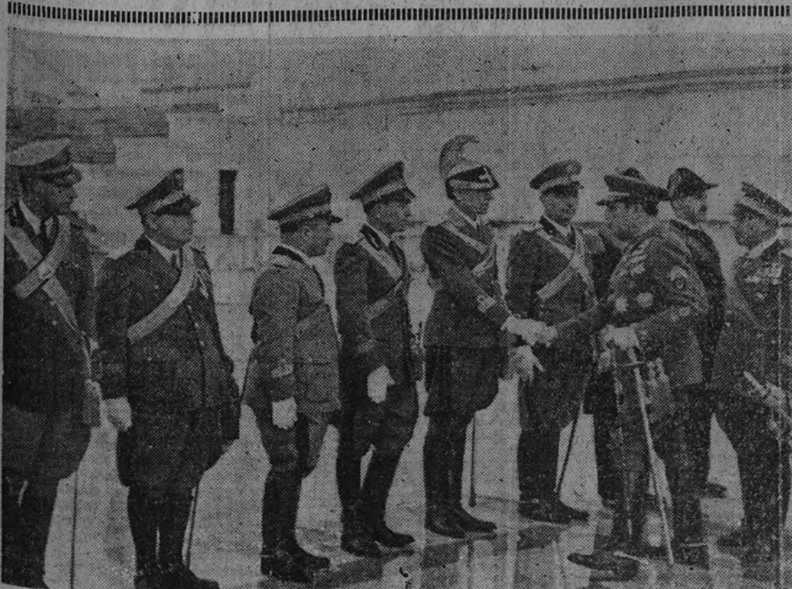
El laureado general García Escámez despidiéndose de la Comisión de militares y marinos que le acompañó en el acto de rendir homenaje ante la tumba del soldado desconocido, en la que depositó una corona de laurel.

LONDRES 13.—El enviado de la Agencia Reuter a bordo del "Emperatriz de Australia", comunica que a las doce y media de hoy fué descubierto un "iceberg", a pocos centenares de metros, delante del barco. Este se vió obligado a dar marcha atrás rápidamente. Sin embargo, por la tarde el viaje ha seguido, aunque a poca velocidad, a causa de las precauciones que hay necesidad de tomar. (Efe.)