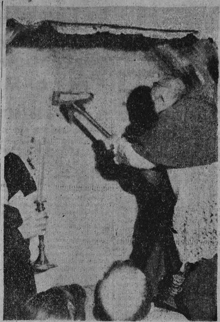
El obispo de Madrid-Alcalá iniciando el derribo de la pared que ocultaba la caja de las reliquias de San Isidro.