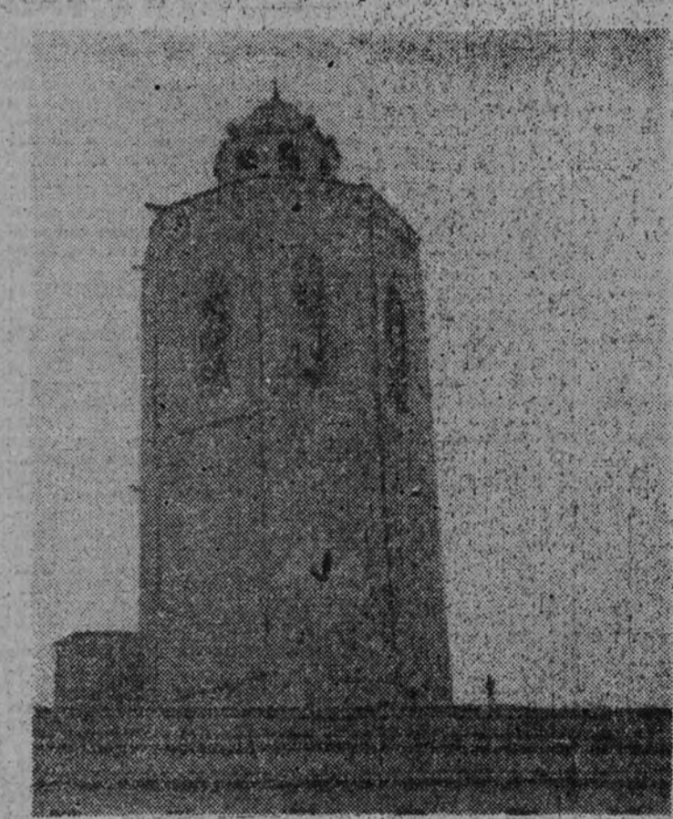
El reloj del Ayuntamiento de Cervera marca la hora de la conquista.

tella aparece tocada con el clásico sombrero cordobés. Nunca propaganda alguna fue leída con tanta ansia y entusiasmo, porque al pie del letrero que hablabas de las excelencias del vino había una prometedora indicación: "A Bar-