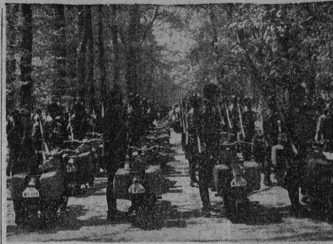
Los Enlaces Motorizados de Frenes y Estado Mayor, formados en el paseo de la Quinta, de Burgos, esperando la llegada del jefe de E. M. del Cuartel General

Sangriento combate con las tropas británicas JERUSALEN 16.—Continúan los graves incidentes de Transjordania. Ha habido hoy un fuerte combate entre los "activistas" y las tropas de Transjordania. Según un comunicado oficial, han resultado numerosos muertos a consecuencia de este combate. (Efe.)