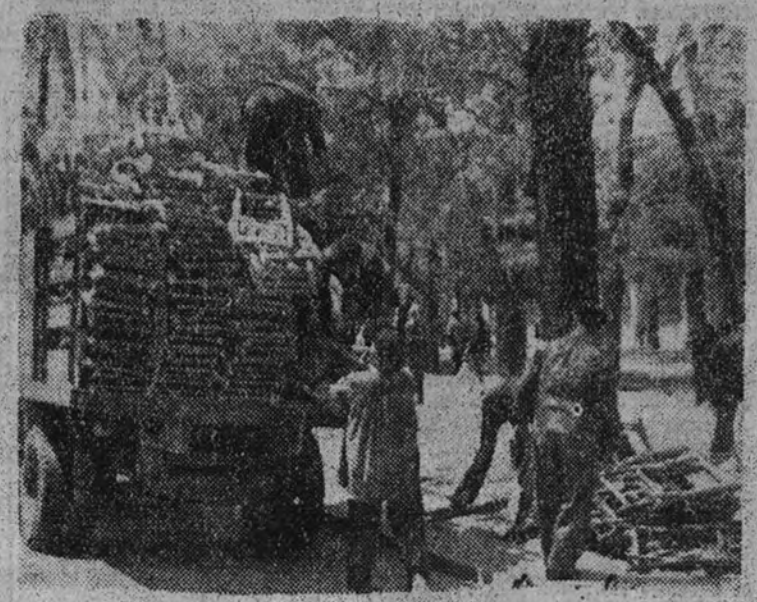
Al paseo de Recoletos llegan las primeras sillas, que podrá ocupar el público para presenciar el desfile de la Victoria