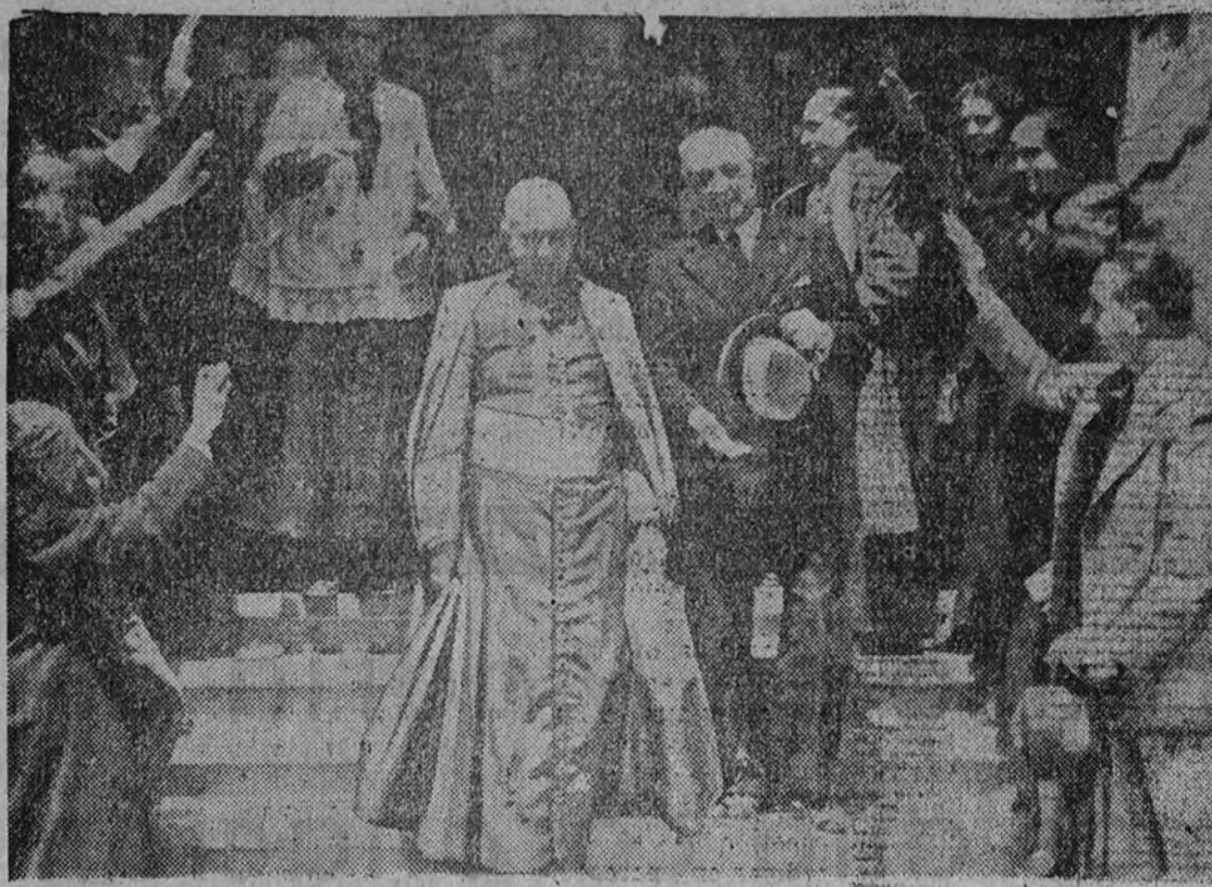
El ilustrísimo señor obispo y el alcalde de Madrid en la salida del funeral por los concejales asesinados por los "rojos".