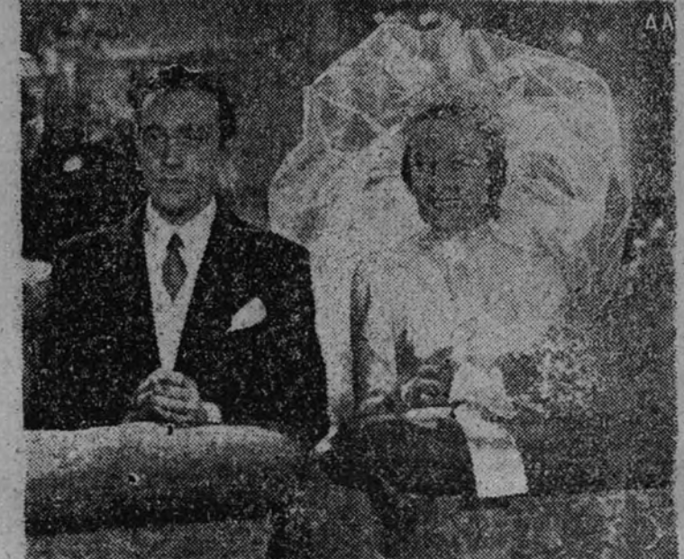
Una fantástica escena de la película italiana "Han rapto un hombre"