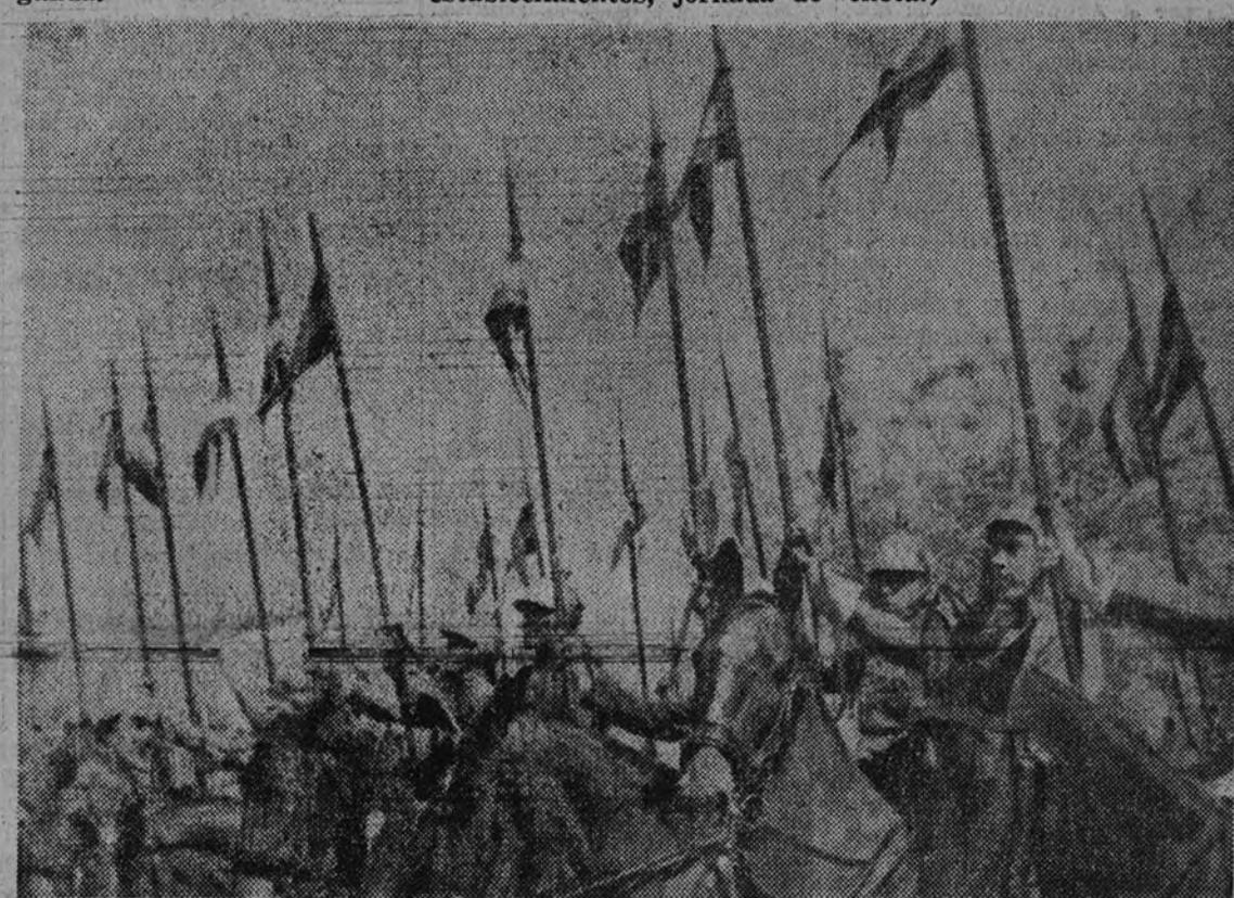
Escuadrones de Caballería española, de cuyas imponentes formaciones han podido juzgar los madrileños en estos días de víspera.

BURGOS 16.—Por su heroica actuación en la defensa de la posición de Las Minas, en el sector de Orduña, provincia de Vizcaya, el día 27 de mayo de 1937, el Generalísimo de los Ejércitos Nacionales ha concedido la cruz laureada de San Fernando, colectiva, al sexto escuadrón del regimiento de Numancia, número 6.