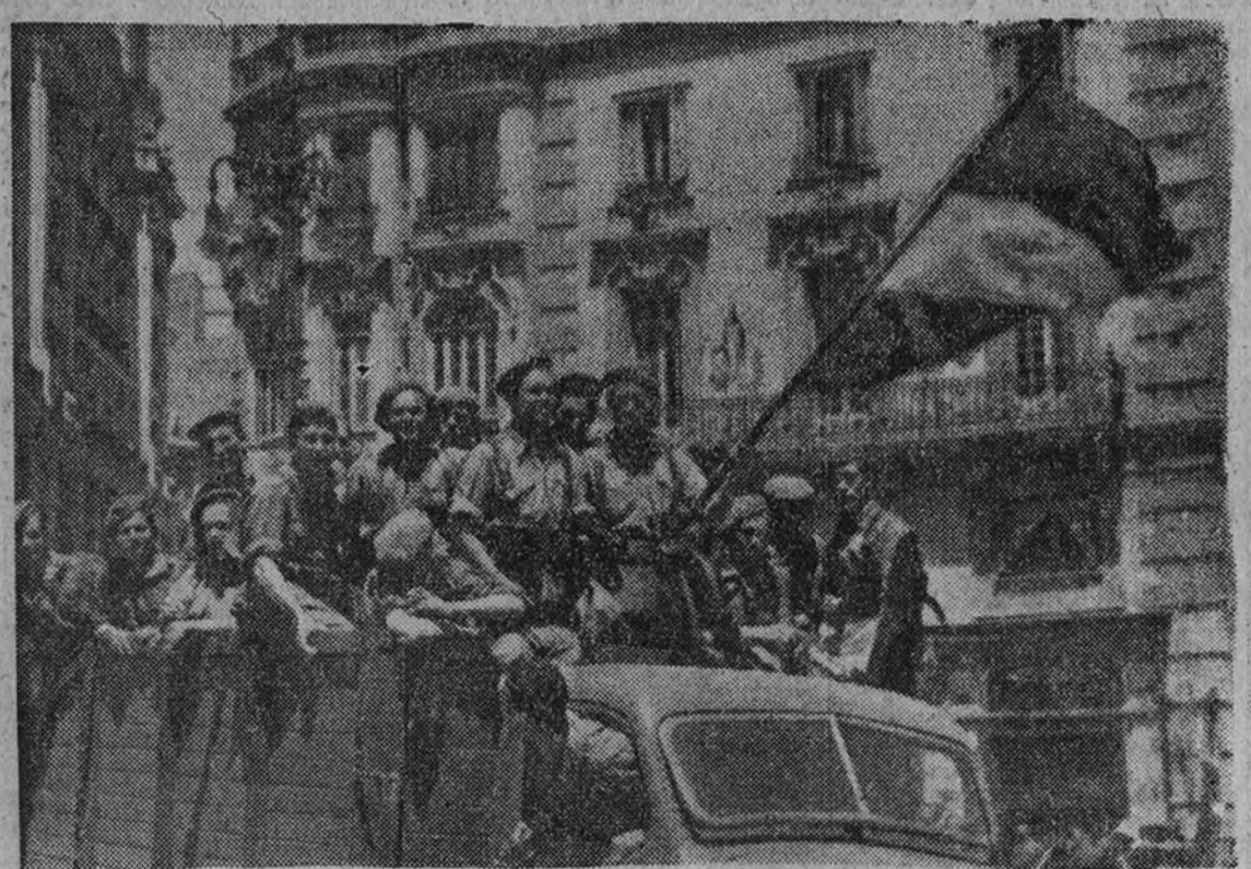
Fuerzas del Ejército español pon en a diario en la capital su alegría victoriosa de himnos y banderas