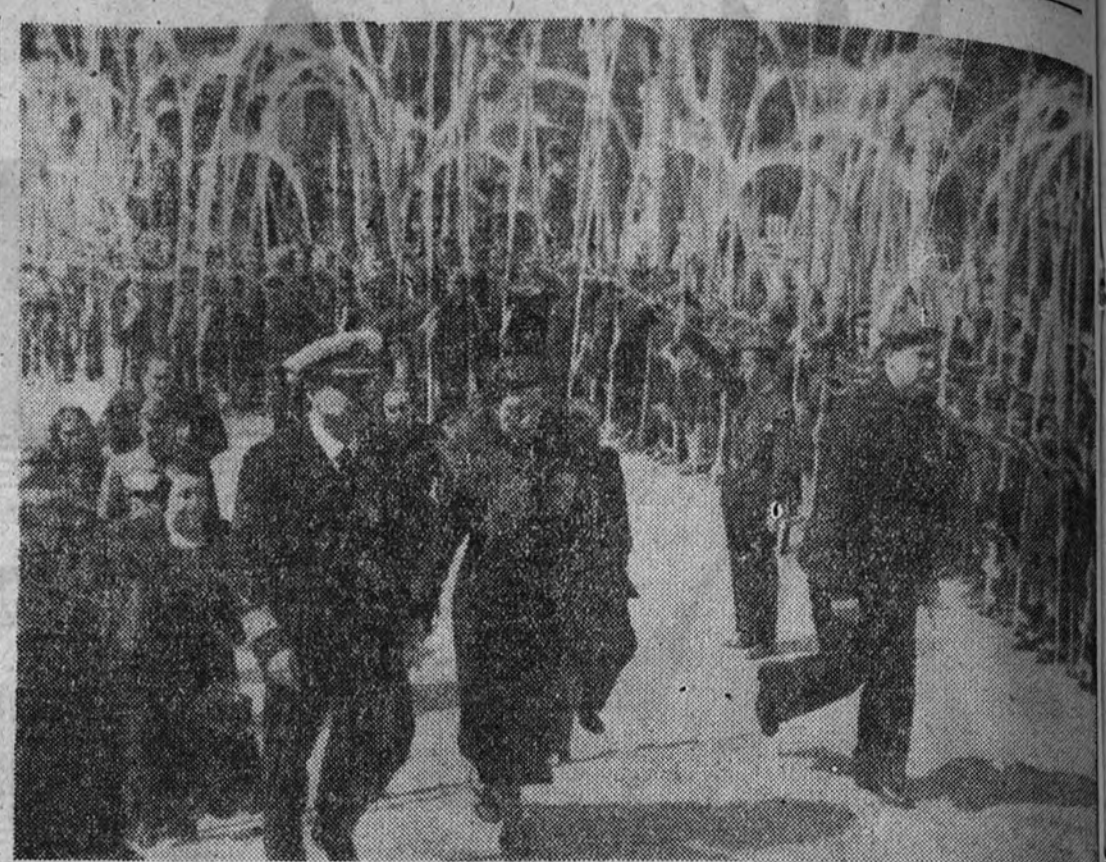
Los ministros de Industria y Comercio y de Agricultura a su llegada a la Iglesia de Santa Bárbara

El público madrileño, recordando ante su presencia los seis mil portugueses muertos a nuestro lado en la contienda, aclamó largamente a la gallarda representación portuguesa que figuró en el Desfile de la Victoria.