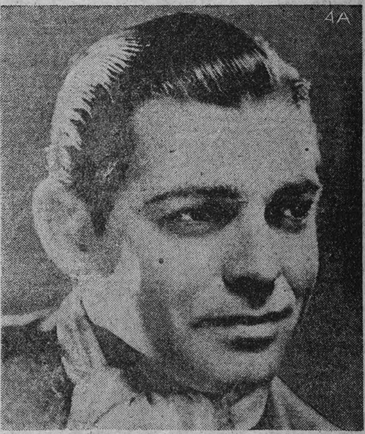
Clark Gable, el favorito actor de la pantalla, que hace una de sus mejores creaciones en la gran superproducción "Entre esposa y secretaria".

La calidad de una película es la que determina su sostenimiento en el cartel. Por las óptimas excelencias que han contribuido a la factura de "La canción de Aixa" se