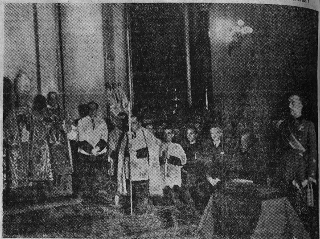
La solemne ceremonia religiosa celebrada ayer en la iglesia de Santa Bárbara