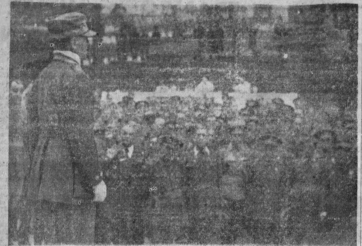
El general Millán Astray dirige la palabra a los jefes y oficiales que festejaron la Victoria en el Cuartel General.