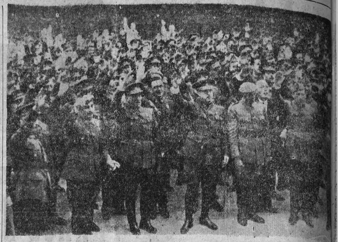
Los asistentes al acto del Cuartel General del Ejército del Centro a claman al Caudillo.