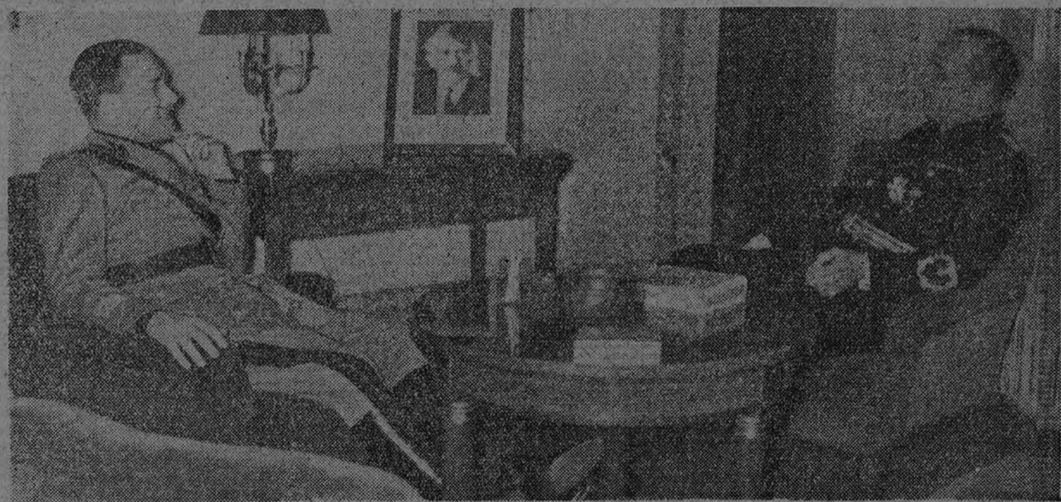
El conde Ciano y von Ribbentrop durante su última entrevista de Berlín.