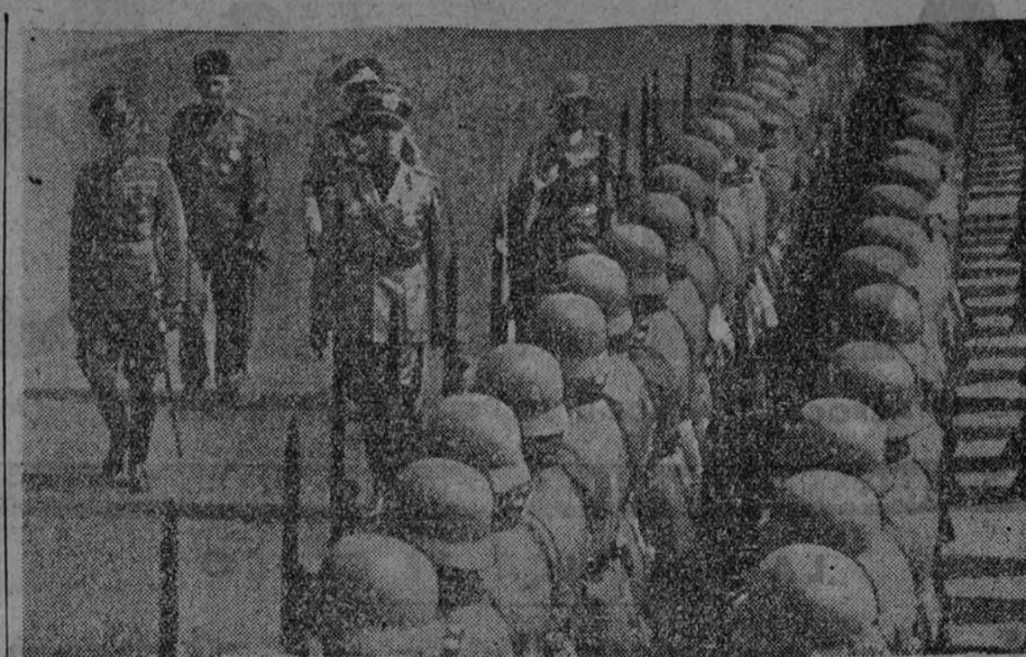
Ciano, a su llegada a Berlín, pasa revista a las tropas que le rindiéron honores.

Después—continúa diciendo la delegada nacional—se celebrará el desfile ante la tribuna del Ge-