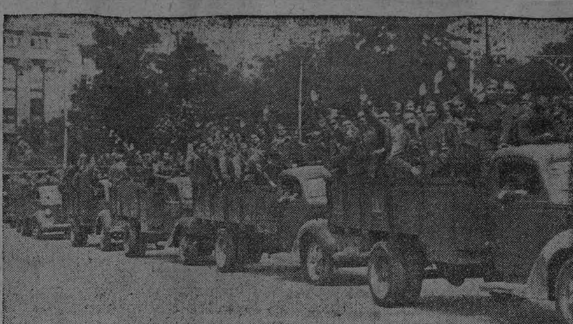
Los soldados de España, victoriosos sobre el comunismo, triunfadores de la muerte, van ahora, después del grandioso Desfile, de cara a una España mejor, Madrid, que los ha albergado unos días, ve su marcha con la emoción agradaída que se debe a estos héroes es paños, forjadores, con Franco, de la Victoria.

—Las películas hechas en la zona nacional antes de concluir la guerra, y no estrenadas en Madrid—el público sólo conoce "La canción de la paz"—son "Los hijos de la noche", "El barbero de Sevilla" y "Marigueta terremoto", de Benito Percejo; y "Carmen la de Triana", de Florian Rey.