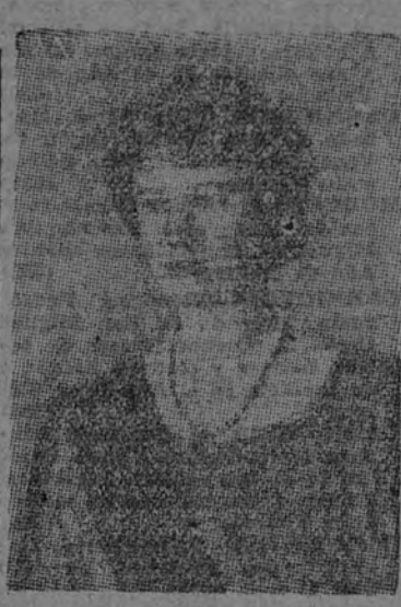
La gran duquesa Carlota de Luxemburgo

Según dice la Agencia Central-europea, en 1411 el Rey Wenceslao IV de Bohemia hizo donación del Gran Ducado de Luxemburgo a su sobrina Isabel, que a su vez cedió sus derechos a Felipe el Bueno de Borgoña. Después el territorio perteneció sucesivamente a