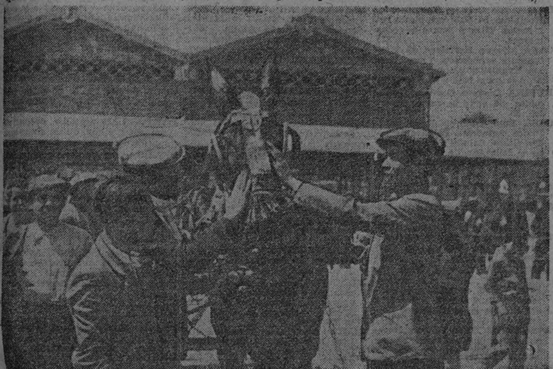
Del Mercado de Ganados. Con las manos sobre la compra reciente, se cierra el trato.