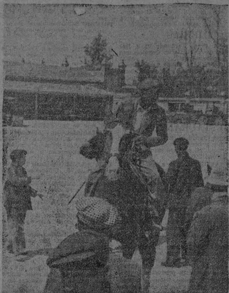
Se ha inaugurado en Madrid el Mercado de Ganados. Un posible comprador probando un caballo.

El Mercado, que ayer se reanuda, se celebrará, como antes del dominio de la horda, todos los jueves, pero no conseguirá animarse hasta que vengán con sus parejas de mulas de tiro y labranza los tratantes de las provincias que no han sufrido el marxismo.