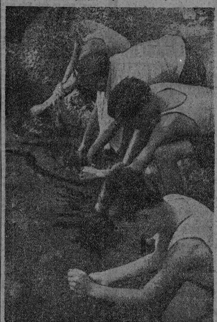
Y apartando las hojas que cubren, cada «flecha» se llena las manos de agua fría.

La Organización Juvenil de Cataluña ha instalado su primer campamento en el pueblito de Sardañola, en una antigua casa de campo cedida por sus propietarios. Rodeada de pinos, la finca tiene hermosos paseos, estanque grande y piscinas. En ella, durante un periodo determinado de días, hacen su vida unos centenares de pequeñas camaradas. Su vida de militancia y deporte, de política y religión: su vida imperial.