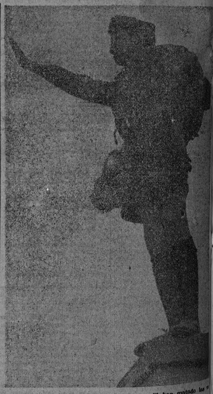
Los pequeños camaradas de la «camisa azul» han matado las vacaciones.

remente de juventud se precipitará, al estanque, a la piscina, con ojos dormidos en que va una risa pone su luz desvalnada.