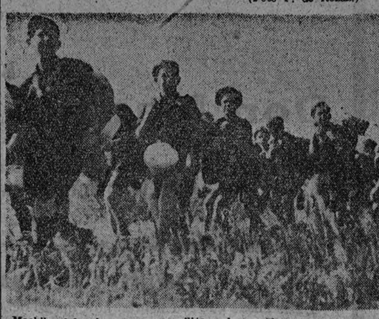
Mocho al hombro, con paso militar y la canción al viento, la fila de las «flechas» se va adelantando en el campo.

Duerman los chicos su gloria y su fatiga de soldados.