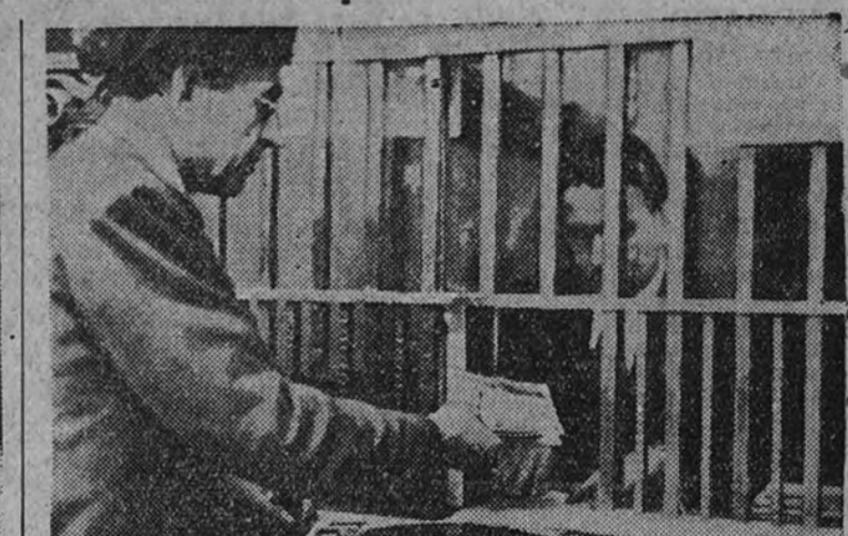
El público entrega en las ventanillas del Banco de España los billetes de emisiones del Gobierno "rojo"

Renta 3 por 100, 79,75. 4 por 100 1917, 82,97.