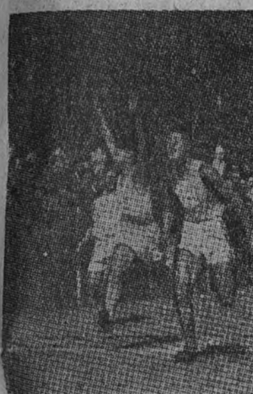
En París se han disputado las finales de la Copa de la Juventud de 30.000 escolares franceses. La llegada en la prueba final, ganada por el equipo de Aviación.

Lo que comunicamos a los socios del Madrid, convencidos de