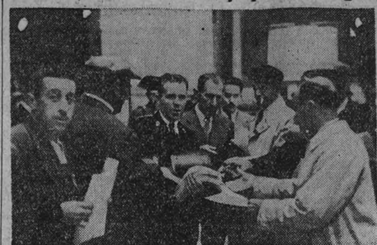
Los empleados del Banco de España facilitan impresos para reseñar los números y series de los billetes a entregar

LA RECOGIDA DE PLATA. Continúan todavía fluendo cantidades de plata amonedada por billetes de curso corriente y legal. Según las noticias que nos dan, en el Banco de España, hasta ayer, había sido recontada moneda de plata entregada al canje por 34,4 millones de pesetas.