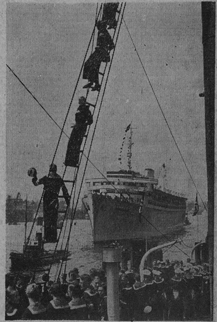
El transporte en que ha sido repatriada la Legión Cóndor llega al muelle de Hamburgo

Esta reunión ofrece un gran interés, pues es la primera que se celebra desde que terminó la guerra, y se tratará en ella del proyecto de ley Sindical, asunto de la máxima importancia. En el orden del día figuran otros asuntos, y quizá haya algunos también de gran interés. (Servicio especial de ARRIBA.)