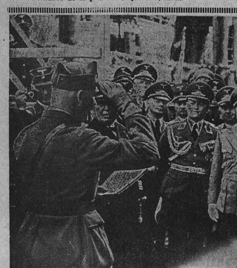
El general jefe de la Legión Cóndor, Richthofen, saluda al mariscal Goering a su llegada al puerto de Hamburgo

Unidad entre las clases de España. Unidad entre las tierras de España. Unidad en el hombre y entre los hombres de España