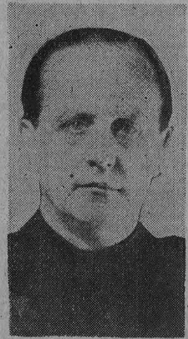
Fernández Cuesta

BURGOS 2.—El ministro de Agricultura y secretario general del Movimiento, camarada Raimundo Fernández Cuesta, recibió ayer la visita del embajador de