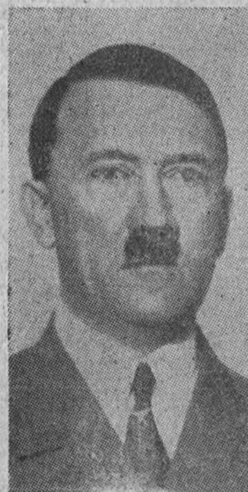
HITLER

KASSEL 4.—El Führer-canciller ha pronunciado hoy un discurso en la reunión de las Asociaciones de Antiguos Combatientes, que se celebra en esta ciudad. Comenzó saludando, en su calidad de Führer y de camarada en la Gran Guerra, a los miembros de la Unión de Combatientes. Después de hacer un rápido resumen de los últimos veinticinco años, el Führer dijo: "Hace veinte años que un Gobierno miserable se vió obligado por la fuerza a colocar su firma bajo el documento de Versalles. Yo he borrado solemnemente esta firma. Sin embargo, debemos comprender una cosa: la culpa de la guerra va siempre unida a los fines de la guerra. Ninguna nación ni ningún régimen harían la guerra únicamente por el placer de hacerla. Es sabido que el Gobierno alemán no tenía ningún fin en 1914, y que, incluso durante la guerra, no tenía tampoco un fin determinado. El Tratado de Versalles nos ha demostrado cuáles eran los verdaderos fines de los políticos ingleses y franceses en esta guerra: el robo de las colonias alemanas.