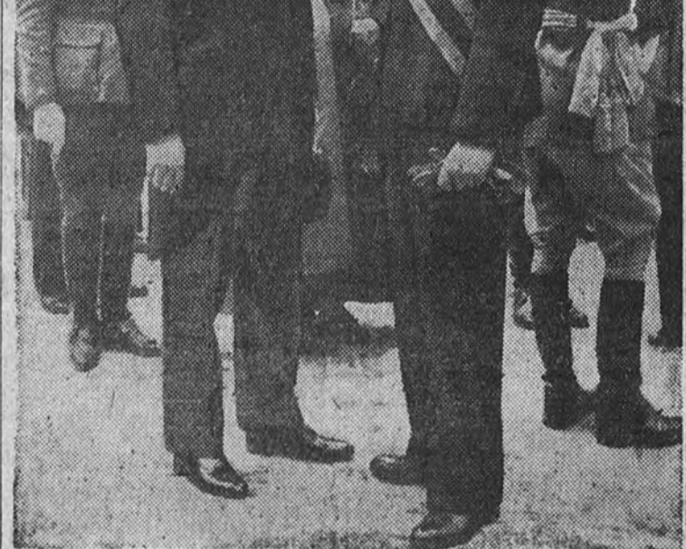
Los embajadores de Portugal en España y de España en Portugal, en el acto de imposición de condecoraciones por el ministro de Defensa Nacional a los voluntarios portugueses.

Se diría que hasta las nubes y las estrellas, hasta la púdica luna que cumplía los meses, eran «trucos» románticos en las manos de algún poderoso taumaturgo. Y el alba parecía una decoración atildada, la puesta, diaria del sol, desde los jardines sentimentales, semejaba una apoteosis de ópera costosa. Durante toda esta época, en los jardines románticos flotan melodías de sexteto y el aire está cuajado e inmóvil, pródigo en resonancias de verso libre.