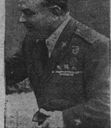
El general Gambara

El general Gambara tiene entre sus soldados acuada popularidad. Su esposa nos hacía observar que cuando los legionarios divisan a su general, el semblante se anima. El general Gambara nos recuerda su vida de soldado en los regimientos alpinos y su participación en la guerra. Muestra orgulloso de haber obtenido todos sus ascensos por méritos de guerra. Su participación en la guerra de España le llena de alegría y le produce una satisfacción, que no disminuye, por el deber cumplido. Pienso en los servicios prestados a su país y a la civilización cristiana. Al hablar de España, lo hace con una emoción que contagia a sus interlocutores. Siente por España una viva simpatía y admiración, que ha adquirido en las duras jornadas de la guerra. Cuando habla del Caudillo su rostro se anima. Le palabra le afluye a raudales. De sus labios hemos tenido una semblanza del Generalísimo tan exacta, que queremos traducir con sus mismas palabras, ya que no puede ser con su mismo tono. Recuerda diferentes conversaciones mantenidas con Franco en momento de grave dificultad, pero de ardiente optimismo.