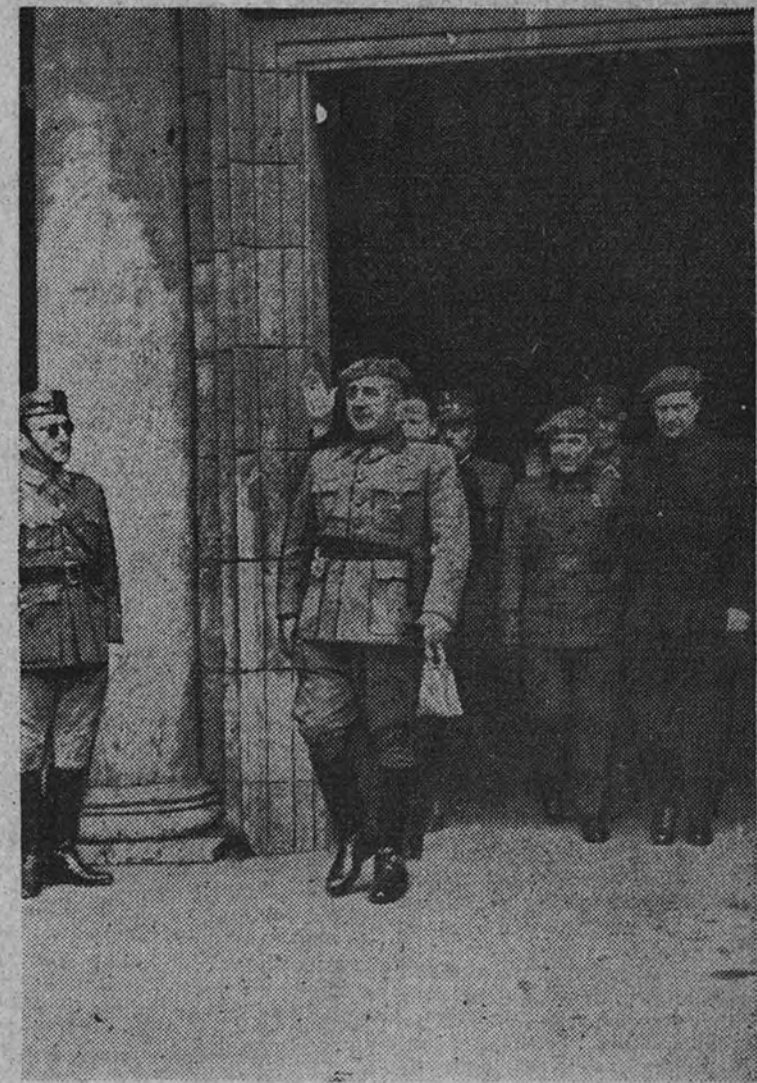
El Caudillo abandona el Ayuntamiento de Burgos después de presidir el Consejo de F. E. T. y de las J. O. N. S. que se celebró el lunes.