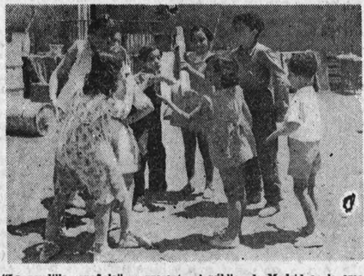
"La pandilla española" se presenta al público de Madrid en la emocionante producción nacional "Los héroes del barrio".