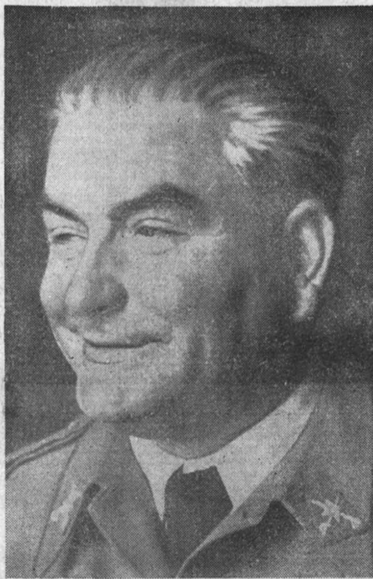
El general Gambara