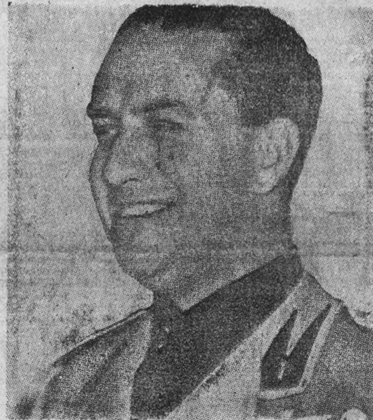
El conde Ciano

Víctor Manuel impone las condecoraciones por la campaña de España