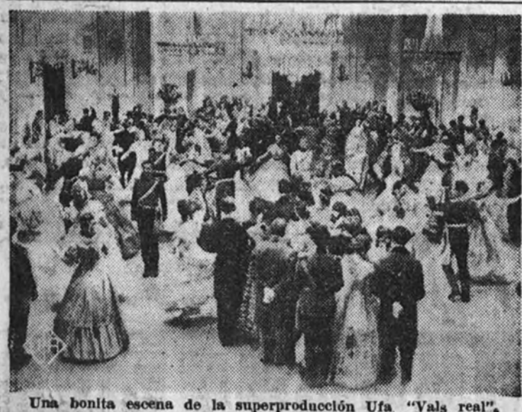
Una bonita escena de la superproducción Ufa "Vals real".