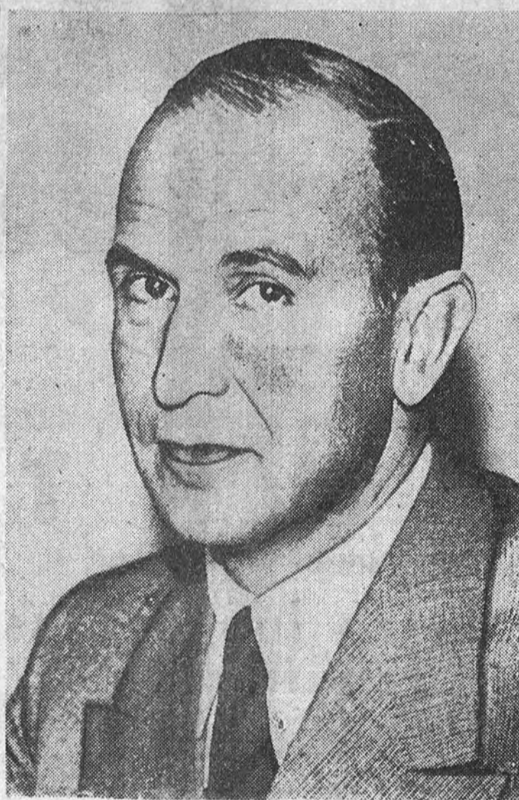
El ministro Alfieri