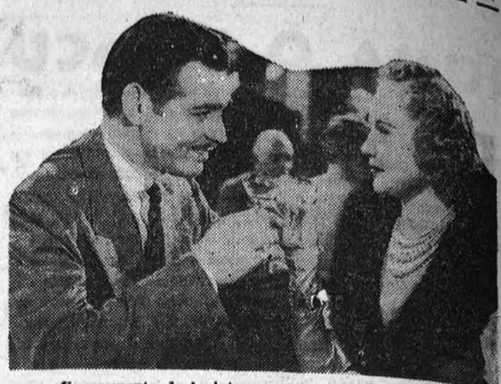
Un momento de la interesante producción "Saratoga".

"SARATOGA" EL ÚLTIMO "FILM" DE JEAN HARLOW A las once y media de la mañana del 17 de junio de 1938 el mundo perdió a una de sus estrellas favoritas. Moría la gentilísima Jean Harlow, llevándose en el perfume de sus veintisiete años, el secreto de sus elegancias y la exquisitez de un arte insuperable. Muir en plena juventud y en