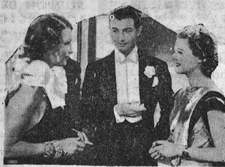
"Una chica de provincias" vuelve triunfante a la pantalla del Palacio de la Prensa.