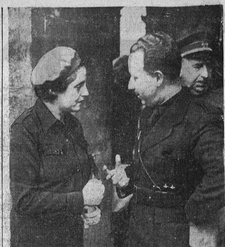
Los consejeros nacionales Pilar Primo de Rivera, señor González Bueno, teniente general Orgaz y general Moscardó al salir de la reunión del Consejo Nacional de F. E. T. y de las J. O. N. S.

Los religiosos y las religiosas españolas de Roma obsecraron a todos los concurrentes con rosarios. La ceremonia ha resultado impresionantísima, y en los rostros de los soldados, que se volvían victoriosos por la fe de Cristo, se reflejaba en lágrimas la emoción del acto. (Efe.)