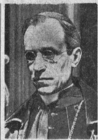
S. S. el Papa

«Bienvenidos seáis los jefes, oficiales y soldados de la Católica España, hijos nuestros muy amados. Habiéis venido a proporcionar a nuestro Padre un inmenso consuelo. Nos consuela ver en vosotros a los defensores sufridos, esforzados y leales de la fe y de la cultura de vuestra Patria que, como os decíamos en nuestro mensaje por "radio", habéis sabido sacrificaros en defensa de los derechos inalienables de Dios y de la Religión al venir ahora, llenos de gloria por vuestro heroísmo cristiano, nuestro pensamiento se dirige sobre todo a vuestros compañeros que murieron en campaña; mas nuestro corazón de Padre se conmueve ante la generosidad de tantas madres y ante las lágrimas de tantos huérfanos a quienes la muerte ha privado de sus seres más queridos. Decidles de nuestra parte que unan sus penas a la de la Virgen de los Dolores y que las ofrezcan a Dios con cristiana resignación por la paz del Mundo. Que corten y le presenten aquellas flores de la amargura en que la sombra de la Patria vacilante, en frase del poeta cordobés Lucano, os hizo comprender que España, sin hogares cristianos y sin tem-