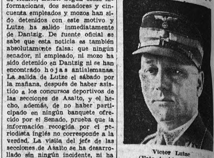
Victor Lutze

DANTZIG 12.—Según una información del «New York Chronicle», se han encontrado hojas antinacionalsocialistas durante un banquete que el Senado había ofrecido al jefe de las secciones de Asalto, Lutze. Según estas informaciones, dos senadores y cincuenta empleados y mozos han sido detenidos con este motivo y Lutze ha salido inmediatamente de Dantzig. De fuente oficial se sabe que esta noticia es también absolutamente falsa; que ningún senador, ni empleado, ni mozo ha sido detenido en Dantzig ni se han encontrado hojas antialemanas. La salida de Lutze el sábado por la mañana, después de haber asistido a los concursos deportivos de las secciones de Asalto, y el hecho, además, de no haber participado en ningún banquete ofrecido por el Senado, prueba que la información recogida por el periodista inglés no corresponde a la verdad. La visita del jefe de las secciones de Asalto se ha desarrollado sin ningún incidente, ni ha habido tampoco intención de ofrecer banquetes en su honor. (Efe.)