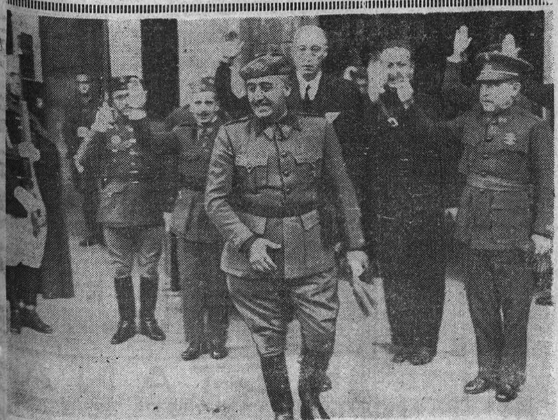
El Caudillo al salir de la última reunión del Consejo Nacional de F. E. T. y de las J. O. N. S., que estudió el informe sobre el proyecto de ley Sindical.

LONDRES 12.—El jefe del Departamento de Europa Central del Foreign Office, sir William Strang, ha llegado en avión a Varsavia y continuará su viaje a Moscú en tren.