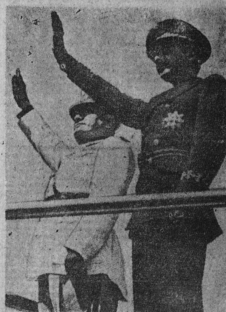
Nuestro camarada Ramón Serrano Súñer, ministro del Interior, Prensa y Propaganda, junto al Duce, a las Legiones, que desfilan por la Ciudad Eterna.