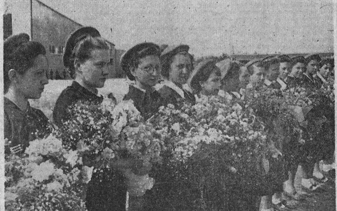
Las "femeninas" con su ofrenda de flores para el camarada siempre presente.

En la mañana de ayer, cuando se celebró el funeral de Ruiz de Alda, en el templo apareció completamente lleno de fieles, hasta el punto de que no cabía una persona más. En la presidencia figuraban las autoridades locales, civiles y militares; los generales Iruretagoyena, García Escámez y Sagardía, que, como se sabe, ostenta la re-