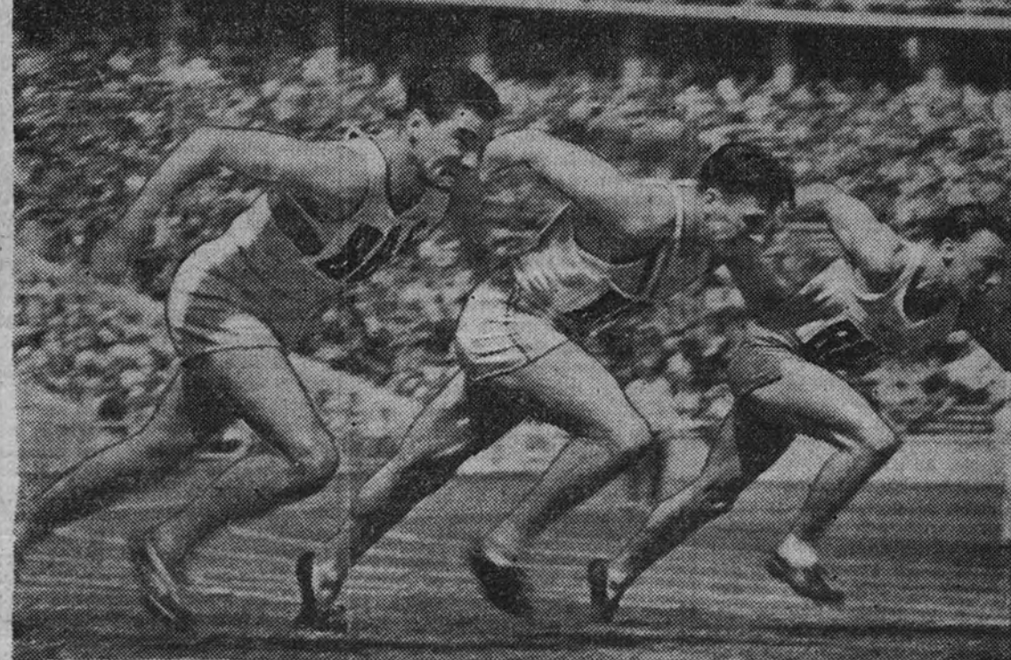
"Olimpiada", la gran cinta de los Juegos Olímpicos de 1936, ofrece en sus análisis y en sus síntesis momentos tan emotivos como éste de la salida de una prueba de 100 metros