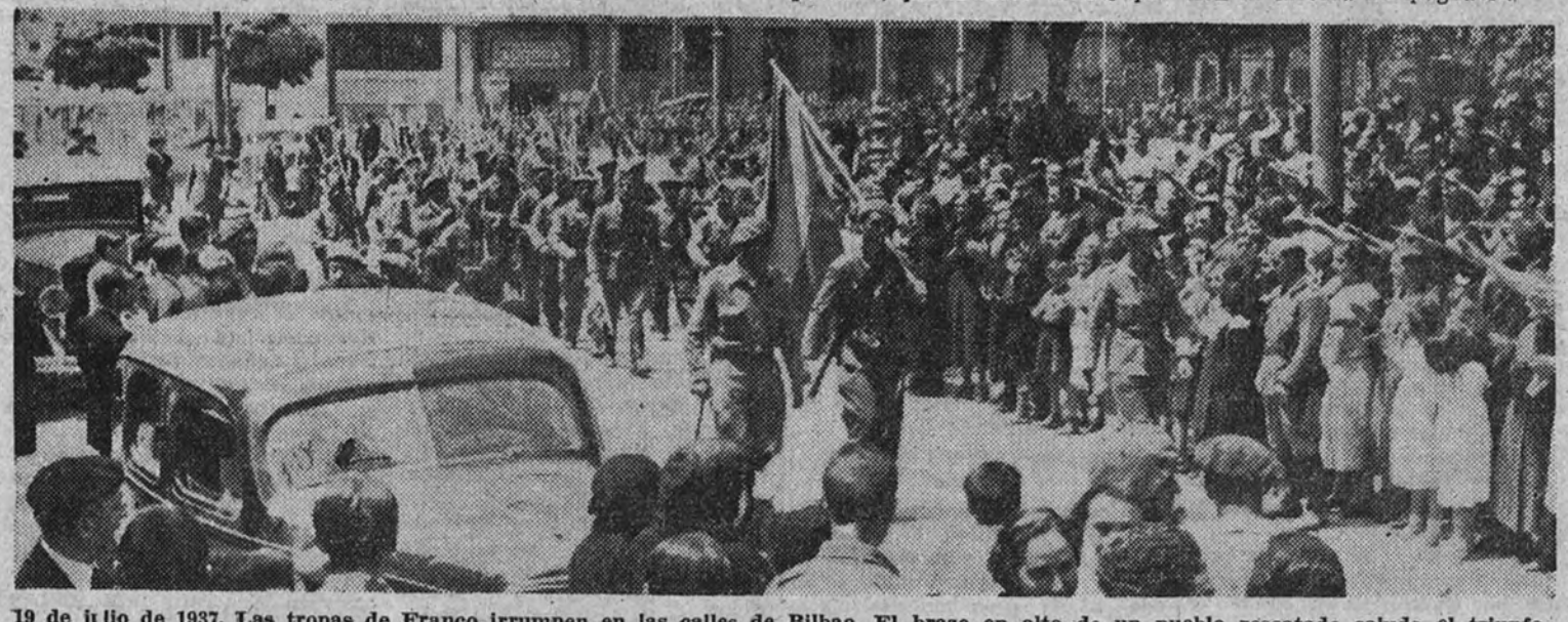
19 de julio de 1937. Las tropas de Franco irrumpen en las calles de Bilbao. El brazo en alto de un pueblo rescatado saluda el triunfo de España

Al siguiente día, el Generalísimo de los Ejércitos nacionales oía misa en la Basílica de Begón para ofrecer a Dios la expugnación de la villa inexpugnable.