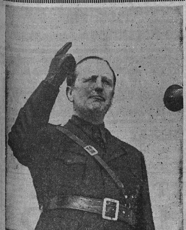
El ministro de Agricultura, camarada Fernández Cuesta, durante su discurso de Barajas.

Si eres falangista pon en tus cartas el sello JOSE ANTONIO; pide en tus compras el sello JOSE ANTONIO.