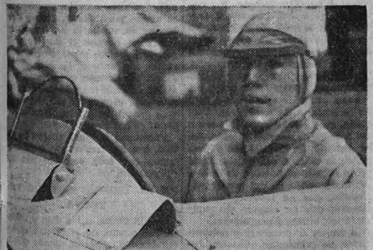
El conductor francés Jean Pierre Wimille, que, conduciendo un Bugatti, ha ganado las Veinticuatro Horas de Le Mans

SEVILLA 18. Se ha clausurado hoy la Semana Deportiva del S. E. U., con las finales, jugadas en el estadio ante muchísimo público. El campeonato, engalanado, presentaba magnífico aspecto. En los palcos de honor, junto a las autoridades locales, las jerarquías del S. E. U. En "handball" quedó campeón de Andalucía el equipo de Sevilla, al vencer por 2 a 0 al de Huelva. En cambio, en fútbol, se produjo la sorpresa de la derrota de Sevilla, por el conjunto representativo de Almería. El encuentro, muy competido, terminó con la victoria de este equipo por 1 a 0. Por último, entre ovaciones, desfilaron los atletas de las distintas representaciones del S. E. U., con sus banderas.