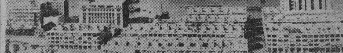
La Concesión de Hong-Kong, escenarió estos últimos días de la tensión anglojaponesa.

JAFFA 20.—Otras dos bombas han hecho explosión en esta ciudad; una de ellas, en la Oficina