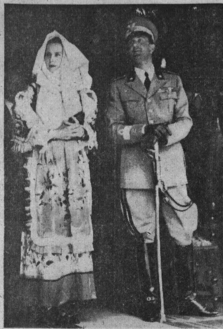
Los príncipes de Piemonte han asistido en Cerdeña a una fiesta local. La princesa acudió vestida a la manera típica.

LONDRES 20.—Cuatro mil «coolies» chinos que trabajan en las obras de fortificación de la base naval inglesa de Singapur, se han declarado en huelga por considerar insuficientes los sueldos que perciben. (Efe.)