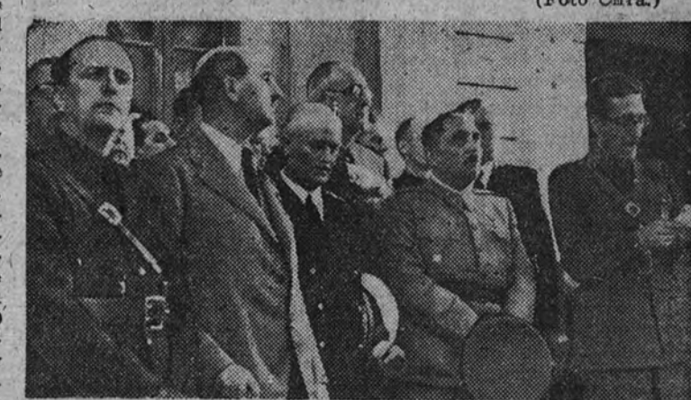
Rafael Sánchez Mazas leyendo su discurso, en el que, en nombre de F. E. T. y de las J. O. N. S., hace entrega de los restos de Julio Ruiz de Alda a Estella, su ciudad natal.

TU HIJO DEBE SER VACUNADO ANTES DE LOS SEIS MESES, Y SE REVACUNA CONTRA LA VIRUELA, POR LO MENOS, CADA SEIS AÑOS