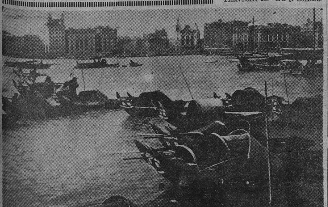
JAPON.—Embarcaciones, orientales frente a los edificios de la Concesión Internacional en Shanghai

Nos anuncia la Dirección de nuestro querido colega “ABC” que no podrá publicar su número de hoy.