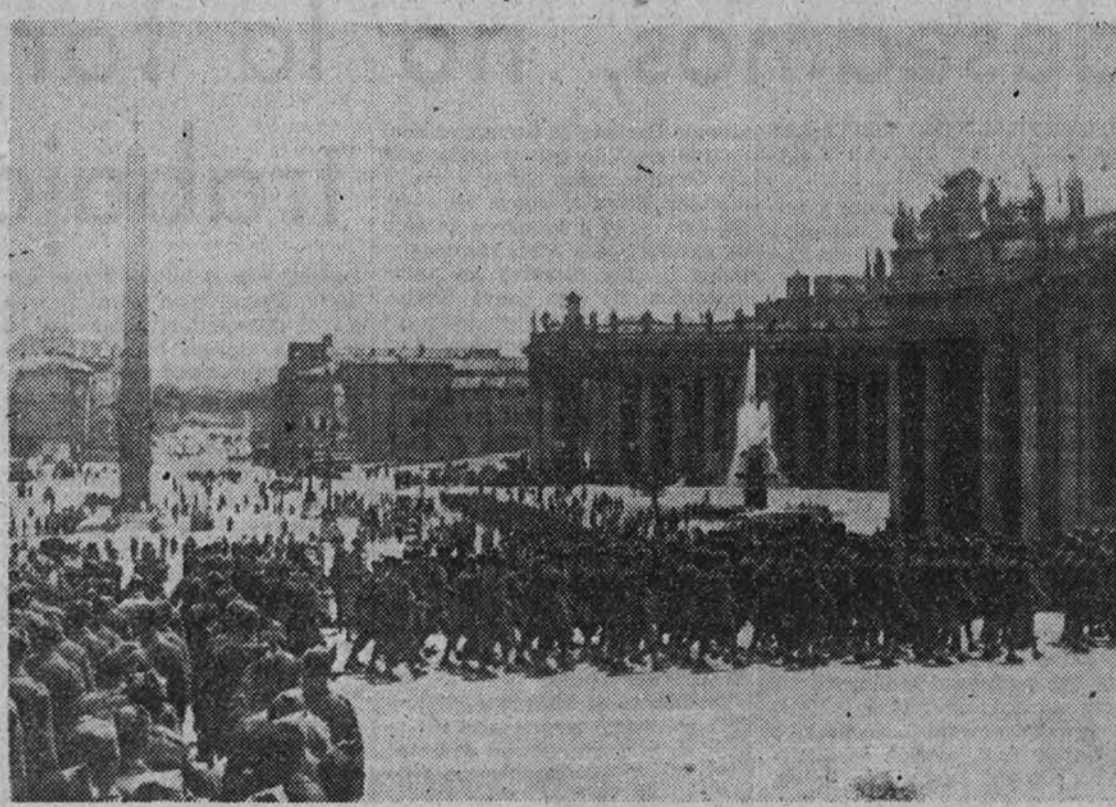
Los legionarios españoles desfilan por la plaza de San Pedro.