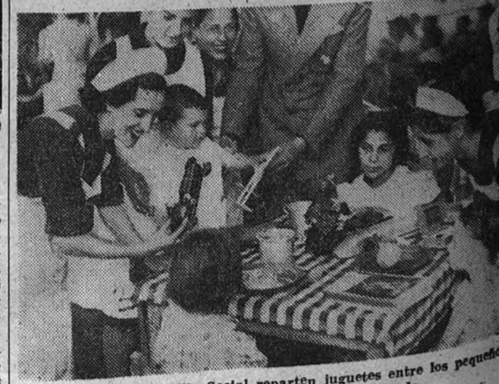
Las señoritas de Auxilio Social reparten juguetes entre los pequeños de la zona de Redondo, que asisten al comedor Onésimo Redondo.