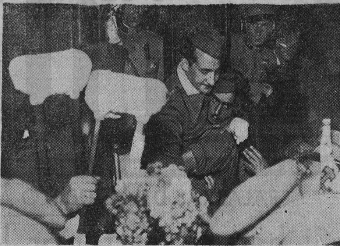
El regreso de los "Viriatos" a Portugal ha sido motivo de entusiásticas manifestaciones por parte de los portugueses, que salieron a cubrir de flores a los héroicos voluntarios. Un mutilado es ayudado a bajar del tren.

El aumento del precio de suscripción es debido a la obligación del pago de cinco céntimos por ejemplar de los domingos a la Dirección de Propaganda y Prensa.