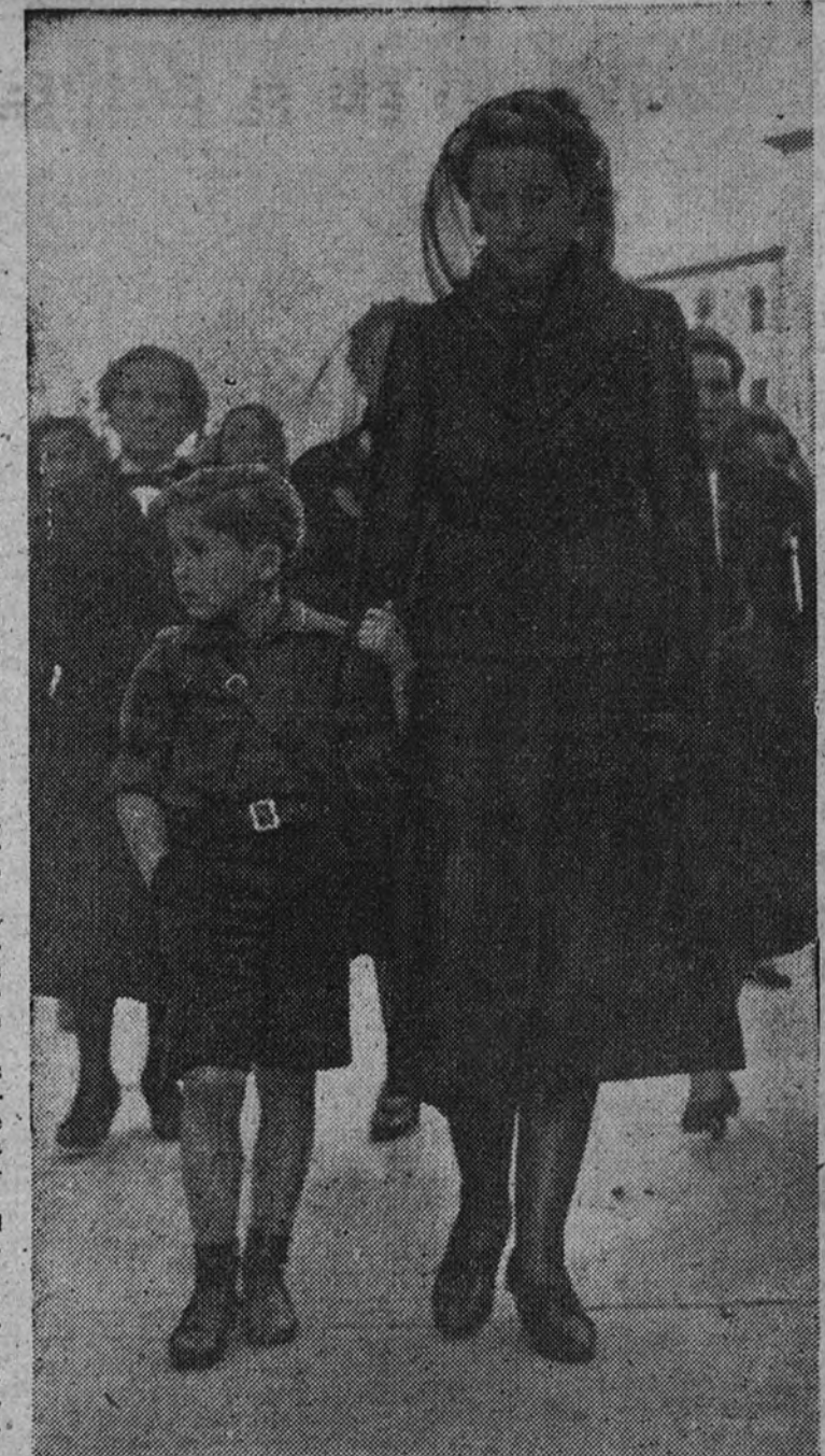
La viuda e hijo de Julio Ruiz de Alda en la presidencia del duelo familiar en el acto del traslado de los restos de Ruiz de Alda.

LA EFICACIA DE LOS SISTEMAS DEFENSIVOS En septiembre de 1938, cuatro meses después de Hitler haber dado la orden, gran parte del programa estaba realizado, y hoy, después de seis meses, las fortificaciones alemanas de la zona occidental están terminadas. Quizá existan personas de las que estuvieran en la guerra y estudiaran el problema a detalle que se han sorprendido ante la importancia política y militar que se le otorga a las fortificaciones. En efecto, en la postguerra se pensaba que la utilidad de las fortificaciones permanentes en los modernos conflictos armados estaba definitivamente descartada. Es cierto que durante la Gran Guerra campos fortificados y plazas fuertes, como Lieja, Namor, Amberes, etc., fueron destruidos en tiempo relativamente breve. Pero la verdad es que todas estas fortificaciones estaban insuficientemente armadas. Y en el caso concreto de Lieja, los defensores no tuvieron tiempo de guarnecer los traveseros entre los fuertes.