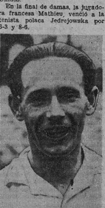
Jean Borotra, el vasco saltarín, de la vieja edad de oro del tenis francés, que en los campeonatos internacionales de París ha vuelto a brillar.