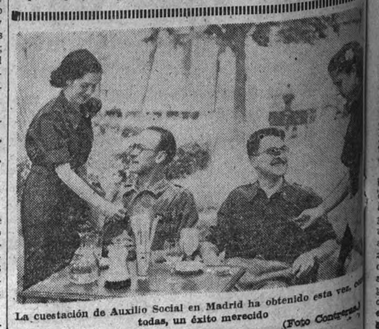
La cuestación de Auxilio Social en Madrid ha obtenido esta vez, un gran éxito.

No demores ni una hora tu ayuda, y llena, con la espléndida que te propusiste ayer, una «ficha azul» en Serrano, 6.