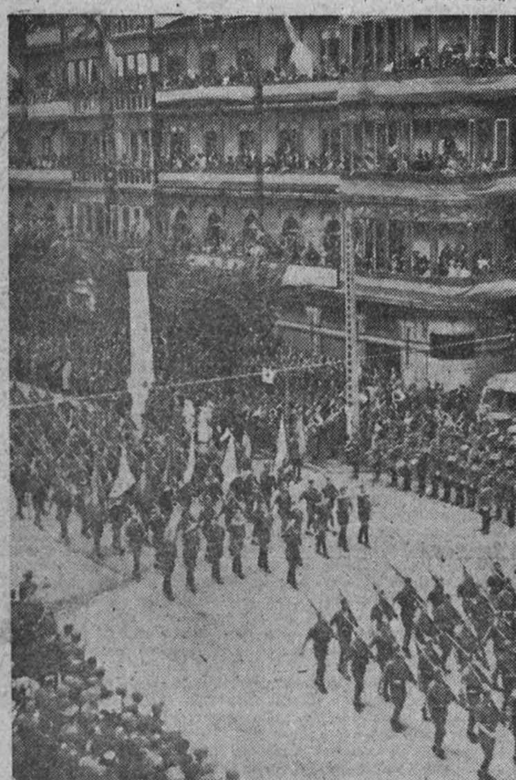
El desfile militar con motivo de las fiestas de la liberación de Bilbao. La Infantería pasando ante la tribuna del Caudillo.