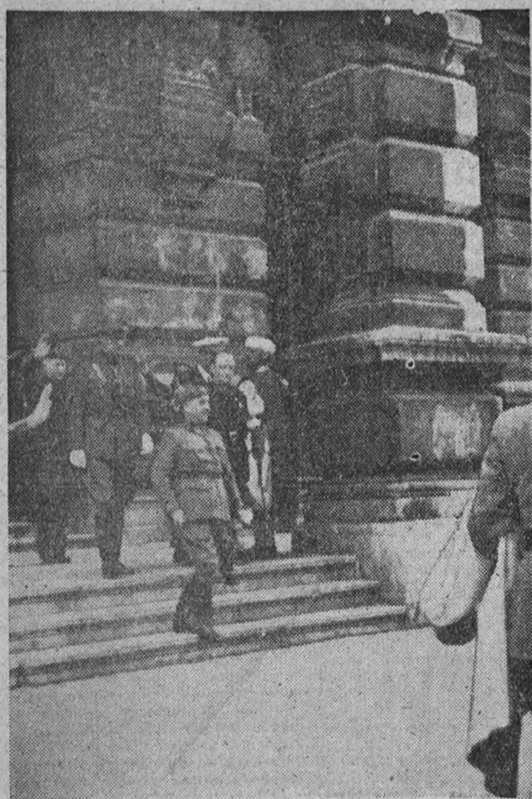
El Caudillo sale de la Diputación de Vizcaya.

AUXILIO SOCIAL NACIONAL QUE NINGUN HOMBRE DE MIRAR LA PERDIDA DE SU SEMEJANTE SIN TENDRE LE LA MANO