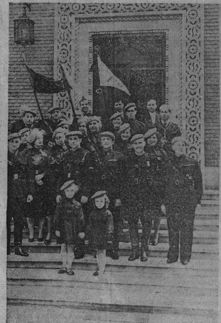
La Misión española al salir del acto en que la O. J. rumana le hizo entrega de dos banderines para la Organización española.

Madrileño: la "ficha azul" llama a tu conciencia de español pidiéndote que la suscribas con humana emoción, con sentido de justicia, con desprendimiento de amor.