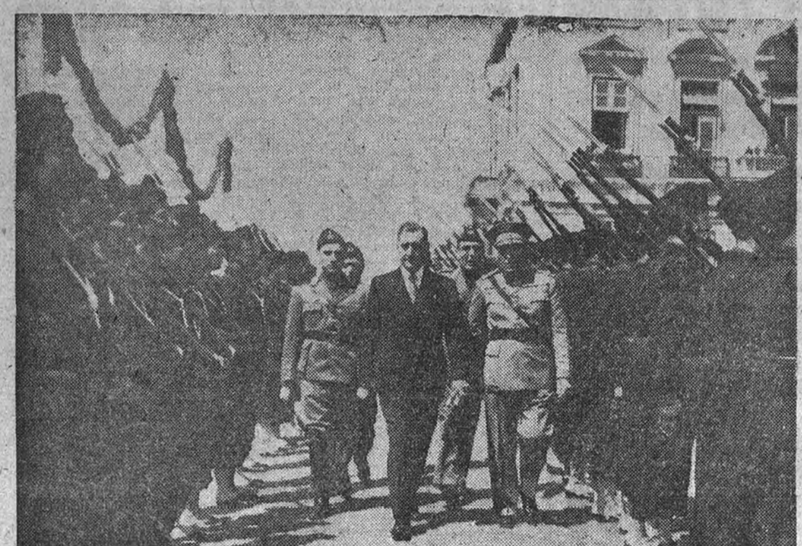
El señor Salazar revista a las tropas que desfilaron con motivo del trece aniversario de la Revolución Nacional portuguesa.