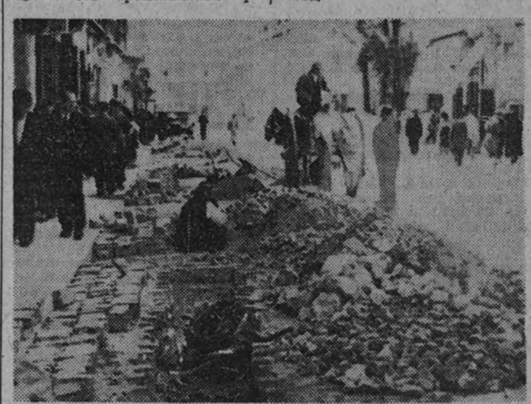
El Ayuntamiento ha votado un importante crédito para el arreglo de las calles. Una de ellas en plena reparación.