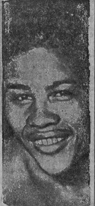
El negro Joe Louis, vencedor de Tony Galento, que ahora se enfrentará a Lou Nova, el joven pugilista que derrotó a Max Baer.

Se anuncia que el campeón del Mundo podrá en juego su título.