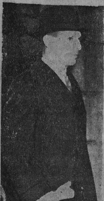
El Rey de Grecia, que ha llegado a Italia.

El ilustre Prelado de Sevilla, Monseñor Segura, se ha