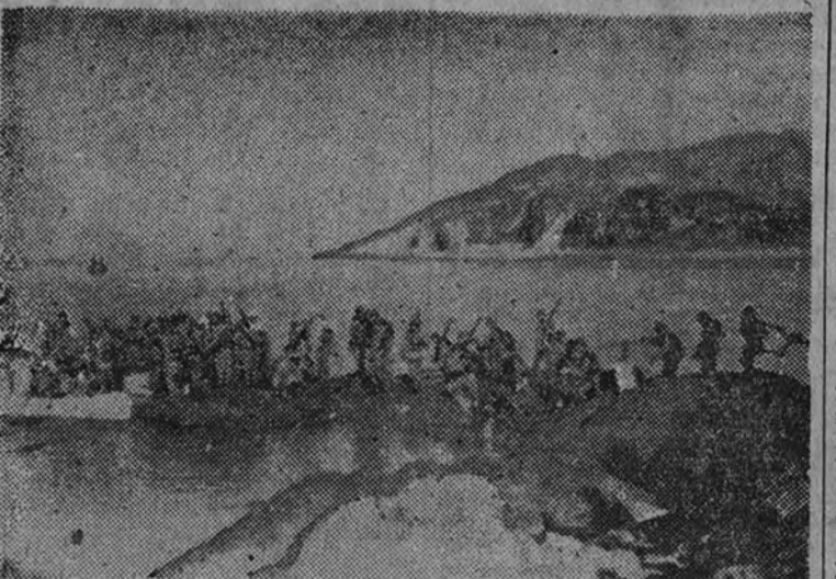
Desembarco de tropas japonesas en las costas chinas.

TIENTSIN 29.—Ha mejorado notablemente el abastecimiento de la Concesión británica. Los artículos llegados esta mañana al mercado son casi suficientes para el consumo actual, aunque de todos modos no se ha llegado todavía a la normalidad. La inspección de mercancías en los puestos de vigi-