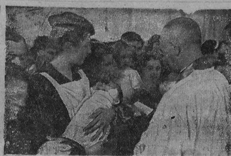
Recepción por el Ejército del Aire, se celebró en la tarde de ayer la recepción del bautizo de sesenta aviones madrileños.

Y vamos con el Estudiante, a quien dejamos para el último—otro día fue el primero—porque con el porcentaje de La Serna cargó con tres toros, y será de quien más haya que hablar. Comenzaremos por decir que esta tarde—como Curro Caro—ni ha mejorado ni empeorado su cartel. Lo tiene de valiente. Y valiente siguió. El Estudiante y Curro Caro han quedado, por las circunstancias, como base de esta media temporada. Pero ambos han mal en pensar que ahí puede quedar la cosa. Tres toros buenos en varas y capote le tocan en suerte al Estudiante. Uno de ellos—el cuarto, el de La Serna—llegó muy bien a la muleta, y otro—el quinto—pu-