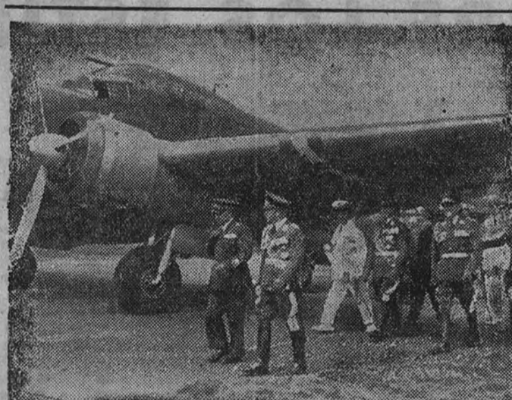
El general Vallo, jefe del Estado Mayor italiano del Aire, llega a Berlín.