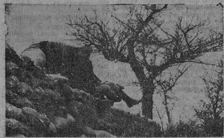
El general Moscardón en el momento de saltar el parapeto que separaba nuestras posiciones de las de los rojos en el sitio de Huesca