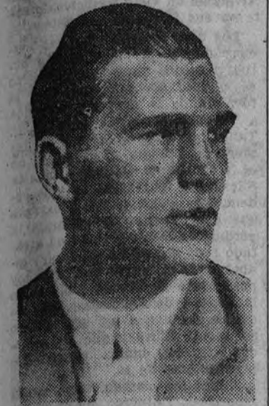
Max Schmeling, que en un solo "round" rescató el título de campeón de Europa.