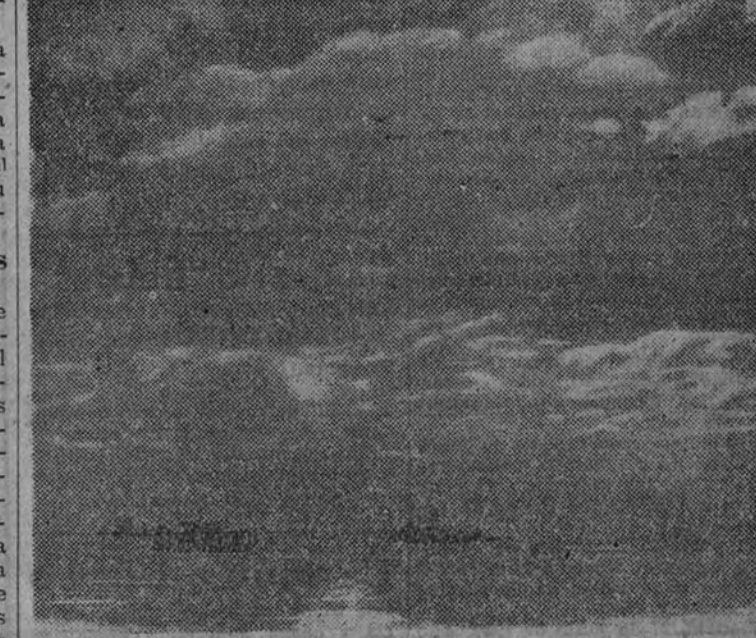
OSAKA.—Ante la presencia del Emperador japonés, ha tenido lugar una importante revista naval, en la que han participado más de cien navíos de la Gran Flota y numerosos aviones