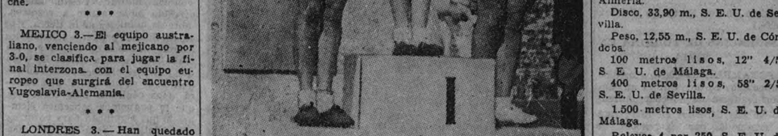
En los campeonatos femeninos italianos de atletismo celebrados en Milán, en la prueba de 80 m. vallas, la signorina Gestoni igualó el "record" mundial. Las tres primeras de la prueba saludan brazo en alto, sobre el pedestal de los vencedores, al estile clásico de los tiempos olímpicos.

Jabalinas, 26 metros, S. E. U. de Almería. Disco, 33,90 m., S. E. U. de Sevilla. Peso, 12,55 m., S. E. U. de Córdoba. 100 metros lisos, 12" 4/5, S. E. U. de Málaga. 400 metros lisos, 58" 2/5, S. E. U. de Sevilla. 1.500 metros lisos, S. E. U. de Málaga. Relevos 4 por 250, S. E. U. de Málaga, en 2' 26" 3/5. Salto de altura, 1,55 m., S. E. U. de Almería. Salto de longitud, 6,10 metros, S. E. U. de Córdoba. Debemos poner de relieve, por si algún entendido se llamara a engaño, que el peso se ha tirado a base de material no reglamentario, es decir, por bajo del peso ordinario en atletismo.