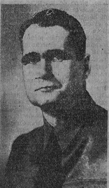
El interior de la iglesia de Santa Bárbara durante los funerales por los caídos en el castillo de Montjuich

Que la judería y la masonería internacional — prosigue — lo