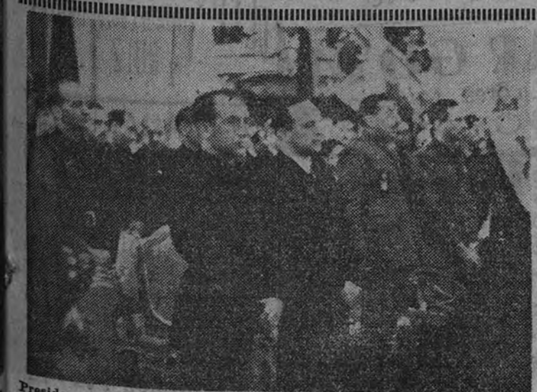
Presidencia del acto religioso, celebrado en la iglesia de Santa Bárbara, organizado por la Jefatura Provincial de F. E. T. y de las J. O. N. S., en memoria de los camaradas asesinados en los fosos de Montjuich

Los contratistas que no lo hicieran quedarán inculcados en rescisión, con pérdida de fianza, y las obras serán terminadas por nueva contratación o por administración. (Cifra.)