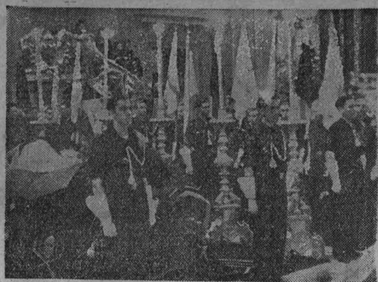
El interior de la iglesia de Santa Bárbara durante los funerales por los caídos en el castillo de Montjuich

ROMA 3.—Los diarios romanos de hoy hacen destacar la importancia de las manifestaciones de la población del Reich en favor de su regreso a Alemania y del discurso pronunciado por el adjunto del Führer, Rudolf Hess. La Prensa declara que se trata de "advertencias" a los agitadores belicistas. También declara por unanimidad que los discursos pronunciados el domingo por el presidente de la República francesa y por Chamberlain son una consecuencia lógica de la campaña alarmista con la cual mantienen los Estados democráticos la psicosis de guerra, la cual está destinada por una parte a constituir una base favorable para dar una política aventurera y por otra parte se utiliza para tratar de disimular los innumerables fracasos de la política de "cerco".