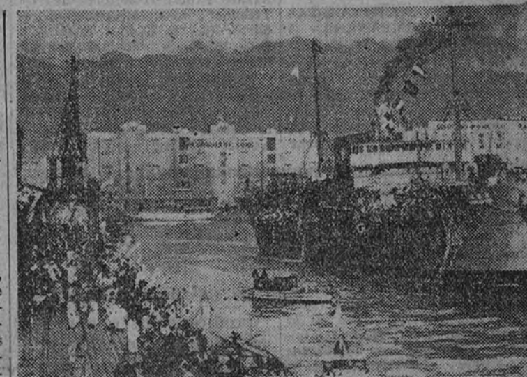
KOBE (Japón).—Salida de un transporte conduciendo tropas para el Ejército de Rivantung, en Manchuria

BURGOS 3.—EL EMBAJADOR DE ALEMANIA EN ESPAÑA VON STOHRER, HA ENTREGADO AL MINISTRO DE LA GOBERNACION, D. RAMON SERRANO SUÑER, EL TITULO Y LAS INSIGNIAS DE LA GRAN CRUZ ALEMANA, QUE RECIENTEMENTE LE FUERON CONCEDIDAS POR EL FUHRER CANCELLER, HITLER. (Cifra.)