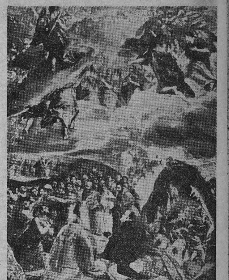
"El sueño de Felipe II", del Greco.

la Concepción extranjera ha mejorado para los súbditos británicos. En cambio, se han dictado severas restricciones para la circulación de los miembros de la colonia soviética. Varios de ellos han sido detenidos en los puestos de vigilancia japoneses y obligados a desmenuarse ante los centinelas. Por otra parte, algunos rusos especialmente sospechosos han sido sometidos a un estrecho interrogatorio para averiguar su posible relación con los incidentes de la frontera manchú-mogol. (Efe.)