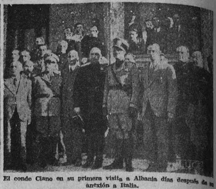
El conde Ciano en su primera visita a Albania días después de la anexión a Italia.

En Málaga, en Gortiz (Bilbao) y en Las Palmas van a instalarse los tres primeros, y los nombres de "Alcázar", "Oviedo" y "Crucero Baleares" serán el título de esos campamentos nacionales de la Organización Juvenil.