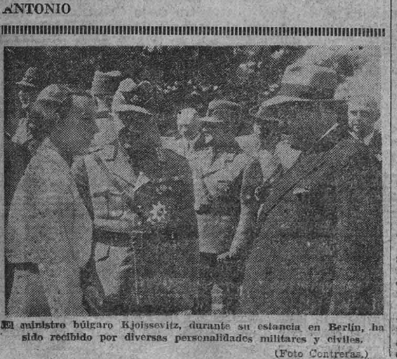
El ministro búlgaro Rjosovitz, durante su estancia en Berlín, ha sido recibido por diversas personalidades militares y civiles.

Ten fe tú también, y ayúdanos comprando el sello JOSE ANTONIO