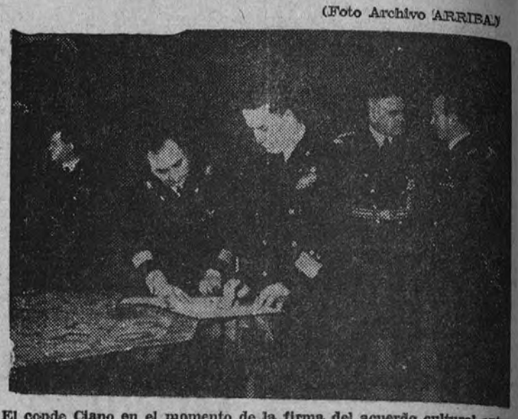
El conde Ciano en el momento de la firma del acuerdo cultural entre Italia y Alemania.