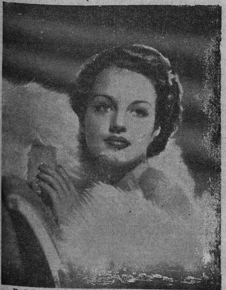
Rochelle Hudson, protagonista de "Claro de luna en el río".