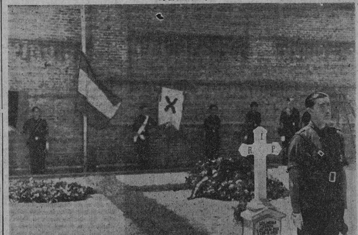
Después del acto del cuartel de la Montaña, los asistentes se trasladaron al Cementerio del Este, depositando flores en las tumbas de los caídos.