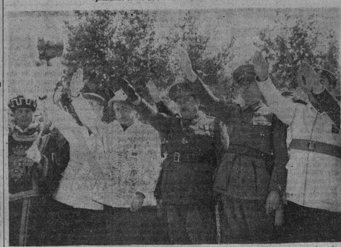
El presidente de la Diputación, el jefe provincial de Madrid, el gobernador civil, el general Asensio, miembro de la Junta Política de F. E. T. y de las J. O. N. S. y el alcalde de Madrid en la presidencia del acto.