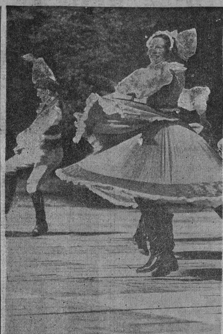
BERLIN.—Bailes típicos con motivo de un festival organizado por la Prensa alemana

(Punto 10 del Estado nacionalsindicalista.)