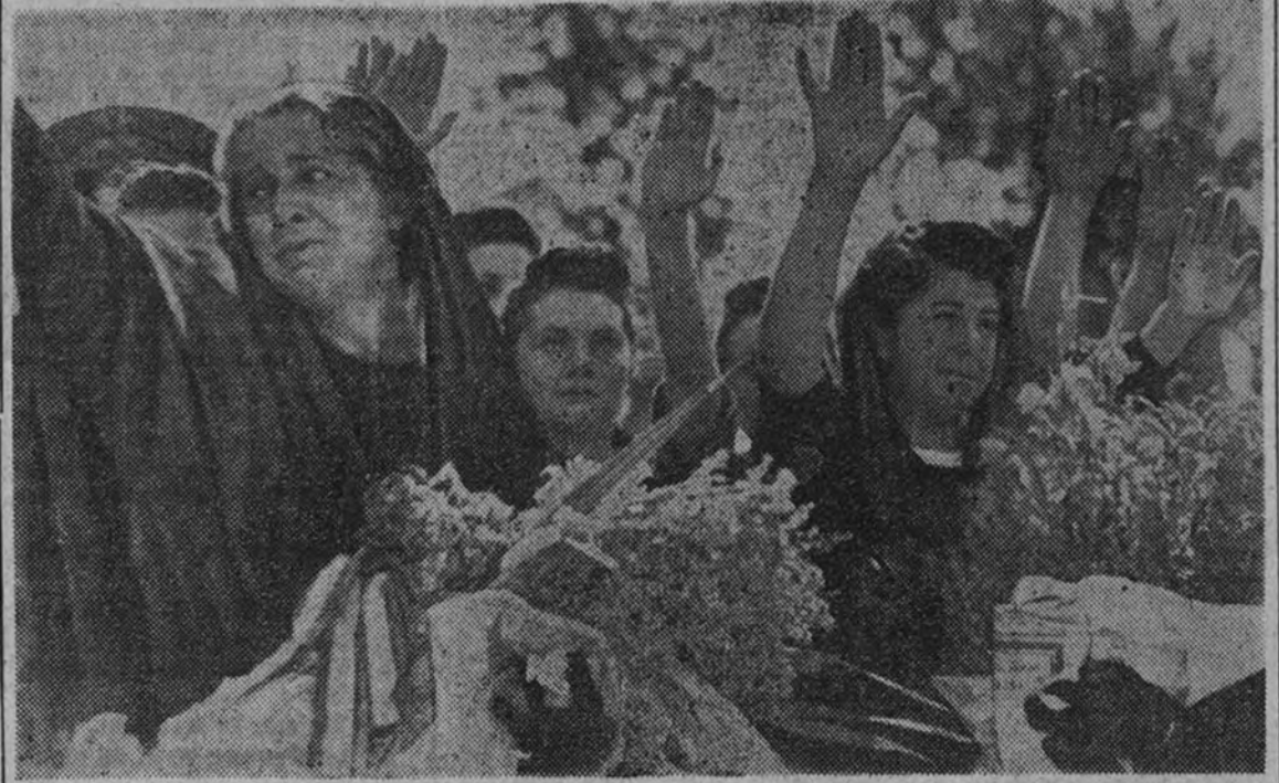
Homenaje de brazos en alto, de flores y lágrimas en el Cementerio del Este a los caídos en el cuartel de la Montaña.