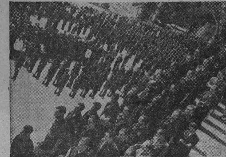
Aspecto que ofrecía la explanada del cuartel de la Montaña durante los actos celebrados ayer mañana. En primer término, los supervivientes de la heroica gesta.

Resto de España.—Vientos débiles o moderados, de dirección variable, predominando los del componente W. Cielos despejados o nubosos. Visibilidad bastante buena. Sierras franqueables en su mayor parte. Tiempo algo peor en Cataluña, donde puede producirse una gran agudización de la niebla.