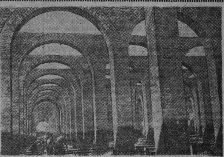
Las obras del Canal de Isabel II que se han reanudado.

ROMA 20.—El Instituto Nacional Fascista de Previsión Social, destinado a 200 millones de libras para la construcción de viviendas populares en Italia durante los años 1939 y 1940. Con estos, las sumas dedicadas a esta obra social desde 1887 se elevan a más de 500 millones. (Efe.)