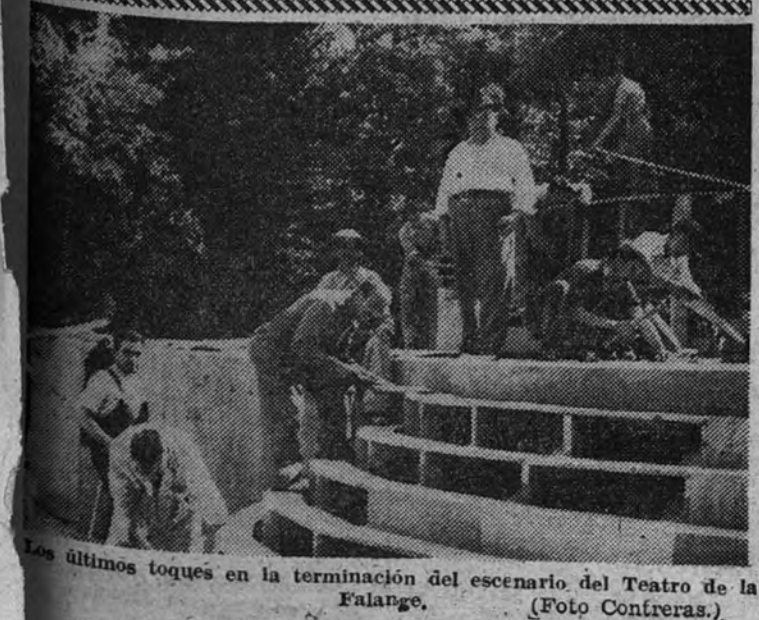
Los últimos toques en la terminación del escenario del Teatro de la Falange.