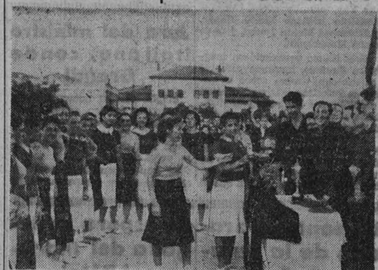
Las jerarquías del S. E. U., desde la presidencia, entregan los premios a las capitanas de los equipos, estudiantiles femeninos.