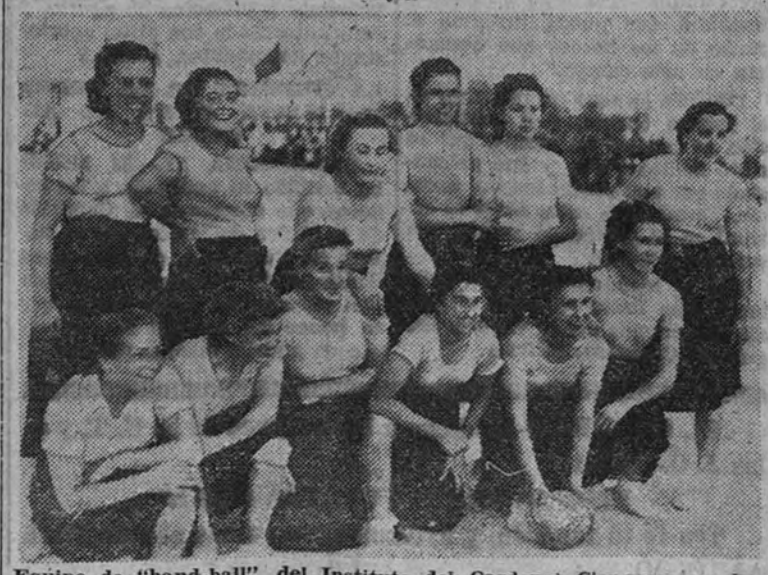
Equipo de "hand-ball" del Instituto del Cardenal Cisneros, que lucía "jersey" amarillo.