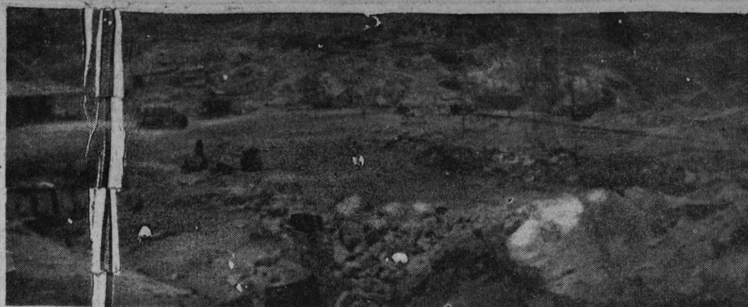
Vista general de la explanada del Alto.