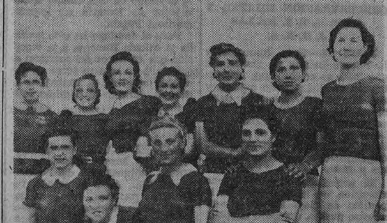
Equipo de "hand-ball", del Instituto de San Isidro, que lucía "jersey" rojo.