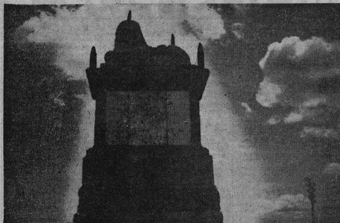
La silueta del león se destaca vigorosa, sobre un cielo de nubes, adornada con obuses.