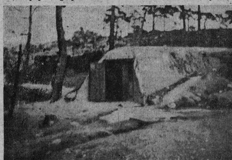
Una pintoresca guardia de "leones".

dos de España, cubiertos de sudor y exhaustos, ocupaba el Alto del León, cerrando a la plaza roja, el paso a las tierras imperiales de Castilla la Vieja y León.