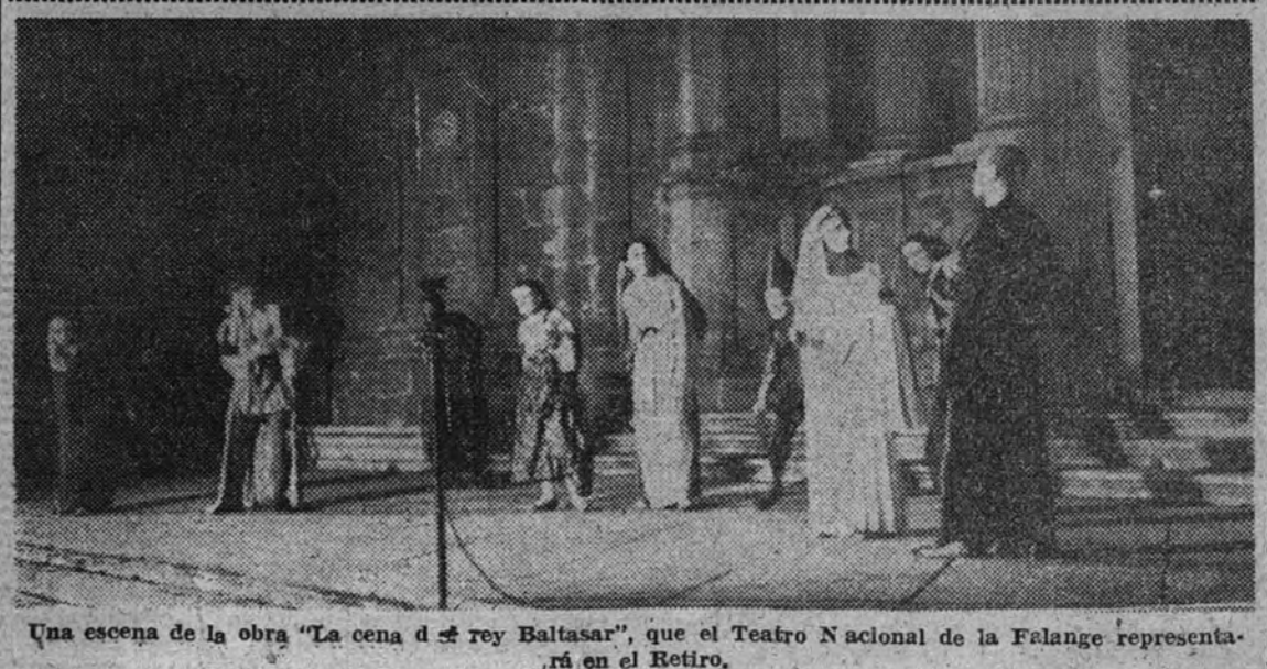
Una escena de la obra «La cena del Rey Baltasar», que el Teatro Nacional de la Falange representará en el Retiro.

«Mientras vos y el pueblo español celebráis, en el Año de la Victoria, el tercer aniversario de la iniciación de vuestra Revolución Nacional, el Gobierno y el pueblo italiano participan fraternalmente de vuestro júbilo. El pueblo italiano ha seguido con el mayor interés y entusiasmo las manifestaciones por vos y por el pueblo español tributadas al conde Ciano, manifestaciones que demuestran de manera irrevocable la solidaridad política y moral que une a nuestros dos pueblos. Recibid mis más amistosos saludos personales y mis votos más fervientes. MUSSOLINI» (Cifra.)