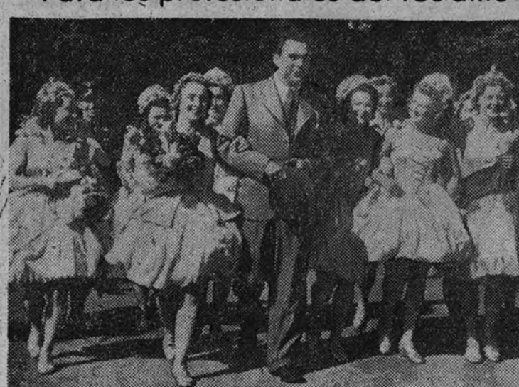
El boxeador y las bellezas, o un grato truco publicitario de Max Schmelling, con permiso—claro es—de su fotográfica esposa, Anna Ondra.

lo inusitado, de lo audaz. Por esto, la publicidad—surgida para servir esa dilección y deleitación—halló su mejor lucimiento en el hecho insolito.