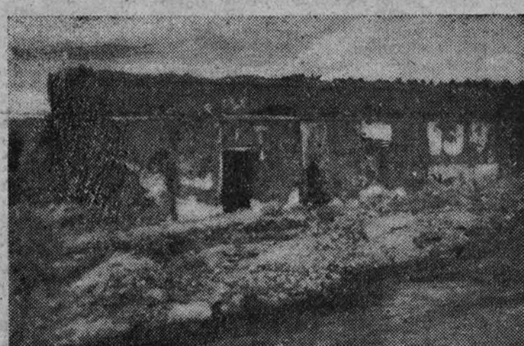
En estas ruinas estableció el coronel Serrador su puesto de mando el día del ataque.