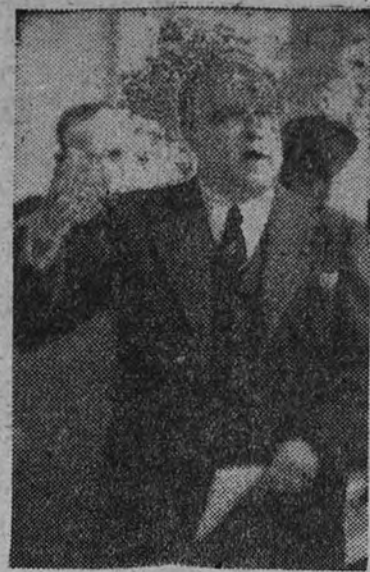
Don Eugenio d'Ors pronunciando un discurso con motivo de la apertura del Museo de Arte Moderno