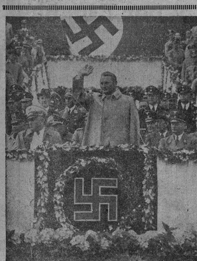
En el reciente Congreso de La Fuerza por la Alegría, el mariscal Goering, acompañado en la tribuna por el doctor Robert Ley, saludó a los congresistas.