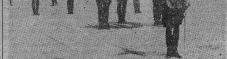
El general von Brauchitsch ante el monumento de Tannenberg con motivo de los actos del aniversario de dicha batalla (Foto Contreras.)

El periódico "Tribuna" dice: "Las falsedades que propaga la Prensa francesa no conjugan con las declaraciones de amistad hacia España que dicen sentir. Estas declaraciones han brotado, claro está, después de la victoria de Franco. Al pueblo español se le ofrece una nueva ocasión de conocer a sus verdaderos amigos y enemigos. (Efe.)"