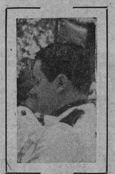
POR EL ARTICULO TITULADO "PAISAJE DE GUERRA"