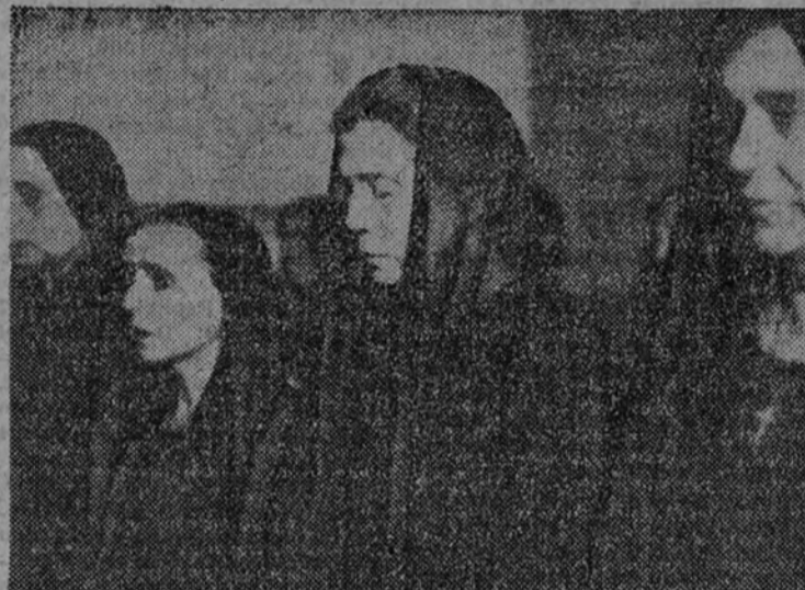
En la Tenencia de Alcaldía del distrito del Hospicio se celebró ayer un reparto de donativos a las viudas y huérfanos de periodistas y agentes de Seguridad asesinados por los rojos.