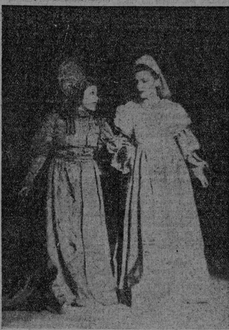
señanza que, al desarrollarse, pueda fructificar en un engrandecimiento social y cultural del espectador.

Estos triunfos, conseguidos antes de hacer su aparición en la escena, hablan ya del afán de superación que anima al "Carro de la Farándula", que se propone hacer representaciones públicas en los diversos pueblos de la provincia, siempre al estilo de las que se hacían en los gloriosos tiempos del Siglo de Oro. Entre sus propósitos figuran, además, el hacer en cada caso una nueva obra, de acuerdo con el momento en que se represente o con las circunstancias, a que es debida la representación, no repletiendo, por consiguiente, de una manera sistemática su repertorio, que sólo en un mes alcanza ya los dos autos sacramentales mencionados: el entremés de Cervantes "La guardia cuidadosa" y una comedia clásica de uno de nuestros me-