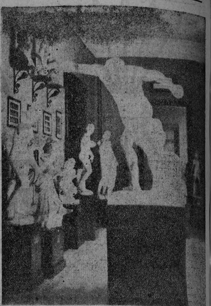
Un aspecto del Museo de Reproducciones Artísticas, cuya reapertura tuvo lugar ayer.