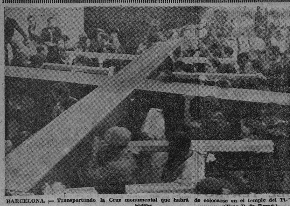
BARCELONA.—Transportando la Cruz monumental que habrá de colocarse en el templo del Tibidabo.