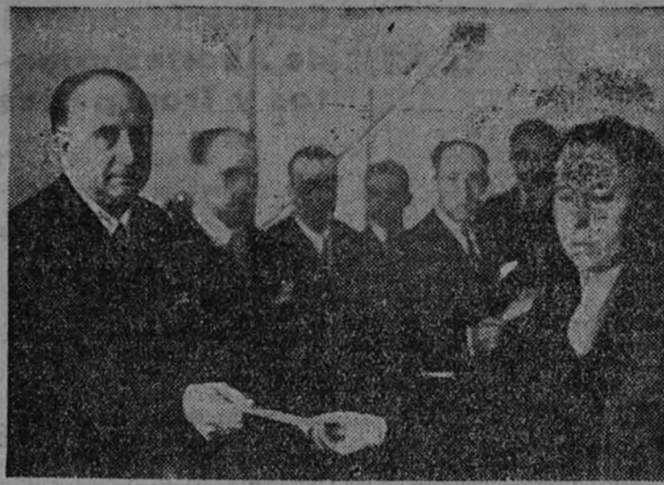
El alcalde de Madrid hace entrega de los donativos a las viudas y huérfanos de periodistas y fuerzas de Seguridad.

VALENCIA 28.—El domingo, día 30, se inaugurará el campamento de Alcobierre, de las Organizaciones Juveniles. El acto