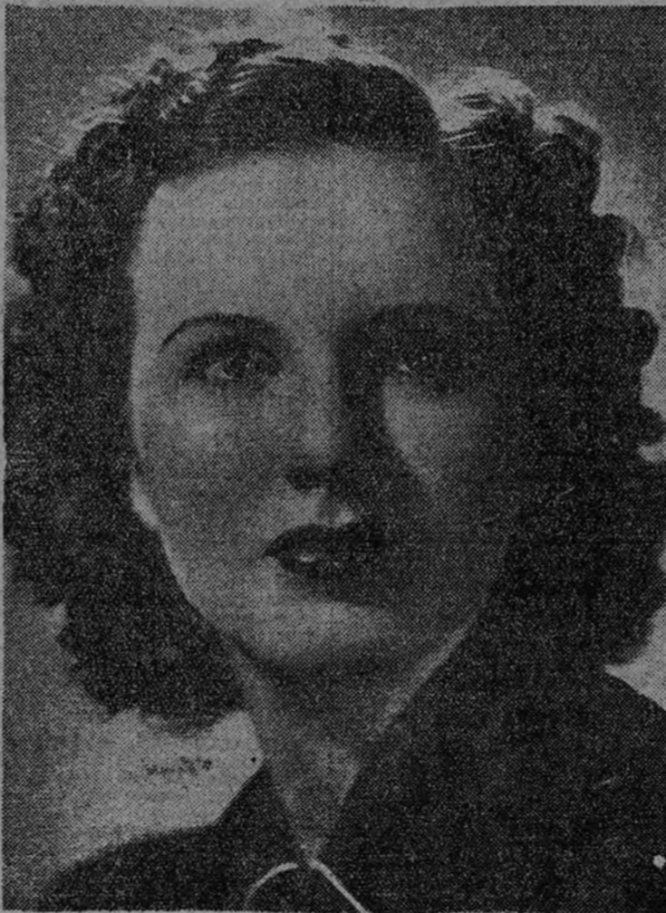
Diana Durbin, nueva atrayente figura del cine yanqui.

A la obra de amor, abnegación y sacrificio que realizan nuestras camaradas de la Sección Femenina pudes y debes contribuir adquiriendo el sello JOSE ANTONIO