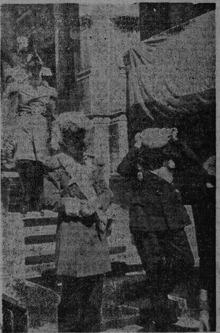
El conde Herculani, jefe de la Misión de la Orden de Malta, y el ministro plenipotenciario de la Orden en España, marqués de Natero, di Sessa, salen de cumplimentar a Su Excelencia el Jefe del Estado.

HONG-KONG 28.—Han desembarcado en Cantón dos divisiones de tropas japonesas procedentes de Formosa. En los medios bien informados se cree que el Estado Mayor japonés prepara una nueva ofensiva en la China del Sur, hacia Pakhoi. (Efe.)