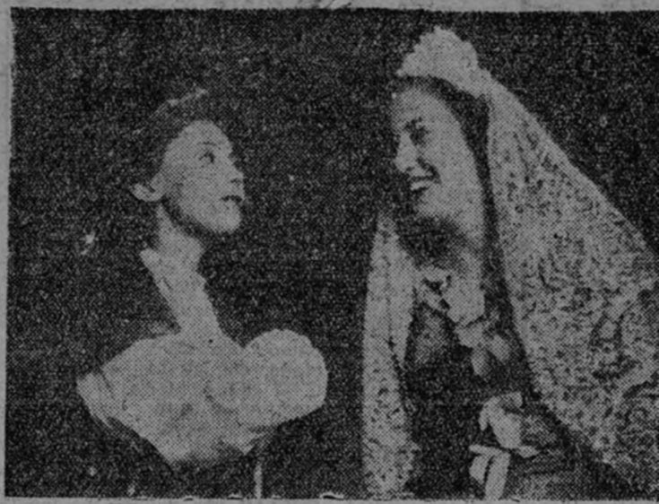
montado "El carro de la Farándula" en quince días.

Estos triunfos, conseguidos antes de hacer su aparición en la escena, hablan ya del afán de superación que anima al "Carro de la Farándula", que se propone hacer representaciones públicas en los diversos pueblos de la provincia, siempre al estilo de las que se hacían en los gloriosos tiempos del Siglo de Oro. Entre sus propósitos figuran, además, el hacer en cada caso una nueva obra, de acuerdo con el momento en que se represente o con las circunstancias, a que es debida la representación, no repletiendo, por consiguiente, de una manera sistemática su repertorio, que sólo en un mes alcanza ya los dos autos sacramentales mencionados: el entremés de Cervantes "La guardia cuidadosa" y una comedia clásica de uno de nuestros me-