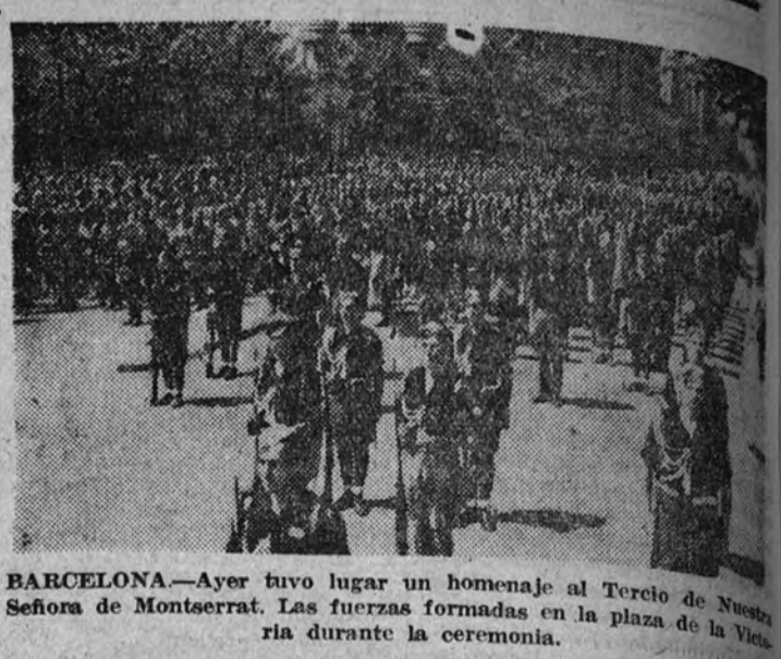
BARCELONA.—Ayer tuvo lugar un homenaje al Tercio de Nuestra Señora de Montserrat. Las fuerzas formadas en la plaza de la Victoria durante la ceremonia.

En el primer tercio del sexto de la tarde se destacaron unos pases finos de Yoni. La faena de muleta es breve, rematada de una estocada, de la que rodó el novillo. (Cifra.)