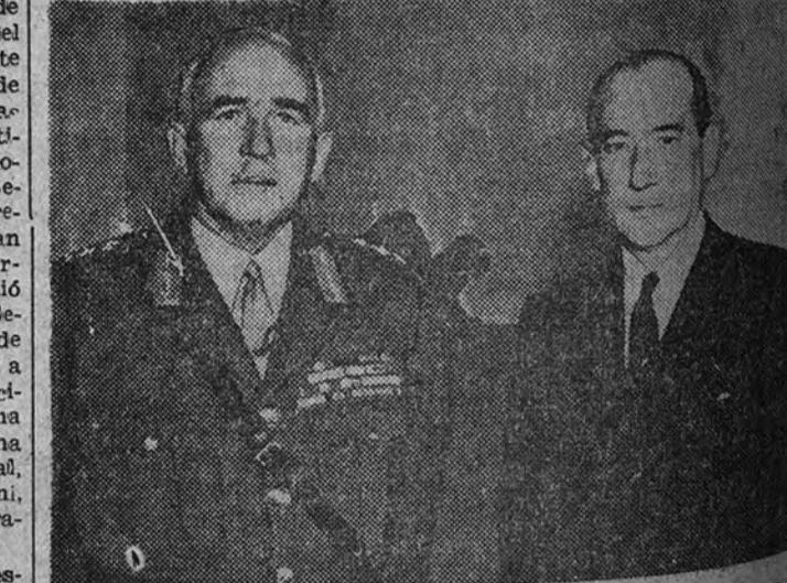
Durante su estancia en Varsovia, el general inglés Ironside fué recibido por el ministro de Negocios Extranjeros, coronel Bodo.