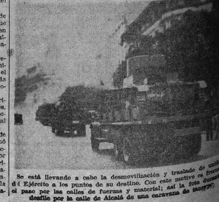
Se está llevando a cabo la desmovilización y traslado de unidades del Ejército a los puntos de su destino. Con este motivo se formó el paseo por las calles de fuerzas y material; así la foto durante el desfile por la calle de Alcalá de una caravana de tanques.