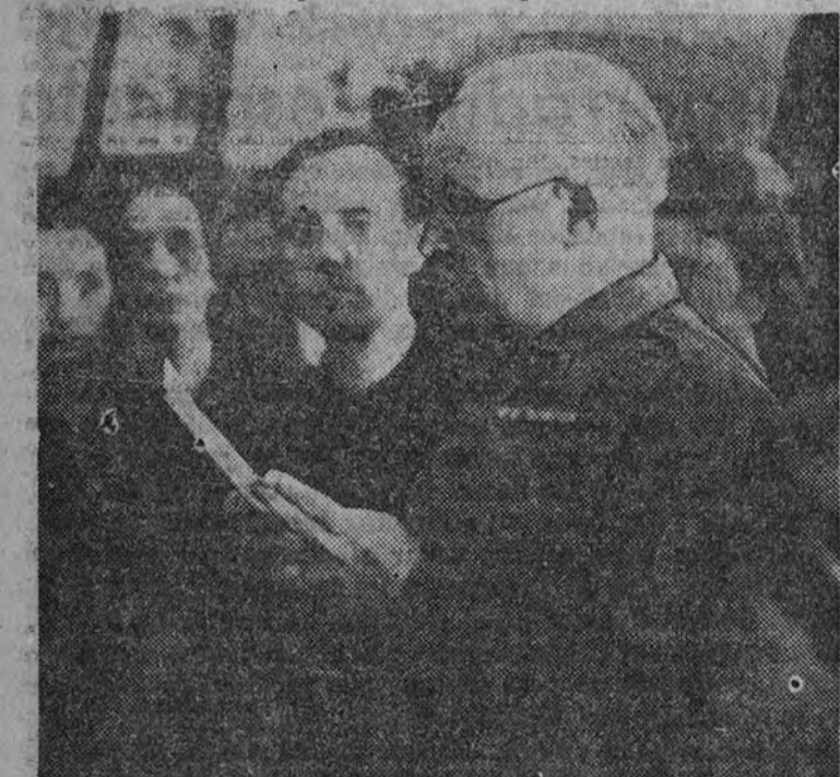
Ayer se inauguró la Escuela de Capacitación de la Sección Femenina (Delegación de Cultura). Al acto asistió el general Espinosa de los Monteros, que pronunció un discurso, y la delegada de Educación Nacional, camarada Lisarragui.

Un acto sencillo y bello ha tenido hoy lugar en el pequeño hotel que en Cádiz, 14, posee la Delegación de Cultura de la Sección Femenina, en el que se ha inaugurado la Escuela de Capacitación. En este acto, la intronización del Sagrado Corazón de Jesús en los locales en que ha de darse la enseñanza que ha de beneficiar a tantas admirables mujeres españolas, que al verse abandonadas en la vida por la desaparición del marido, encuentran el amparo seguro en la tutela del Estado de la nueva España. Hemos conseguido la victoria que ha de llevarnos en plaza.