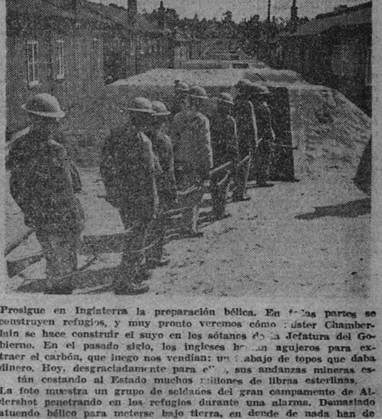
Prosigue en Inglaterra la preparación bélica. En las partes se construyen refugios, y muy pronto veremos cómo el Chamberlain se hace construir el suyo en los sótanos de la Jefatura del Gobierno. En el pasado siglo, los ingleses han agujerado para extraer el carbón, que luego nos vendían; un abajo de topes que daba dinero. Hoy, desgraciadamente para ellos, sus andanzas mineras están costando al Estado muchos millones de libras esterlinas. La foto muestra un grupo de soldados del gran campamento de Aldershot penetrando en los refugios durante una alarma. Demasiado atrevido hélico para meterse bajo tierra, en donde de nada han de servir ni las cartucheras, ni el casco, ni los fusiles.