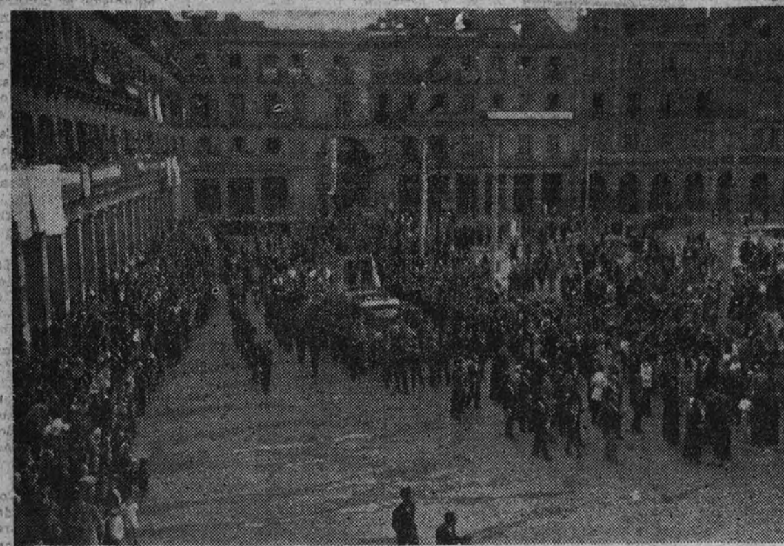
En medio del fervor popular ha sido trasladada a su iglesia la Virgen de la Paloma. La procesión a su paso por la plaza Mayor.

El pueblo renovó el domingo su fe en la santa Patrona y los barrios populares de la Latina se vistieron de gala para recibirla