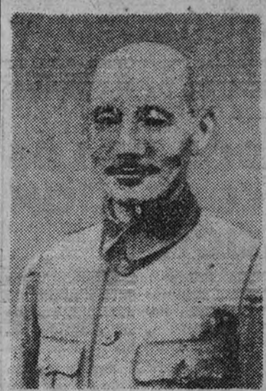
El general comunista Chang-Kai-Shek.

SHANGHAI 18.—En un Congreso celebrado recientemente el Partido Comunista