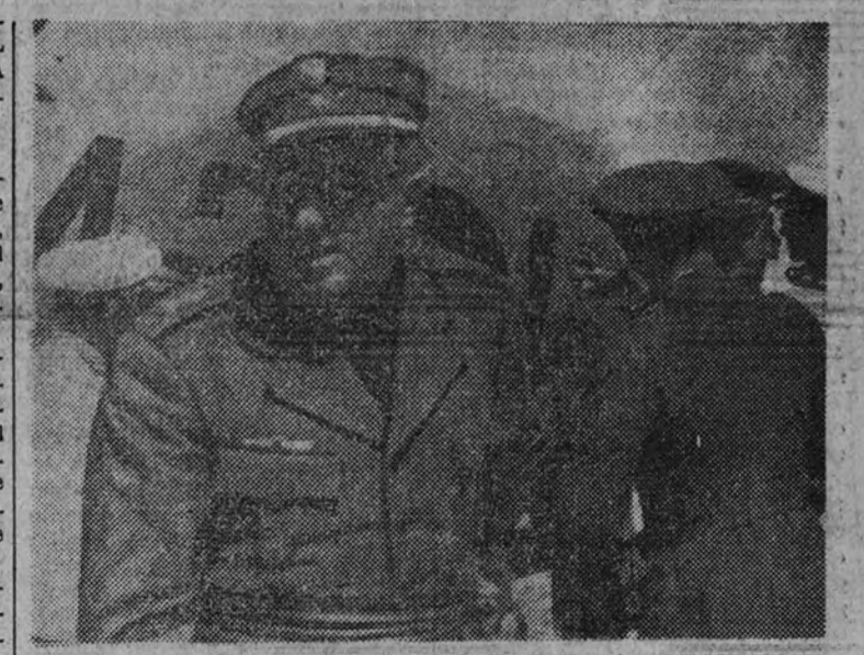
Ayer llegó a Madrid, procedente de Burgos, el ministro del Aire, general Yagüe, al objeto de hacer la presentación de los altos cargos de dicho departamento últimamente designados. El ministro, al descender del aparato en el aeródromo de Barajas.

Si el 17 de julio de 1936 el Ejército lanzó un grito, no de rebeldía, sino de patriotismo, que ha puesto a España en el camino de