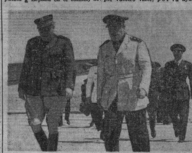
El ministro del Aire, general Yagüe, con el coronel Moreno Abella.

WASHINGTON 18.—El senador James ha declarado en un discurso que Roosevelt parece decidido a arrastrar a los Estados Unidos a una guerra europea o asiática, pero que un gran número de senadores están decididos a impedirlo. Añadió que creía que Roosevelt no triunfará en esta lucha. (Stefani.)