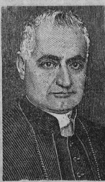
El cardenal Maglioni

nes. A los campesinos de esta nacionalidad del territorio de Olsa, se les están confiscando los bienes y han recibido la orden de que estén dispuestos para ser evacuados en el plazo de tres días. En Gleiwitz han sido detenidos diez funcionarios del partido alemán. Por este estado de cosas son muy numerosos los alemanes que intentan pasar la frontera. (Efe.)