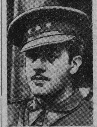
El camarada José Antonio Girón, delegado nacional y capitán honorario, a quien el Caudillo ha nombrado delegado nacional de ex combatientes.

GERONA 23.—Los ex combatientes de esta capital han cursado al camarada José Antonio Girón, delegado nacional de ex combatientes.