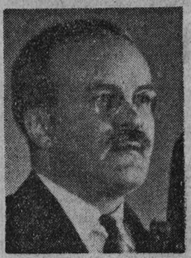
Von Ribbentrop

Si eres falangista pon en tus cartas el sello JOSE ANTONIO; pide en tus compras el sello JOSE ANTONIO.