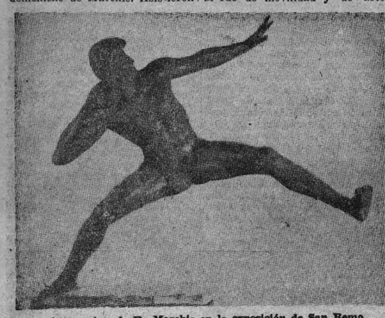
La última obra de De Marchis en la exposición de San Remo.

Entre las obras más meritorias de este último grupo figuran las esculturas de Mussolini, que tiene por lema "Metas lejanas"; los mariscales Badoglio y Cadorna, y los grupos deportivos, verdadero alarde de movilidad y de arte.