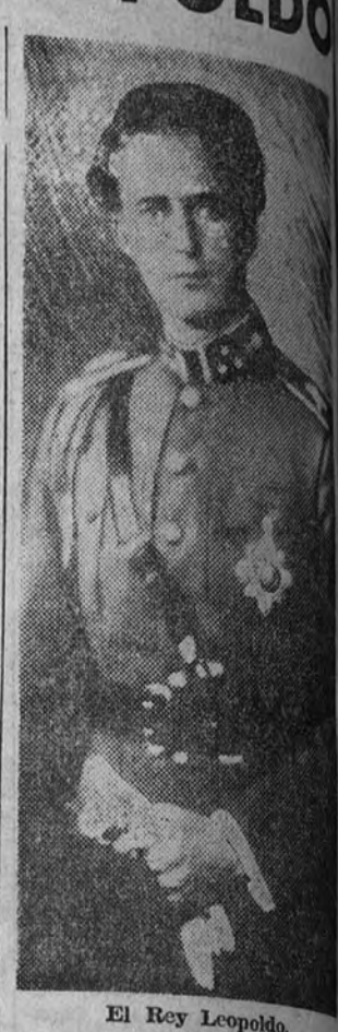
El Rey Leopoldo.

Los hombres son duros. Mas por encima de las pasiones está el deber de todos de mantener una paz,