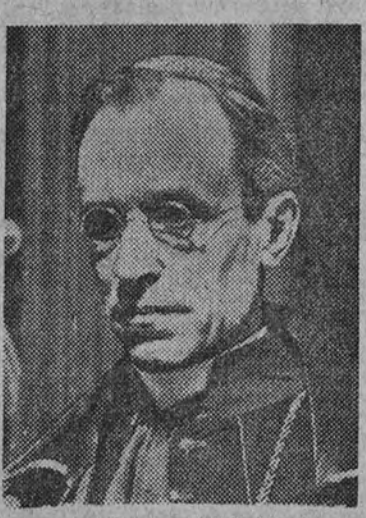
su Santidad Pio XII.

men todas las tentativas pacíficas que puedan hacer los Gobiernos y para que la fuerza de la razón, y no la de las armas, haga prevalecer la justicia. Las conquistas e imperios que no se basan en la justicia, no tienen la bendición de Dios.