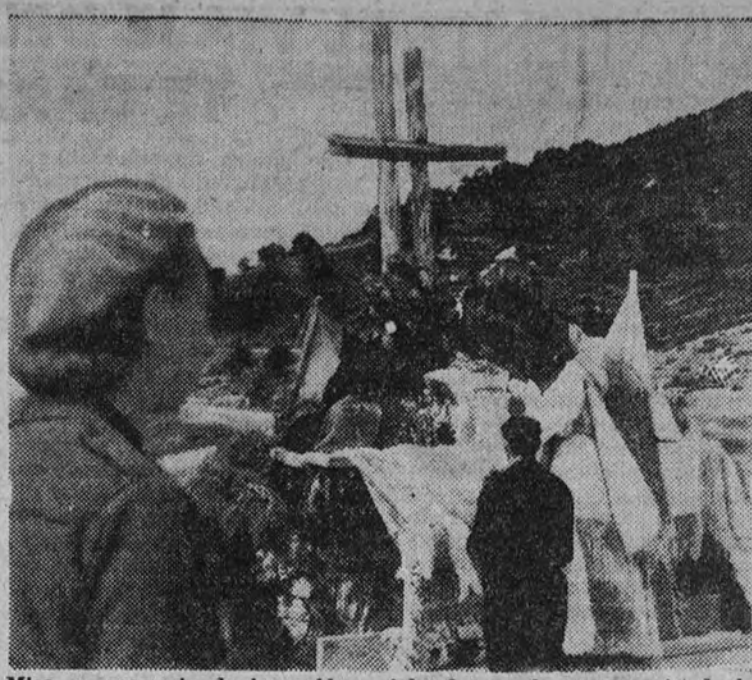
Misa en memoria de los caídos celebrada en el campamento de la sierra de los Cotos.