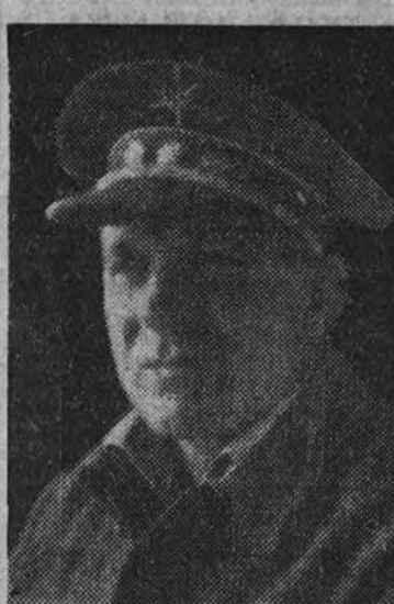
General Burunga, nuevo gobernador militar de Madrid.