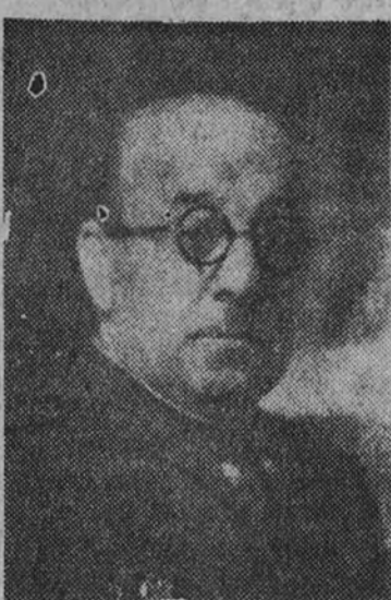
General Moscardó, jefe de la Casa Militar del Generalísimo.