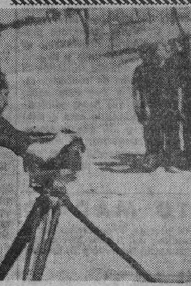
En pleno "rodaje" del documental "Flechas".

Por iniciativa de la Delegación Nacional de Organizaciones Juveniles se ha efectuado el documental titulado sencillamente "Flechas"; acaso precisa de adjetivos elogiosos concepto tan íntero, tan logradamente definidor y definitivo—, y como el reportaje de la concentración de Sevilla "Juventudes de España", que editó el Departamento de Cinemato-