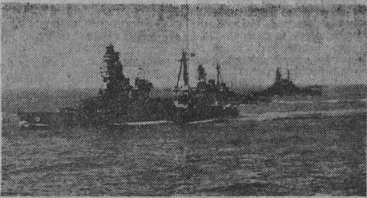
TOKIO, MANIOBRAS DE VERANO.—La flota japonesa desfila ante el Emperador.