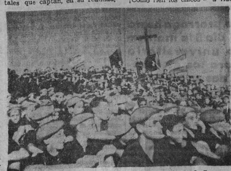
Escena de conjunto de la misma producción de O. J.

Por ejemplo: en los documentales que captan, en su realidad,