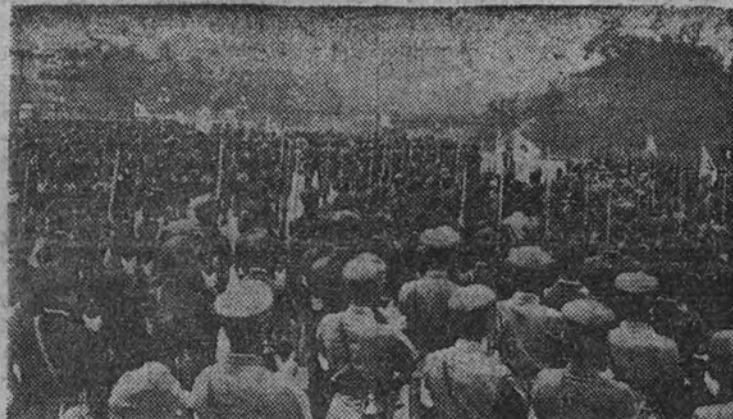
TOKIO.—Mil estudiantes japoneses aprovechan sus vacaciones de verano para incorporarse al Ejército que lucha en China.