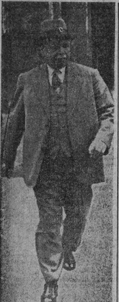
El general Bührer saliendo del Consejo Superior de Guerra francés, urgentemente reunido al comenzar las hostilidades.

Ejército de Tierra.—En el frente del suroeste prosiguen los combates encarnizados. Durante la noche última, nuestras tropas realizaron con éxito un ataque contra una unidad blindada del enemigo. En Pomerania continúa también la lucha. Nuestras fuerzas se han visto obligadas a evacuar Bydgoszcz y Grudziadz.