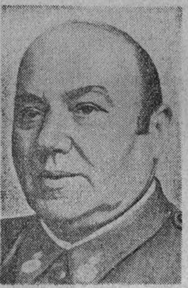
General de brigada D. Pedro Sotomayor, nuevo gobernador militar de Cádiz.