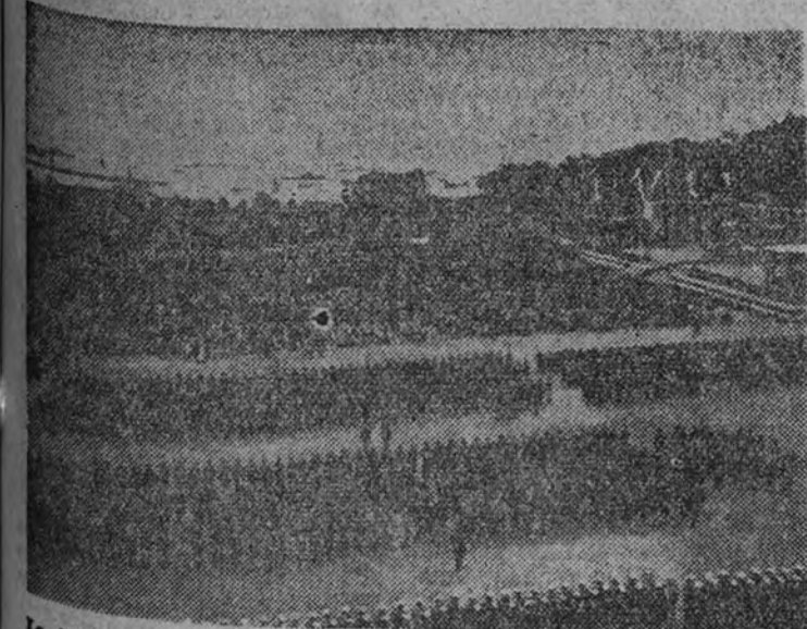
La última gran revista de las fuerzas polacas en el puerto de Gdynia