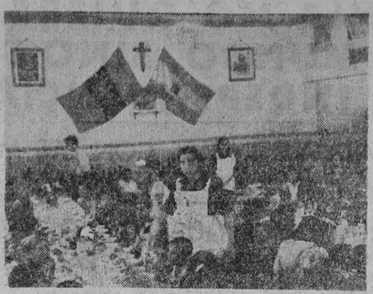
Se ha inaugurado en Vicalvaro un comedor infantil capaz para cuatrocientos niños

La Dirección General de Administración Local y la de Regiones Devastadas se instalarán, desde hoy, en el segundo piso del edificio que ocupaba el ministerio de Trabajo, en la calle de Amador de los Ríos.