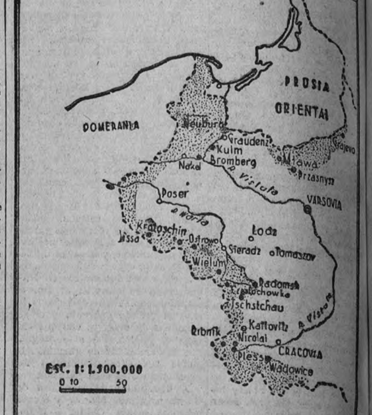
La zona señalada con puntos indica el límite aproximado del avance alemán

La victoriosa acción aérea de los pilotos del Reich, es, acaso, el