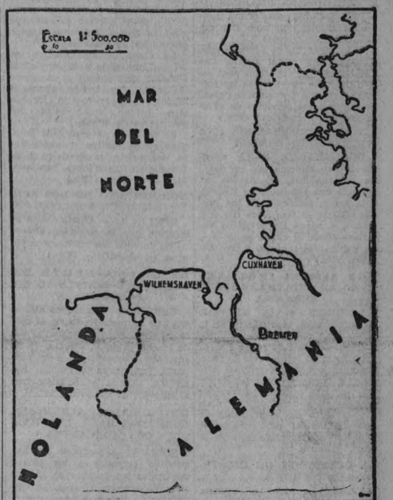
En esta zona se ha verificado por los aviones ingleses el primer acto de guerra contra Alemania

BUENOS AIRES 4.—La población argentina declara unánimemente que los países iberoamericanos deben observar la neutralidad en el conflicto actual. La declaración de la neutralidad brasileña ha causado gran impresión, así como el intercambio de telegramas entre los Gobiernos argentino y colombiano para subrayar la necesidad de que los pueblos iberoamericanos se solidaricen en la crisis actual. Argentina ha entrado ya en contacto con los demás Gobiernos de América del Sur para deliberar sobre esta neutralidad. (Efe.)