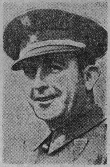
Don Francisco García Escámez, general de brigada, nuevo gobernador militar de Barcelona.