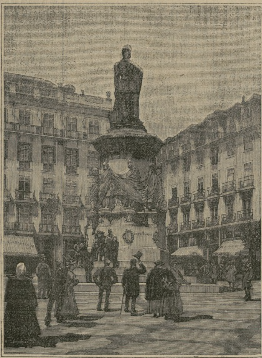
LISBOA.—El monumento á Camoens, cubierto de gasas.

Maxwell en 1865 de una manera bastante difícil y controvertible, ha adquirido todo su alto valor científico por las recientes experiencias del profesor Hertz, de Carlruhe, experiencias que verifican punto por punto las atrevidas hipótesis en que basó sus cálculos el sabio inglés. En una conferencia dada ante el Congreso de naturalistas y médicos alemanes, Mr. Hertz expone del siguiente modo los sencillos cuanto curiosos experimentos que le han conducido a establecer irrefragablemente la completa identidad de los fenómenos luminosos y los eléctricos. «Demostramos a un físico cierto número de diapasones y de resonadores, y pidámosle demostrar que la propagación del sonido no es instantánea. No encontrará ninguna dificultad, aunque sea en el reducido espacio de una habitación. Después de haber puesto en vibración un diapason, transportase con el resonador a diversos puntos de la habitación y observa la intensidad del sonido. Ve que en ciertos sitios es muy débil, y de ello deduce que allí cada vibración es anulada por otra producida un poco más tarde y que ha llegado al mismo punto por una vía más corta.