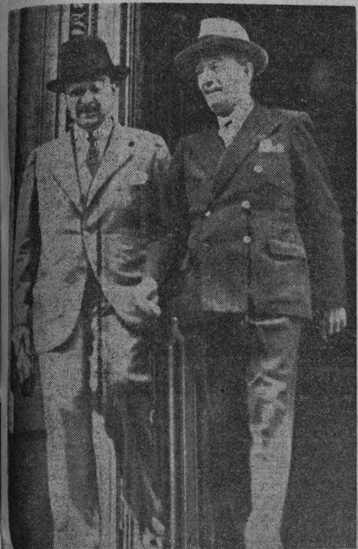
El embajador de España en París, Sr. Lequerica, saliendo del Quai d'Orsay, acompañado del ex ministro francés M. Malvy, después de anunciar la neutralidad española al ministro de Negocios Extranjeros.