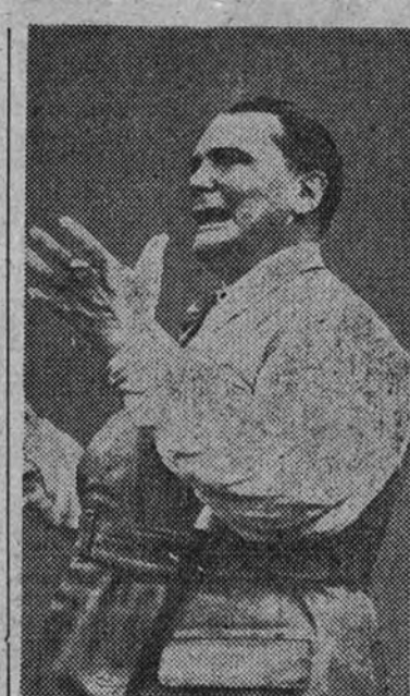
El mariscal Goering.

"De cuando en cuando—continuó diciendo Goering—, los aviadores ingleses vuelan sobre el territorio alemán para lanzar proclamas. Que tengan cuidado con no confundirse con las bombas, pues nuestra revancha no se haría esperar y nuestras fuerzas aéreas