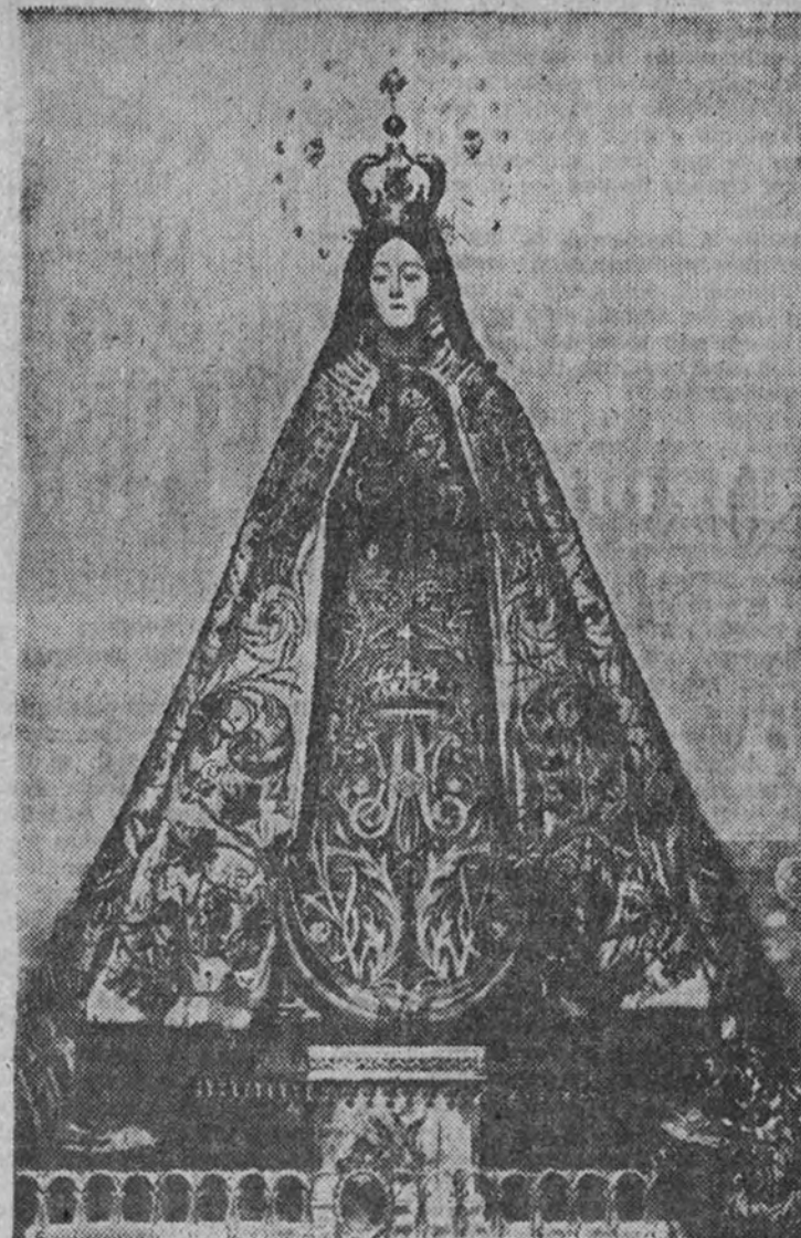
Nuestra Señora de la Consolación, Patrona de Valdepeñas