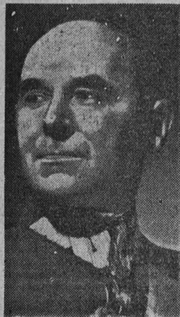
Ultima fotografia del mariscal Smigly-Rydz, jefe supremo de las fuerzas polacas, cuya dimisión se desmiente.