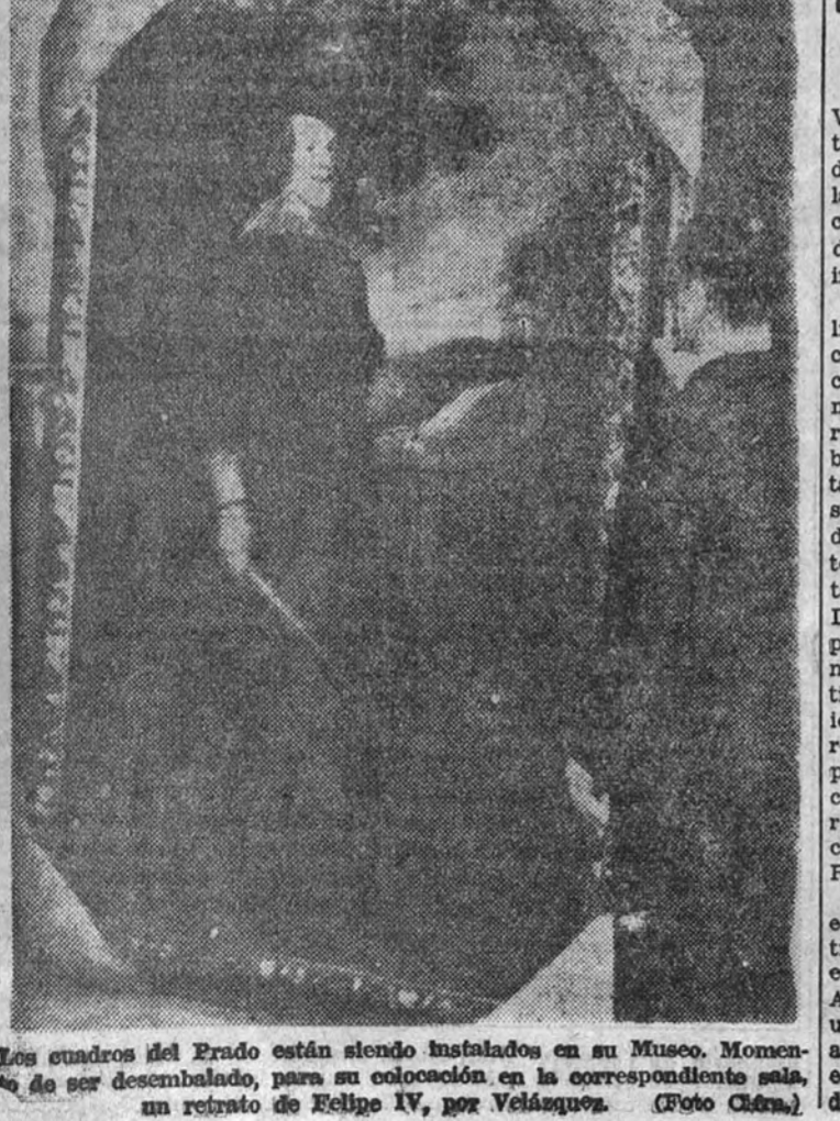
Los cuadros del Erado están siendo instalados en su Museo. Momento de ser desmontado, para su colocación en la correspondiente sala, un retrato de Felipe IV, por Velázquez.