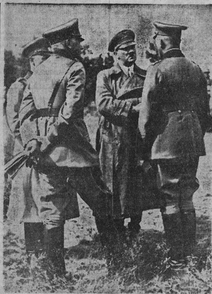
Hitler, durante una de sus visitas al frente de operaciones, conferencia con los generales von Fritsch, Blomberg y Liehman.

Las fuerzas alemanas—que en las últimas jornadas ocuparon la zona señalada de puntos—reducen considerablemente la extensa bolsa de los territorios de Posen y de Lodz y prosiguen su avance hacia el Este de Polonia.