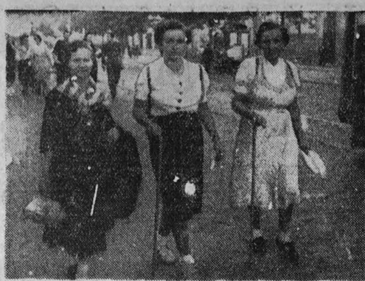
Docientos madrileños salieron ayer a pie con dirección a Zaragoza para cumplir la promesa hecha a la Virgen del Pilar durante la guerra. Los peregrinos emprenden la caminata.