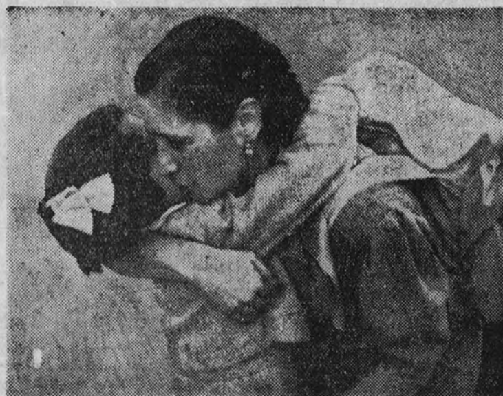
Esta madre se despidió de su hija antes de emprender la peregrinación al Pilar de Zaragoza.