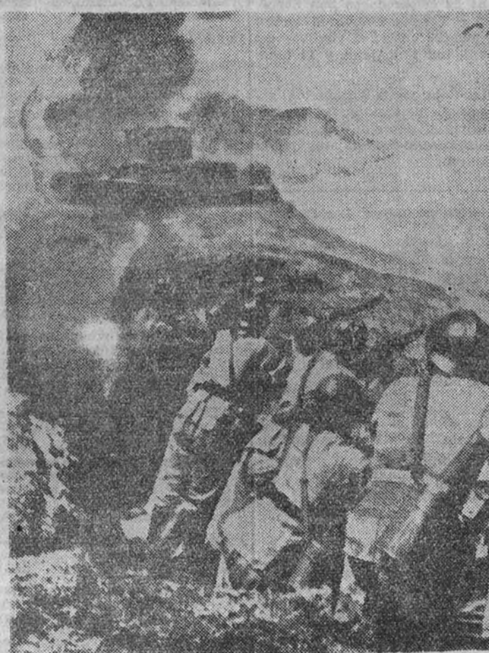
Las fuerzas alemanas procedentes de la Prusia Oriental han encontrado fuerte resistencia por parte de los polacos. La foto muestra el aspecto de una trinchera polaca en la línea defensiva situada al norte de Varsovia.

"Las tropas alemanas han ocupado, en el curso de los últimos días, las ciudades siguientes en las provincias de Posen y Prusia occidental: Posen, Thorn, Gnesen, Hohenstolz y otras muchas. El antiguo territorio alemán de esta región vuelve a estar, casi en su totalidad, en manos de los alemanes." (Efe.)