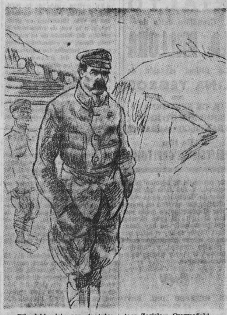
Pilsudski, visto por el pintor polaco Zdzislaw Czerniakowski.

Leímos la noticia del tributo de un gran soldado alemán a la memoria de un gran soldado polaco, Pilsudski, y nos resonó en la memoria el par de versos españoles de un poeta muerto en batalla, "De la gran caballería—de la espada". Días antes se cumplía el cincuentenario de las primeras prisiones del héroe, Pilsudski, en 1888, se condenó a confinamiento en la Siberia oriental porque es cómplice en un atentado contra Alejandro III. Es deportado a Kerimov, sobre el Sena, y luego a Tunka, donde medita el peligro ruso. Teme más que al poderío de las armas y del Imperio a las fuerzas de disolución del alma rusa. Por primera vez hace Pilsudski la frase célebre: "El nihilismo no es una doctrina ni una profesión de fe, sino una indecisión, una vacilación, un no estar en las nubes, en una sociedad que sirva al Estado, que asume las misiones universales. Años después, para dar a este ideal cauce noble, se hace socialista, y opone a los tribunos de la plebe los caudillos de orden proletario."