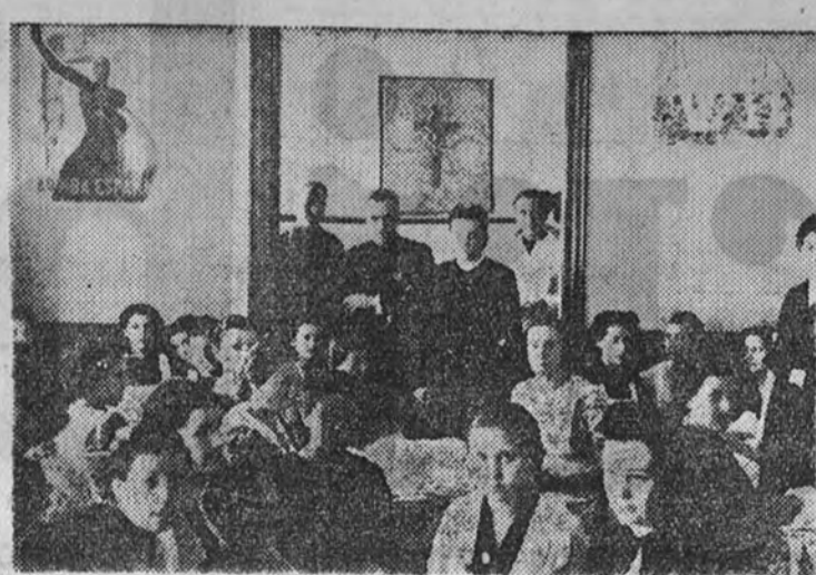
La delegada nacional de Auxilio Social en el acto celebrado ayer.

Se ruega a los citados padres pasen por las oficinas de esta Junta, plaza de las Cortes, 2, para recibir instrucciones.