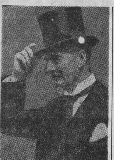
Chamberlain

LONDRES 13 (Cámara de los Comunes).—El Sr. Chamberlain ha hecho su segunda declaración sobre la situación de la guerra: "Creo que es conveniente empezar diciendo—que comience mi informe de esta semana con una referencia de la reunión del Consejo Supremo de Guerra celebrada ayer en territorio francés, y a la que asistieron Chamberlain y yo por Inglaterra y Daladier y Gamelin por Francia. La finalidad de esta reunión ha sido el hacer posible en cualquier momento de la guerra el celebrar un cambio de impresiones directo y personal. La situación actual ha sido ampliamente examinada. La reunión comenzó por la mañana y fué completada con nuevas conversaciones celebradas por la tarde. La Cámara no esperará—añadió Chamberlain—que le dé cuenta detallada de los muchos temas discutidos. Hay, sin embargo, un tema muy importante, al cual puedo referirme. Los pueblos de Francia e Inglaterra están igualmente decididos, no sólo a cumplir sus compromisos de honor con Polonia, sino también a poner fin a una vez al estado intolerable de la vida de las naciones amenazadas perpetuamente por Alemania. Nuestros aliados los franceses son, como nosotros, un pueblo amante de la paz; pero no por eso están menos convencidos que nosotros de que no podrá haber paz hasta que desaparezca la amenaza del hitlerismo.