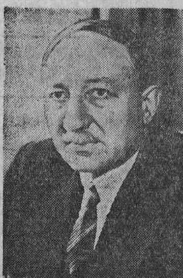
Ivon Delbos, ministro de Educación Nacional en el actual Gobierno francés.