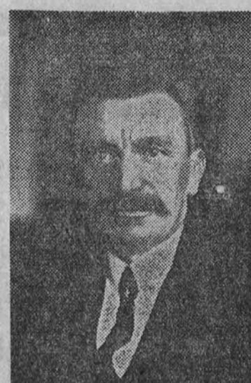
Georges Pernot, ministro de Presupuesto del nuevo Gobierno francés.