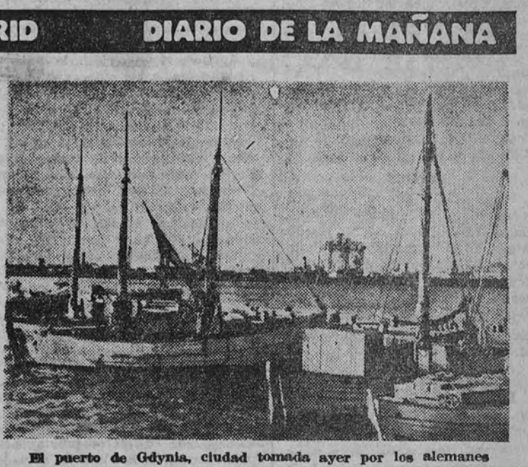
El puerto de Gdynia, ciudad tomada ayer por los alemanes