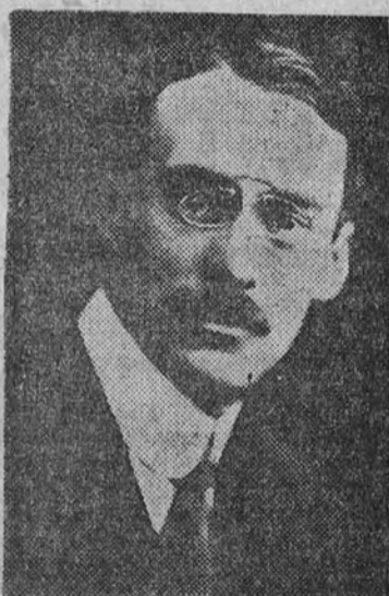
M. Duco, subsecretario francés de Defensa Nacional y Guerra.

El periódico dice que, ante el encuentro trágico del cual puede resultar la catástrofe de la civilización, Italia continúa vigilante y dirigida por un espíritu clarividente. La actividad italiana, debido a la firme decisión del Duce, su visión clara de los acontecimientos es tal, que Italia puede convertirse en el factor de la paz, es decir, que puede determinar y acelerar el proceso para el restablecimiento de las bases sobre las que se construya una nueva Europa fundada en la justicia y renovada en su espíritu que tenga que ser anegado en un baño de sangre. Es posible que Dios haya asignado a Roma un gran destino y una gran misión que cumplir. (Stefani.)