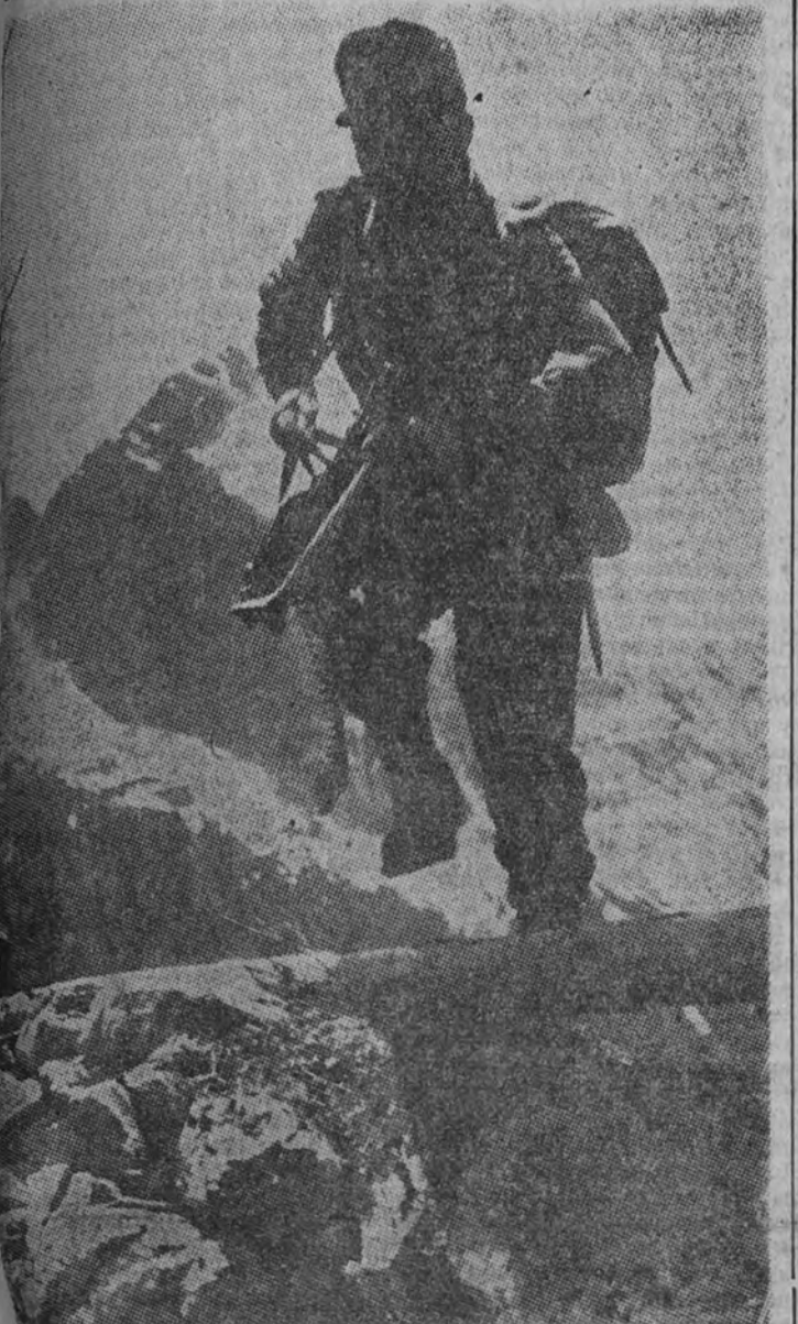
El avance alemán en los Cárpatos se ha puesto a prueba el entusiasmo de la Infantería germana. He aquí un soldado ametrallador, situado en un obstáculo con el arma preparada para entrar en acción.