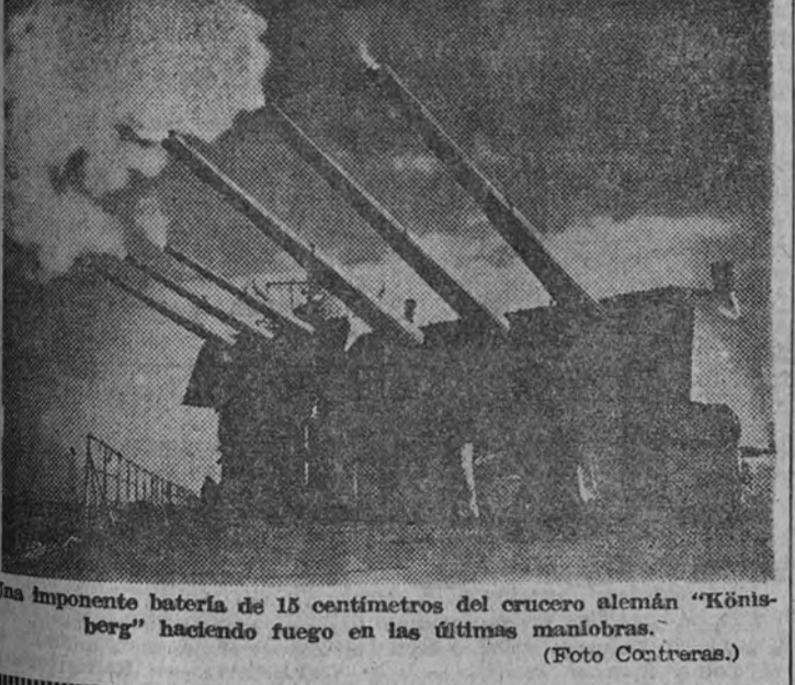
Una imponente batería de 15 centímetros del crucero alemán "Königsberg" haciendo fuego en las últimas maniobras.