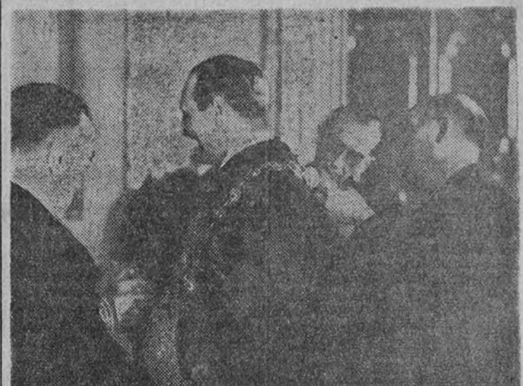
Con toda solemnidad se celebró ayer la apertura de Tribunales. Momento de ser colocado al ministro, D. Esteban Bilbao, el valioso collar de la Justicia, milagrosamente salvado de la horda roja.

El 14 de septiembre de 1921, cuando la embarcación se disponía a hacerse a la mar, un grupo de obreros exaltados cometió en él un acto de sabotaje que causó daños por valor de varios centenares de miles de pesetas.