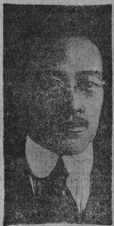
C. T. Wank, ministro de Negocios Extranjeros del Gobierno nacionalista de Nankín, que, según se afirma, se ha negado a recibir una nota del ministro holandés, decano del Cuerpo Diplomático.

El presidente del Comité Sindical del Papel y Cartón ha manifestado, en relación con las declaraciones últimamente publicadas en la Prensa sobre el problema del papel, que, aunque la industria papelera tiene adquiridas materias primas, la situación internacional presente pone dificultades para su transporte marítimo a España, dificultades que el ministerio de Industria se esfuerza en salvar. Entre tanto, una elemental prudencia aconseja imponer restricciones en el consumo del papel, semejantes a las que los demás Estados neutrales han dictado a estas fechas.