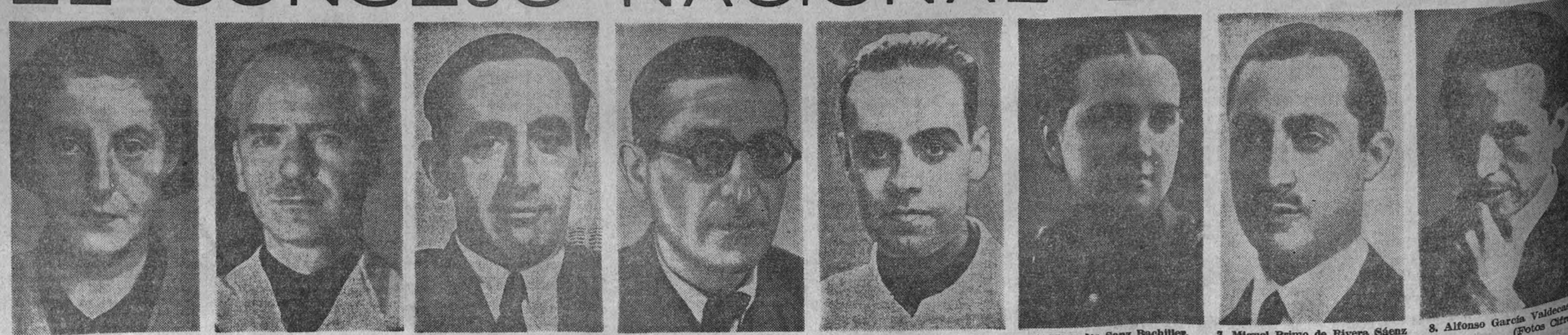
1. Pilar Primo de Rivera y Sáenz de Heredia