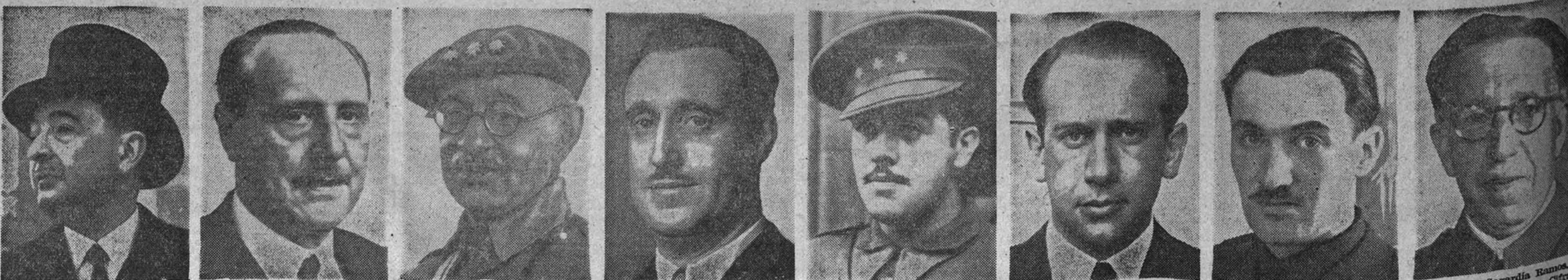
José Félix de Lequerica.