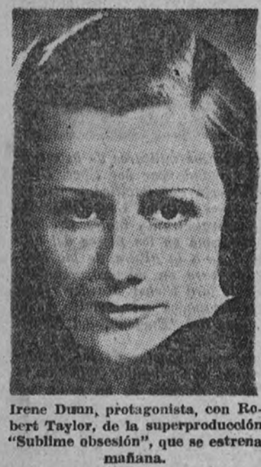
Irene Dunn, protagonista, con Robert Taylor, de la superproducción "Sublime obsesión", que se estrenará mañana.