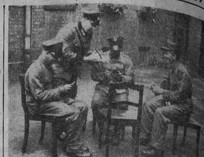
Soldados polacos jugando a las cartas en la frontera de Silésia, en un momento de calma.

RIGA 16.—Comunican de Moscú que el agregado militar soviético en la Embajada de Berlín ha llegado en avión con objeto de conferenciar con urgencia con Stalin, Molotov y Vorochilof. (Stéfani.)