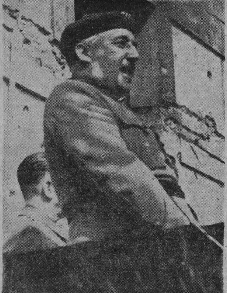
GIJON.—El jefe del Estado pronunciando en el Simancas, un discurso, que fué emocionada evocación al heroísmo de los valientes que allí sucumbieron.

Si eres falangista pon en tus cartas el sello JOSE ANTONIO; pide en tus compras el sello JOSE ANTONIO.