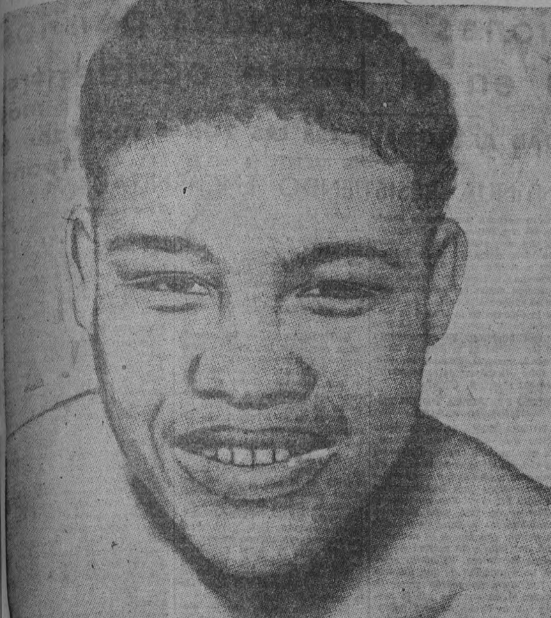
La sonrisa de Joe Louis, el invencible campeón del mundo de todas las categorías.

PORTES económicos. Sale camion nuevo para Santander sábado. Teléfono 53089. (651)