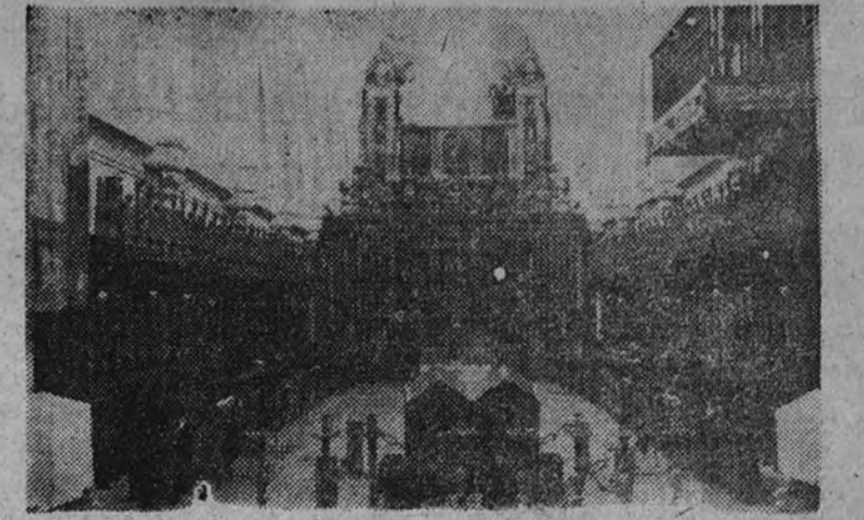
Vista de la capilla del monasterio de las Huelgas, donde se celebrará la misa que precederá al acto del juramento ante el Caudillo del nuevo Consejo Nacional de F. E. T. y de las J. O. N. S.