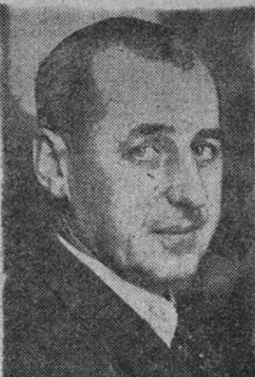
Pedro Muguruza Otaño.