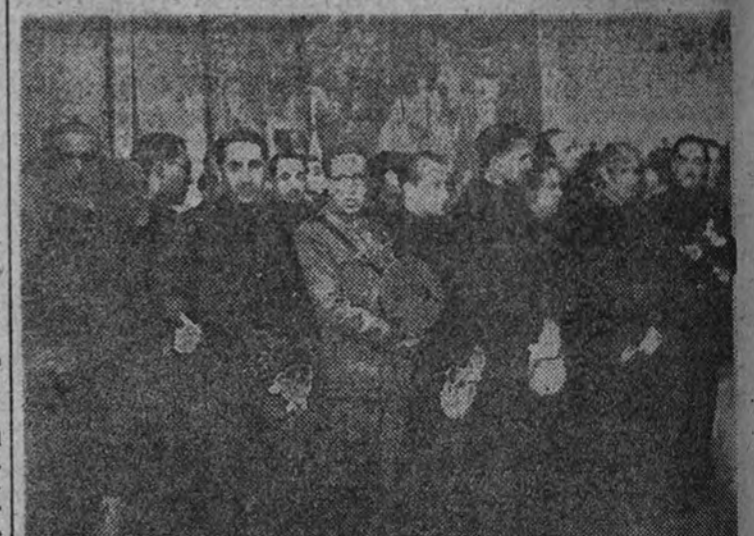
Los consejeros durante el acto de la jura.