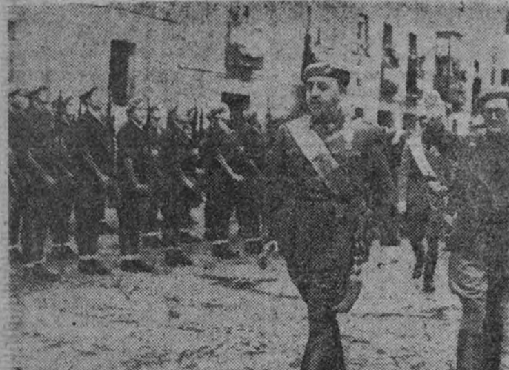
S. E. el Generalísimo pasa revista a la bandera de Falange.