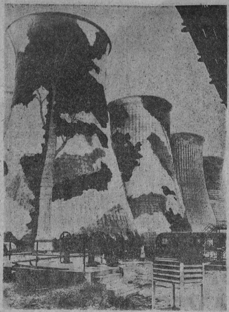
En previsión de los bombardeos aéreos un grupo de generadores eléctricos de una central de Leicester han sido "camuflados" de la curiosa manera que muestra la foto

El mariscal Smigly Rydz, jefe del Ejército polaco, se encuentra en Craiova.