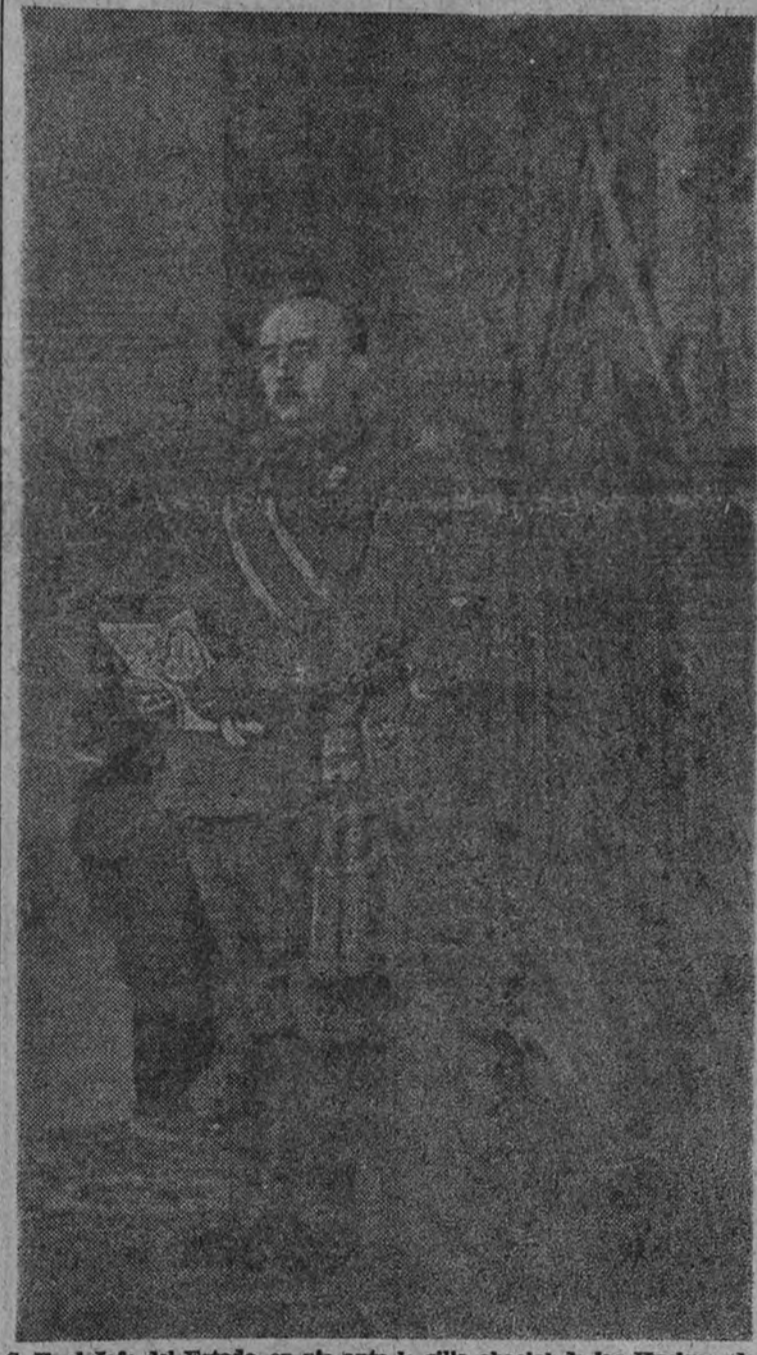
S. E. el Jefe del Estado, en pie ante la silla abacial de las Huelgas, da lectura a su mensaje histórico.

"LAS NECESIDADES DEL PUEBLO PARA MI NO ADMITEN DILACION NI REBAJA POSIBLES"