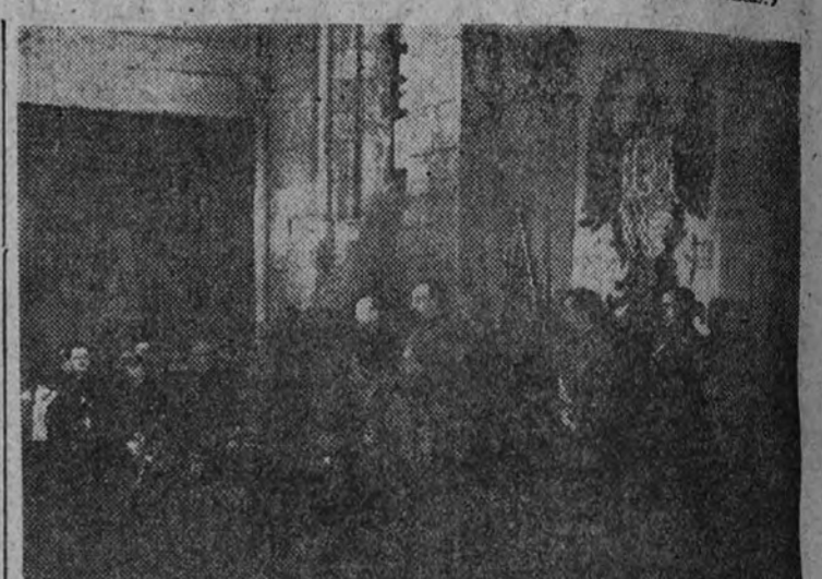
En la Sala Capitul, el Caudillo lee su mensaje al Consejo.

Temperaturas extremas de Madrid.—Máxima, 23; mínima, 15.