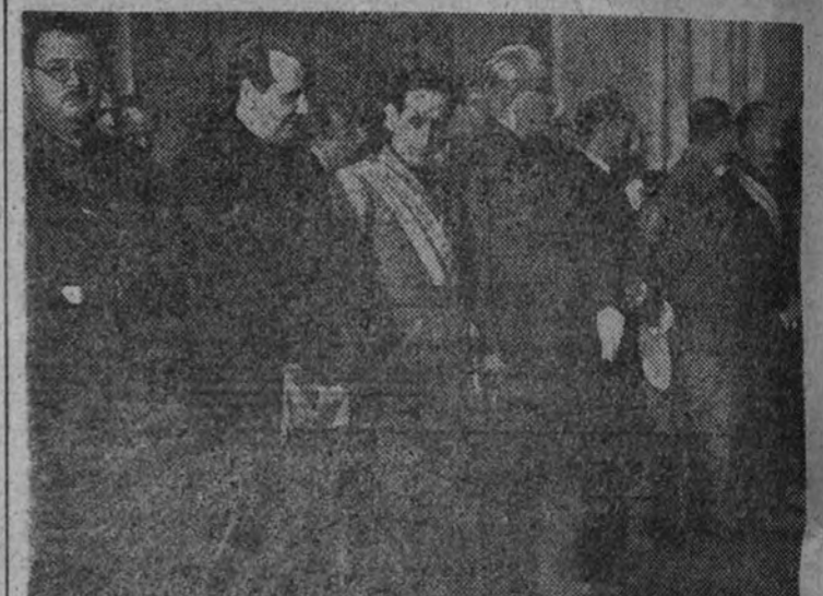
El Gobierno de España en el acto de la jura del Consejo Nacional.