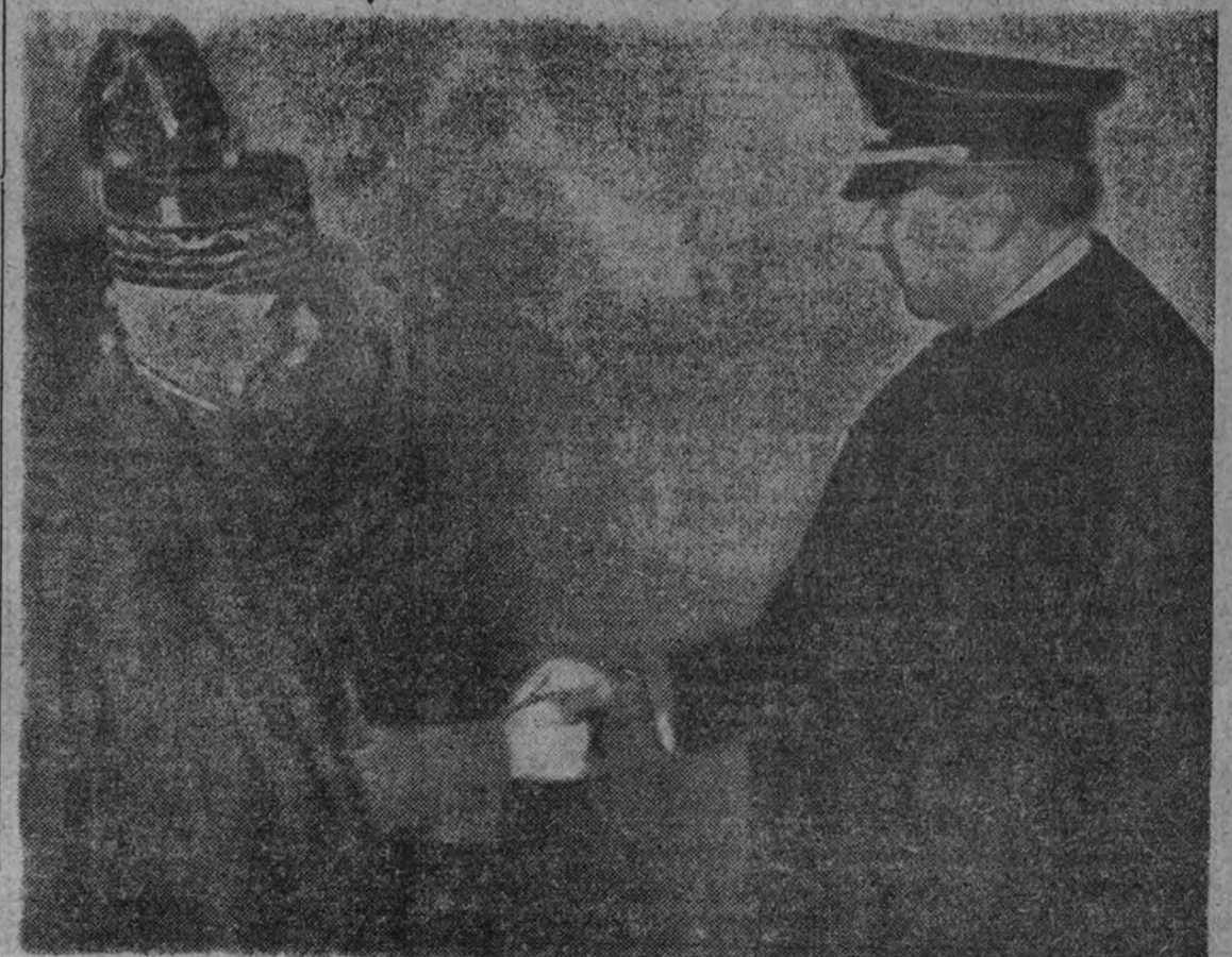
He aquí una curiosa fotografía, única obtenida—por nuestro redactor gráfico Contreras—, del instante en que los embajadores de Alemania y Francia en España se estrechan la mano antes de entrar en el monasterio de las Huelgas.

Von Sthorer y Pétain se estrechan las manos