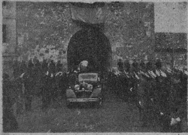
La llegada del Caudillo al monasterio.