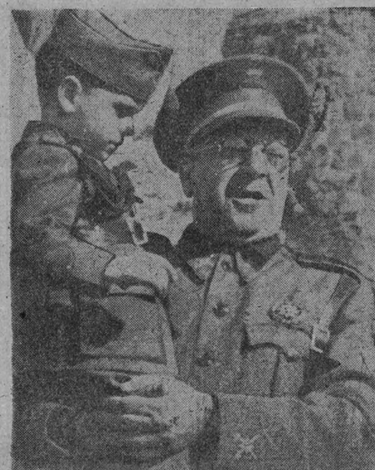
El general Moscardó con el niño Restituto Alcázar, nacido en las asoladas ruinas.

Hasta después de las dos de la madrugada del lunes nadie se movió de aquel apretado anillo que estrangulaba al receptor. Las noticias se sucedieron cada vez más firmes y más detalladas.