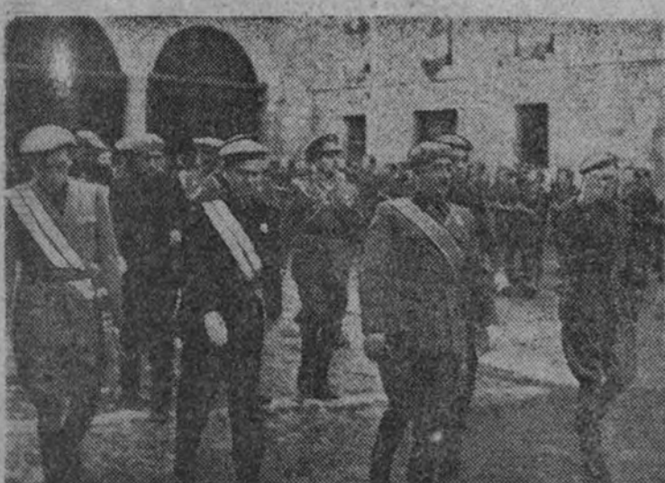
El jefe del Estado, acompañado de los miembros del Gobierno, se dirige al interior del monasterio.