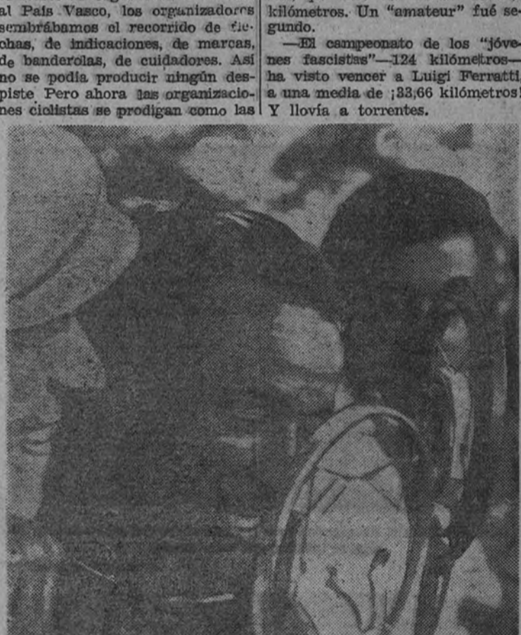
Mariano Cañardo, al terminar vencedor, la XIX Vuelta a Cataluña, se dirige, por el micrófono de Radio Nacional, al público de toda España.

El campeonato de los "jóvenes fascistas"—124 kilómetros—ha visto vencer a Luigi Ferratti, a una media de 38,6 kilómetros! Y lluvia a torrentes.