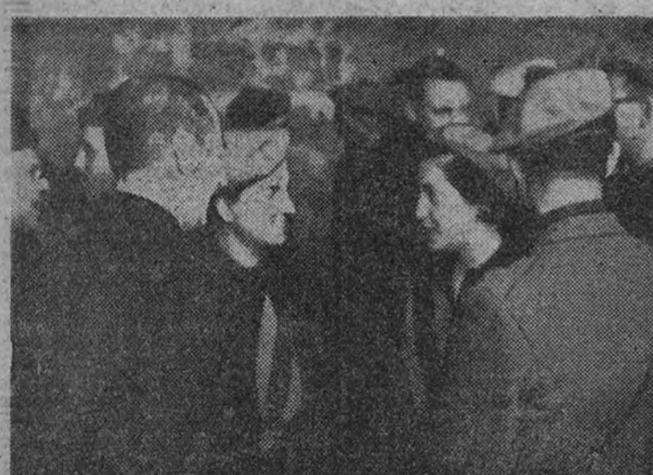
Las camaradas Pilar Primo de Rivera y Mercedes Sanz Bachiller momentos antes de la jura.