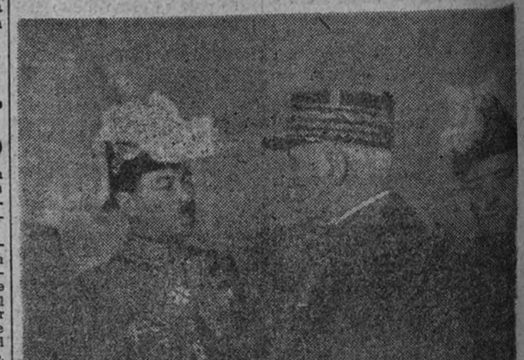
Los embajadores de Francia y de Polonia conversan a la salida del acto.