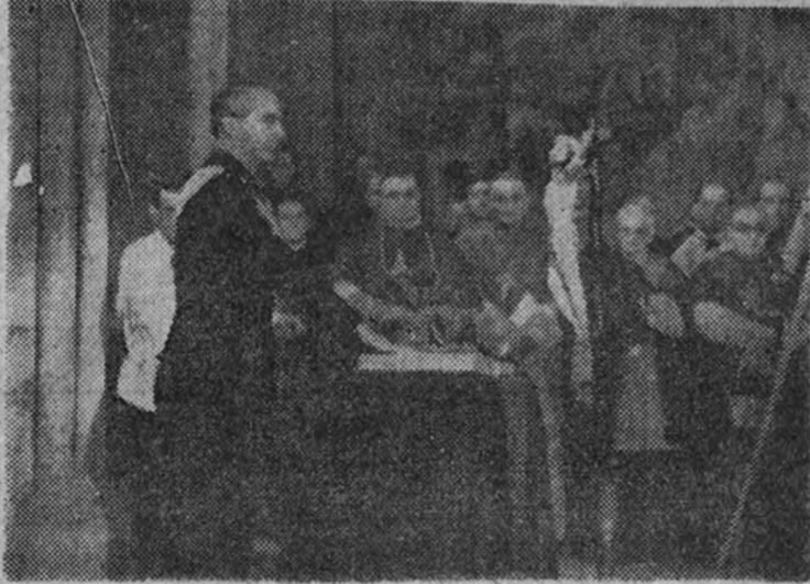
El juramento del presidente de la Junta Política y ministro de la Gobernación, camarada Serrano Suñer.