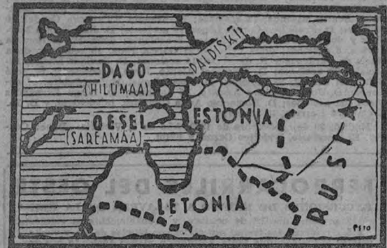
Situación de las tres bases marítimas que Estonia ha concedido a la U. R. S. S. en la costa del Báltico.

El artículo segundo del tratado estipula una ayuda en armamentos que ha de suponerse será prestada en tiempo de paz, permitiendo el aumento de poder del Ejército de Estonia, que se convierte en vanguardia del corazón de Rusia. Mas la substancia del tratado, en parte fundamental y la que reservaba a todos la sorpresa, se encuentra en el artículo tercero, que autoriza a la Unión de Repúblicas Socialistas Soviéticas.