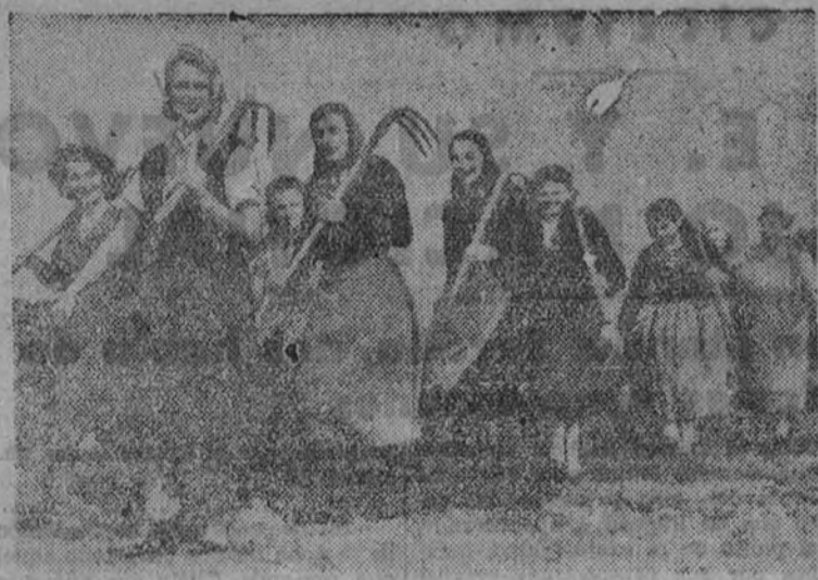
Alemania ha llamado dos quintas de mujeres para las labores campesinas. Mientras los hombres combaten, las mujeres alemanas hacen posible que los campos aseguren la vida y el bienestar de su Patria.