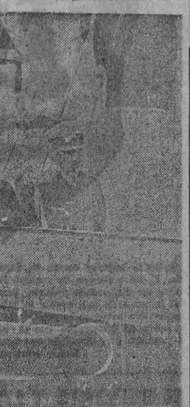
El almirante Raeder, jefe de la flota alemana, examina un cañón cogido a los polacos por las fuerzas de desembarco del "Schleswig-Holstein", que operaron en el puerto de Gdynia.

El mariscal Goering ha felicitado a la aviación en el momento en que ha terminado por completo su misión en Polonia y cuando se dispone a concentrar su actividad exclusivamente en el frente occidental.