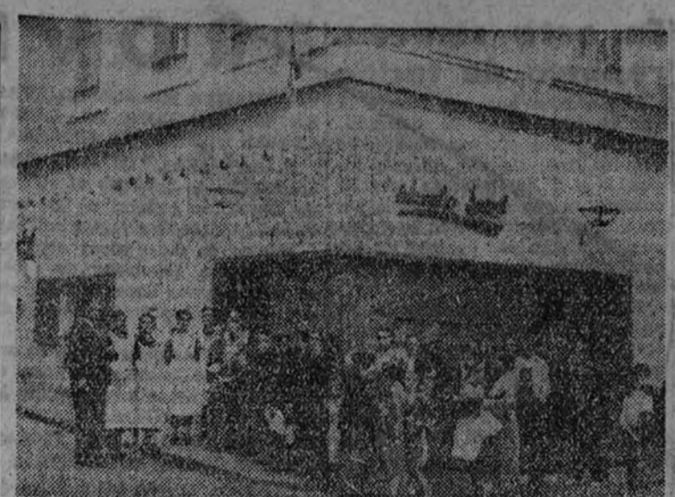
La nueva cocina de hermandad que Auxilio Social ha inaugurado en la calle de Mariana Pineda.