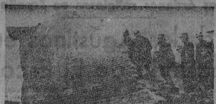
A consecuencia de las lluvias se hundió un paredón en la calle de María de Guzmán, quedando expuestas varias personas. Los bomberos realizan trabajos de desmonte.

Madrid: la "ficha azul" llama a tu conciencia de español pidiéndote que la suscribas con humana emoción.