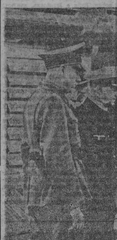
El almirante Raeder, jefe de la flota alemana, examina un cañón cogido a los polacos por las fuerzas de desembarco del "Schleswig-Holstein", que operaron en el puerto de Gdynia.

Los periódicos de esta noche hablan por primera vez de esta defensa y describen extensamente los detalles técnicos y sus efectos, que consideran de una seguridad casi absoluta contra los ataques aéreos. Los globos se encuentran a una altura de 10.000 metros. (Efe.)