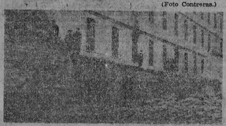
Estado en que quedó el paredón hundido de la calle de María de Guzmán.