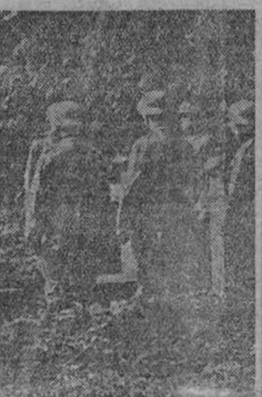
El almirante Raeder, jefe de la flota alemana, examina un cañón cogido a los polacos por las fuerzas de desembarco del "Schleswig-Holstein", que operaron en el puerto de Gdynia.

BERLIN 29. (De la redacción de la agencia Efe en Berlín.)