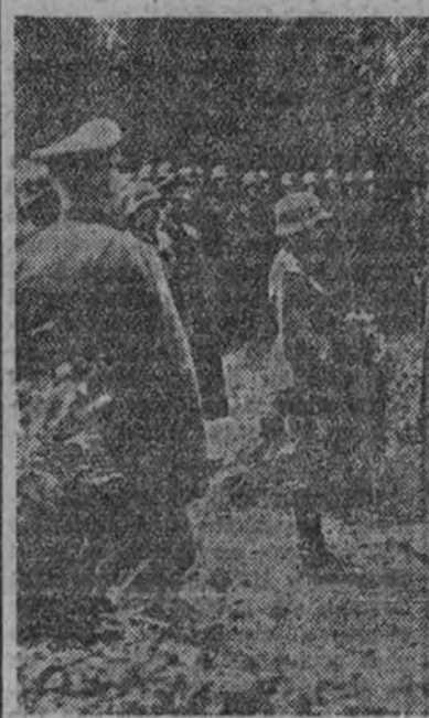
Los soldados alemanes rinden el postor homenaje a dos aviadores franceses, caídos gloriosamente en combate sobre el territorio del Reich. Los manos enemigas que momentos antes hacían funcionar las ametralladoras, cubren de flores, en un emotivo y leal adiós, los féretros de los aviadores franceses.

BRUSELAS 30. (Servicio especial Transocean.) — Se ha terminado de establecer la barrera de globos contra ataques aéreos en la capital francesa, de acuerdo con el modelo copiado de Londres.