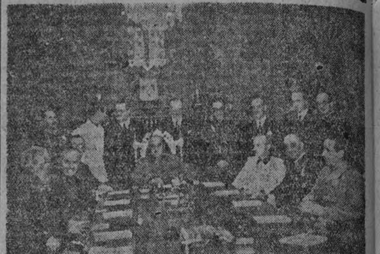
El Caudillo con su segundo Gobierno, en el momento de su constitución.