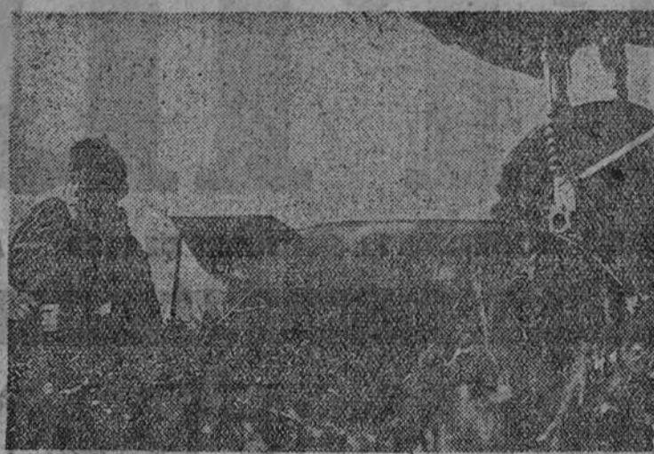
Un piloto alemán espera junto a su aparato de gran bombardeo la orden de emprender el vuelo hacia las líneas polacas

Hay esperanza de que la mediación, por ejemplo, de Mussolini obtenga algún resultado. (Efe.)