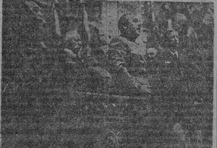
El Caudillo, rodeado de los generales de sus Ejércitos, dirige la palabra en una fiesta íntima en el palacio central del Banco de España, en Madrid.