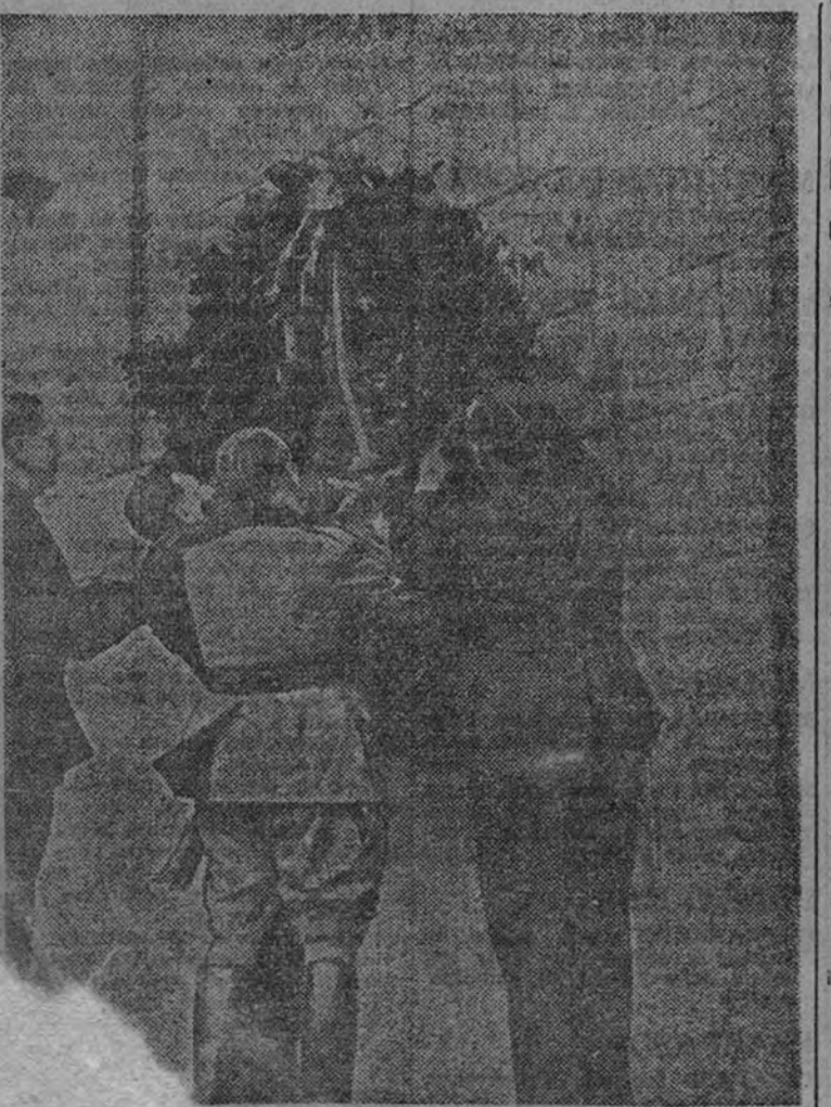
El Caudillo, deposita una corona de flores en la tumba de José Antonio, fundador de la Falange.