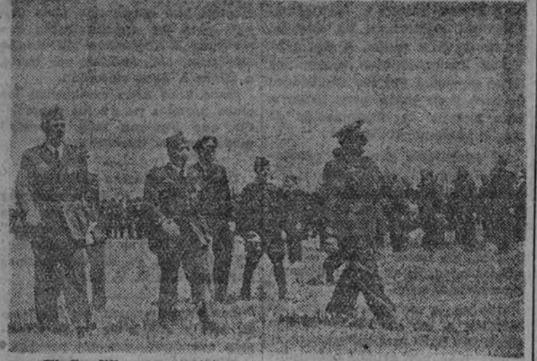
El Caudillo pasa revista a las fuerzas españolas del Aire.