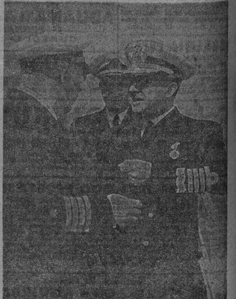
El Caudillo, Capitán General de la Armada, a bordo del "Canarias".