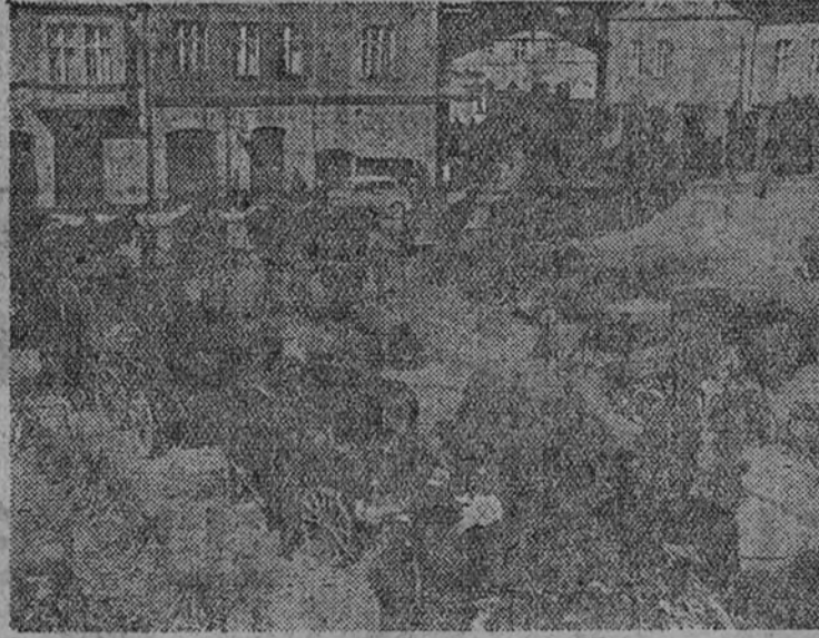
Una columna alemana, durante el avance hacia Varsovia, vivaquea en la plaza de Radom, momentos después de ser ocupada la ciudad por el Ejército del Reich