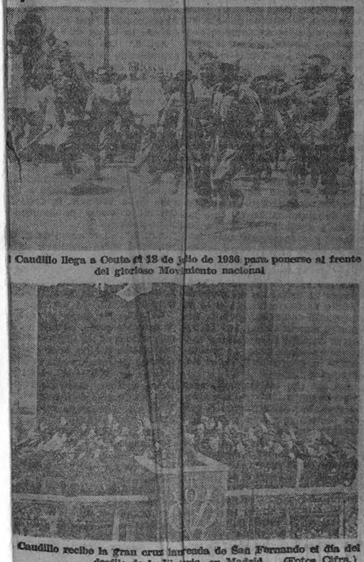
Caudillo llega a Cádiz el 18 de julio de 1936 para ponerse al frente del glorioso Movimiento nacional

Franco, en el primer día de la guerra y en la coronación de la victoria