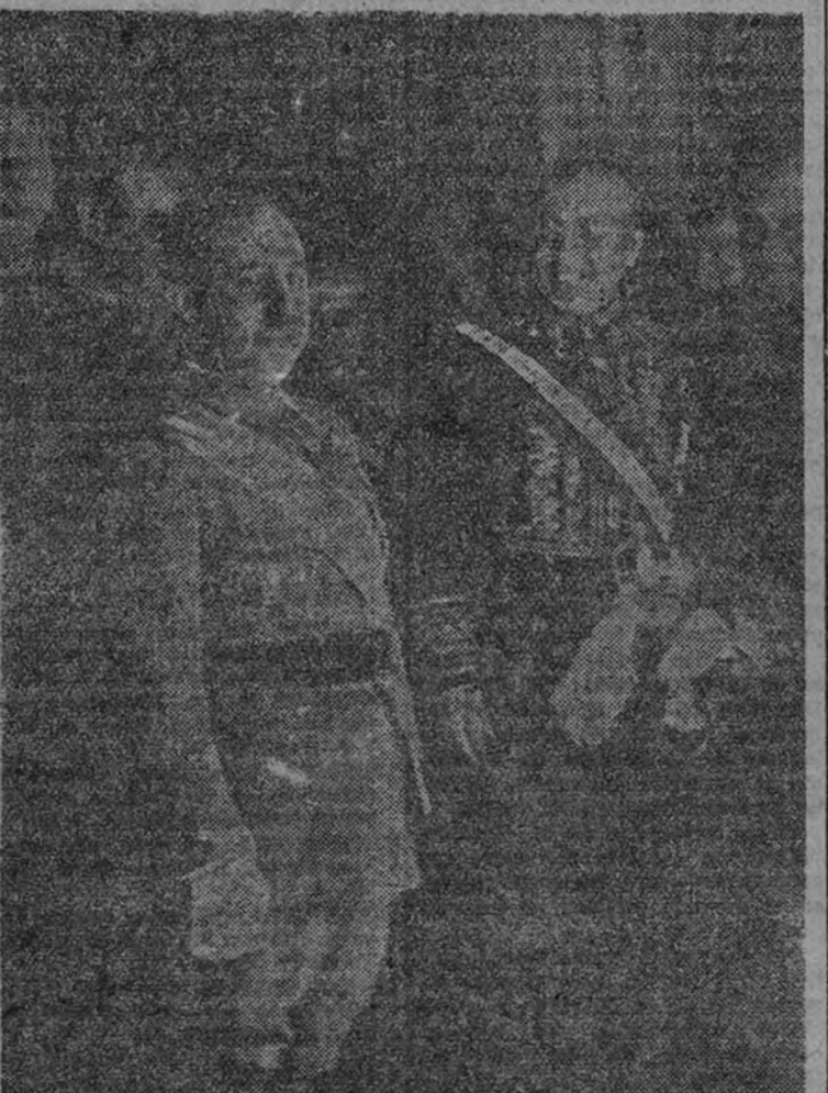
El Caudillo en la primera presentación de credenciales del embajador de A. M. el Rey Emperador de Italia, conde Cautani.

Ejército y del Consejo Supremo de Justicia Militar, altos centros que han de irradiar, cada uno en sus peculiares esferas de acción, sobre la colectividad armada, la decisiva influencia de sus ejemplares orientaciones. EL REINGRESO EN LA ESCALA ACTIVA