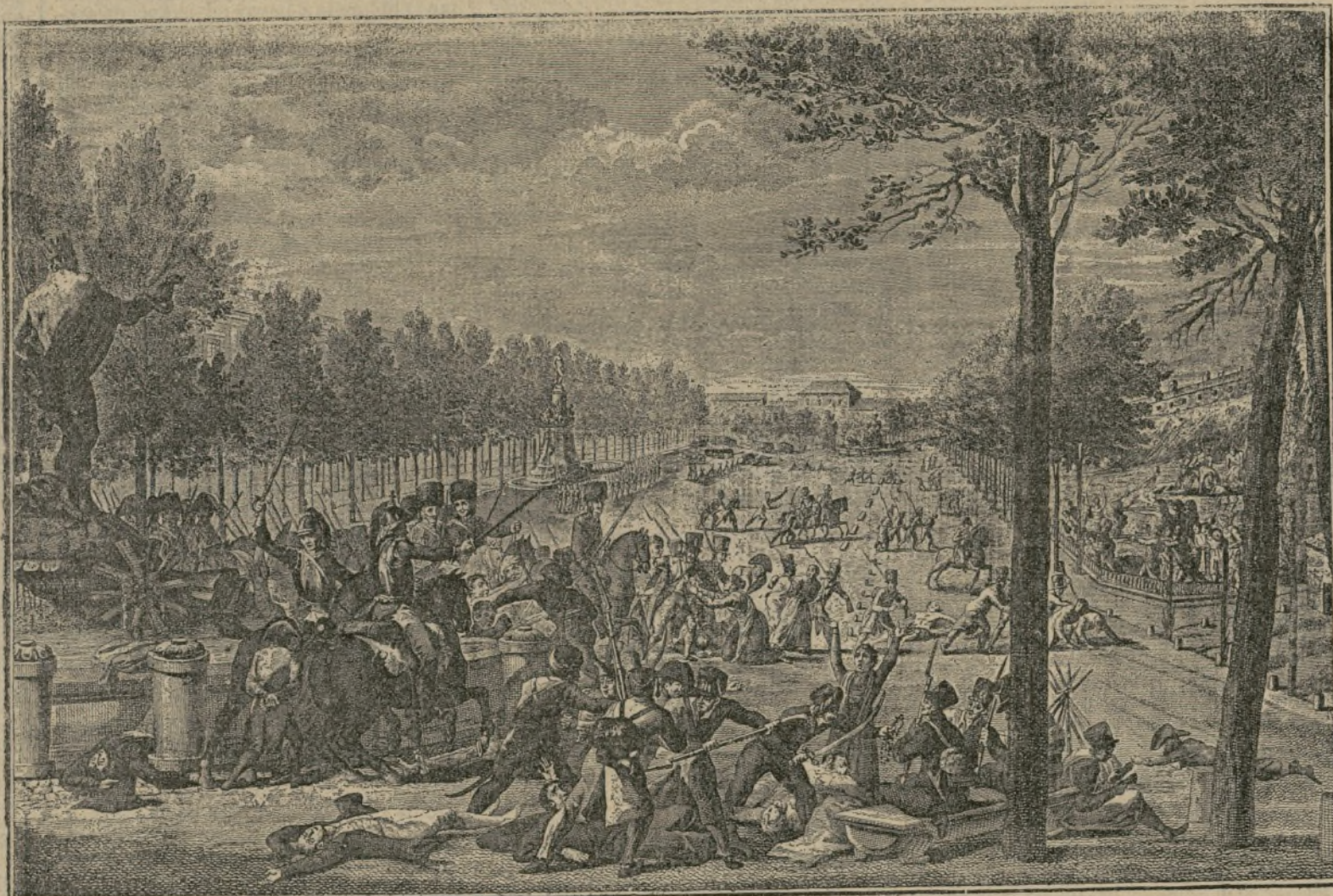
DIA DOS DE MAYO DE 1808 EN MADRID.

Asesinan los franceses a los patriotas en el Prádo.