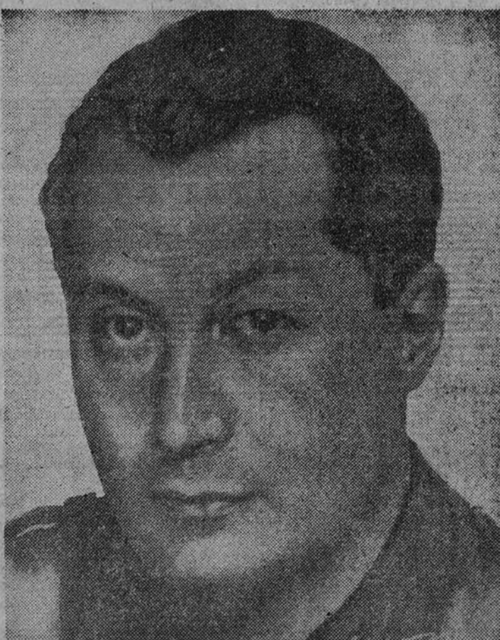
Por la Patria, el Pan y la Justicia están allí, junto al Maestro. Por la Patria, el Pan y la Justicia, aquí, en esta España medio deshecha, otras innumerables escuadras se aprietan en nutridas formaciones, tras el Caudillo, dispuestas a seguir el camino de aquellas si así fuese necesario para ganar las batallas de la Paz. La Paz que habrá de afianzarse con la Revolución española, que nuestro Jefe Franco jura llevar hasta sus últimas consecuencias. Las que soñó José Antonio para una España Imperial.

Habló a continuación el ministro. Dijo que hoy es un día de fiesta en Amposta. Y muy señalada, por ser del progreso y del renacimiento de España. Se refirió con elogio a la rapidez con que ha sido reconstruido el puente, y aludió a los planes generales de reconstrucción nacional, y especialmente a los proyectos de carreteras, transportes y obras hidráulicas, con un programa muy extenso. Dedicó frases laudatorias a las hazañas de nuestro glorioso Ejército nacional. "Los proyectos del ministerio de Obras Públicas—dijo—no son palabras vanas, como se hacía en tiempos del politiquismo. Son obras meditadas, que se van realizando paulatinamente, muchas de las cuales ya se hicieron durante la guerra, siguiendo los deseos del