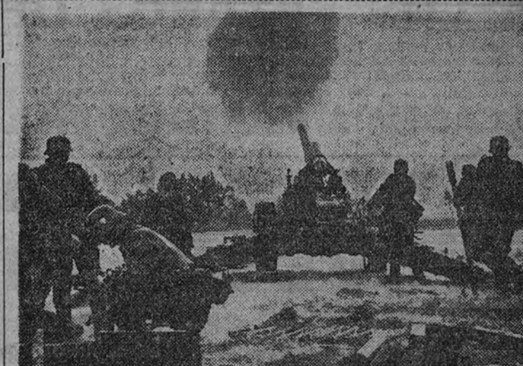
Pieza alemana de artillería pesada disparando sobre las fuerzas polacas.

Franco ha levantado el prestigio del crédito. Lo dice la Bolsa. Franco tiene la confianza de la economía nacional. Lo dice la última suscripción de Deuda. Tened seguridad en el Caudillo, y no exijáis el reembolso de los Tesoros anteriores al Movimiento