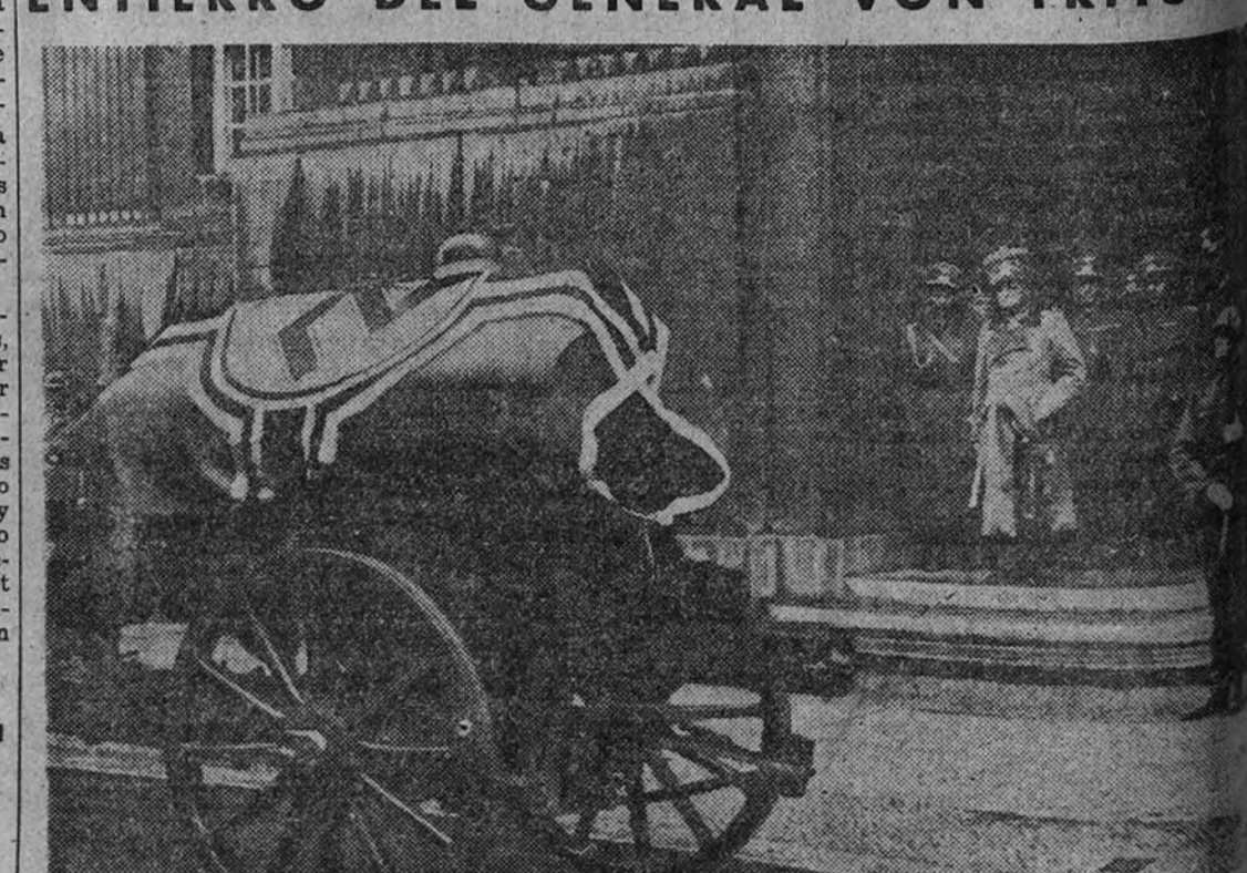
El glorioso veterano de tantas batallas marciales von Mackensen rinde el postrer homenaje al arma muerta en el puesto de honor.