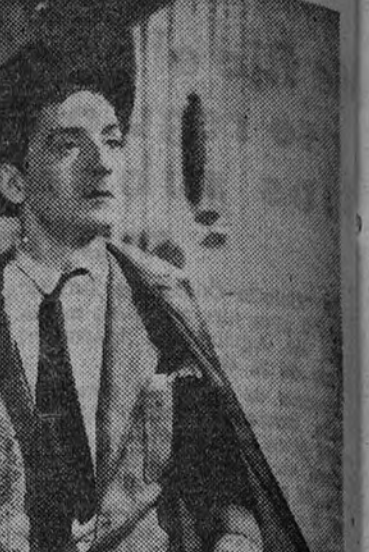
Los principales intérpretes del gran film "Mariquilla Terremoto", Estrellita Castro y Manolo Vico, en un momento de dicha película.

La actriz cinematográfica alemana Lotl Dagover en "Mama se casa".