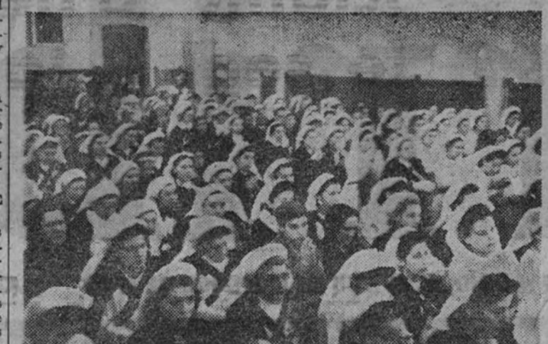
Con motivo de la fiesta onomástica del Caudillo las damas enfermeras asistieron ayer a una misa de comunión en la iglesia de la Inmaculada. El templo ofrecía el aspecto que muestra el grabado.