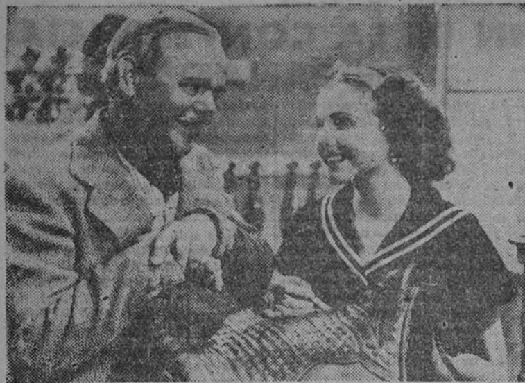
Diana Durbin, la nueva y admirable estrella de la pantalla mundial, en la comedia "Tres diablillos", cuyo estreno se anuncia para fecha próxima.