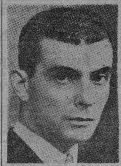
El nuevo embajador de Italia en Londres, Giuseppe Bastianini, subsecretario hasta ahora del ministerio de Relaciones Exteriores.

Anteriormente habían llegado el general Orgaz y el obispo de Tortosa.