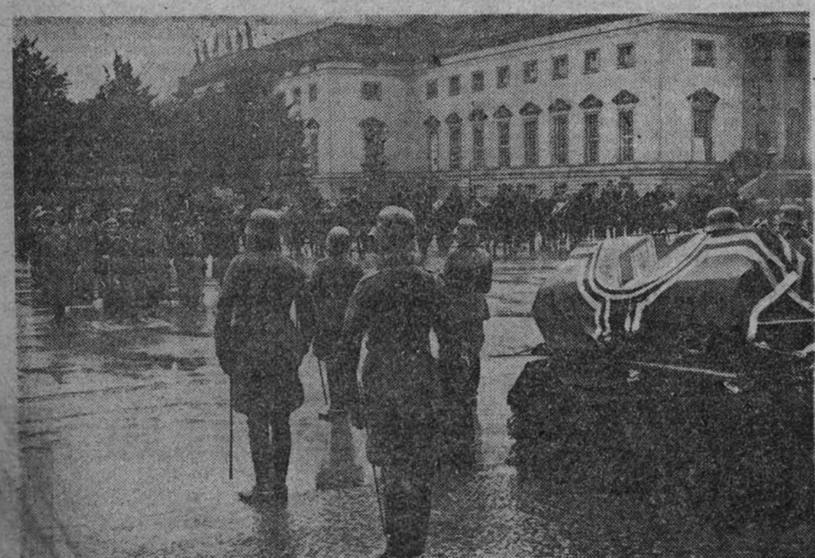
Los restos mortales del general von Fritsch, muerto frente al enemigo, han recibido el homenaje nacional del Reich. En la foto, Goering, von Brauchitsch y el almirante Raeder ante el féretro, que aparece envuelto en la bandera nacional y rodeado de una guardia de oficiales.