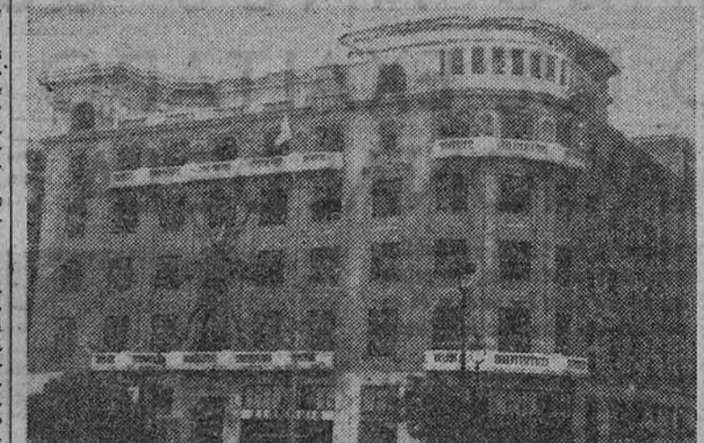
Desde ayer, la Secretaría General del Movimiento tiene su domicilio en Madrid, en la calle de Alcalá, número 42, en el magnífico edificio que muestra la foto.