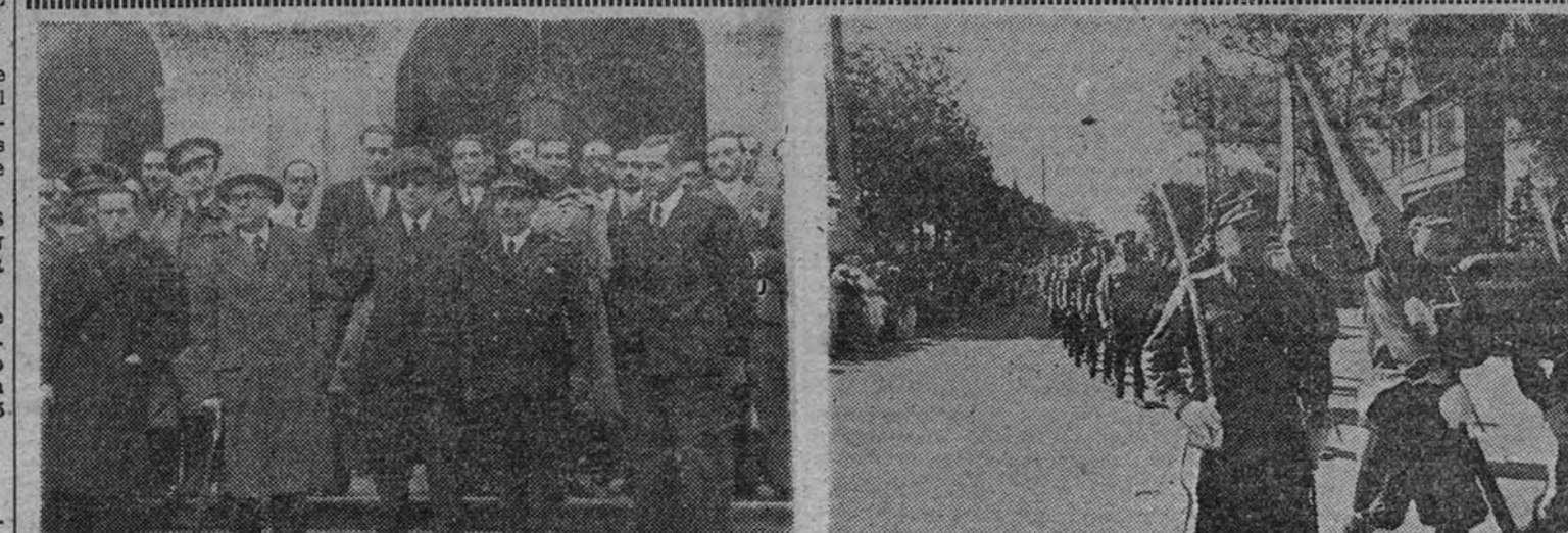
En la Iglesia de Santa Bárbara se celebraron ayer solemnes funerales por los profesores y alumnos de la Escuela Superior de Arquitectura. La presidencia y un grupo de concurrentes al salir de la Iglesia.

ROMA 4.—La Prensa destaca hoy las crónicas de sus correspondientes en París sobre el actual momento. El "Messaggero" dice que en París se han dado perfecta cuenta de la importancia de la visita del conde Ciano a Berlín en momento más difícil de la guerra. Se declara francamente que fuerte y absolutamente necesario se encuentra en una postura para iniciar una acción sobre el actual conflicto.