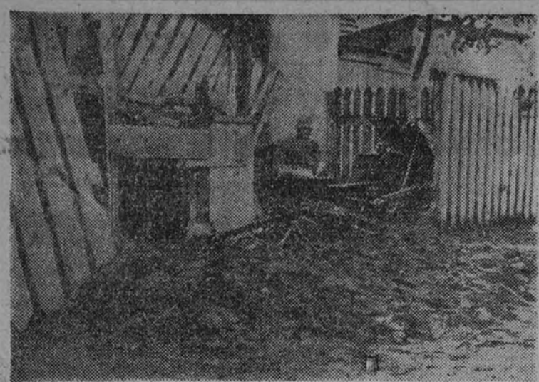
VARSOVIA.—Nido de ametralladoras y un cañón antitanque alemán apostados en una casa de las afueras del barrio de Praga en la capital polaca.