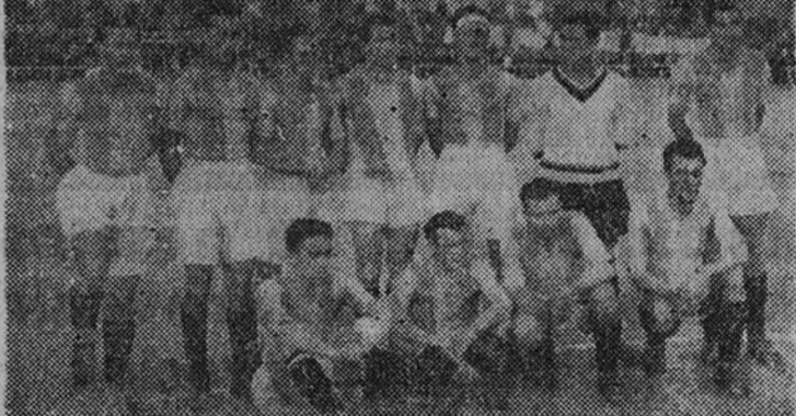
El equipo de Valladolid, que ayer hizo frente a la Ferroviaria un excelente partido.

Los ocupantes de los coches y autos que sigan la carrera no podrán prestar ningún auxilio a los corredores no estando el vehículo y el conductor parados.