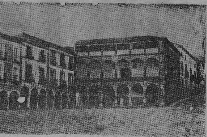
SIGÜENZA.—La plaza Mayor.

Dios ha querido que el tercer aniversario de la liberación de Sigüenza se cumpla ya bajo la gozosa paz de toda la Patria. La suerte imborrable de haber podido entrar con una de nuestras centurias navarras en la vieja ciudad, tan densa de los recuerdos y de las ilusiones de José Antonio, me lleva a contar aquellas horas, que nunca podrá llevarse el tiempo, en que los primeros hombres de la Falange rescataron para España la estirpe religiosa y guerrera de la vieja ciudad.