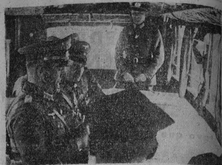
Uno de los momentos más importantes de la guerra que ha terminado sobre Polonia es éste, en que el general Blaskowitz, en su puesto de mando establecido a ocho kilómetros de Varsovia, impone las condiciones para la capitulación de la capital polaca. (Foto Contreras.)

TOKIO 7.—Las tropas japonesas emprendieron ayer un ataque decisivo en la provincia de Kiang, obligadas a abandonar sus posiciones en las montañas de Tehi-U-Ling. Otros destacamentos conquistaron las ciudades fortificadas de Bluschi y Kijina y cercaron a los chinos en el valle de Suis Chue. En el curso de esas luchas diez divisiones chinas sufrieron pérdidas de consideración y se vieron obligadas a abandonar sus posiciones. La cifra de muertos chinos es, aproximadamente, 689. Los japoneses, además, 1.019 prisioneros. (Efe.)