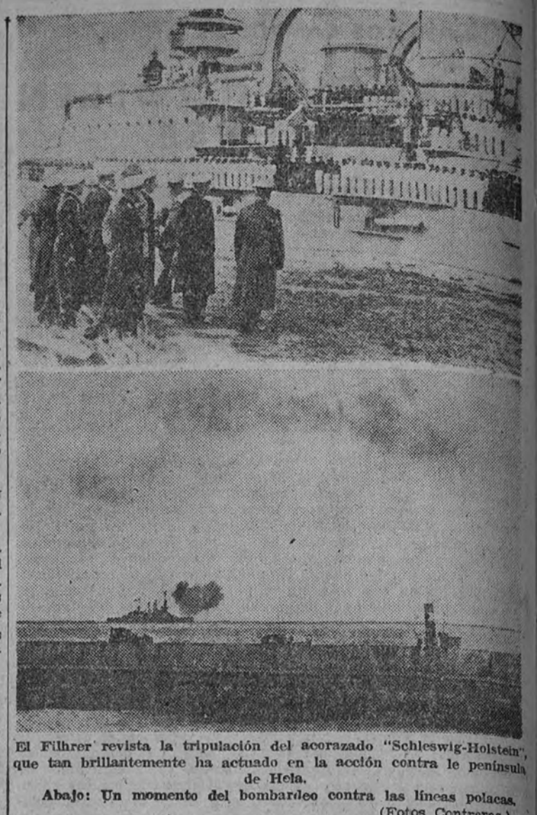
El Führer revisita la tripulación del acorazado "Schleswig-Holstein", que tan brillantemente ha actuado en la acción contra la península de Hela.

Se espera conocer el texto completo, sin que se pueda anticipar una impresión definitiva hasta ese momento. Únicamente se puede decir que los círculos políticos aprecian, en cuanto a la exigencia expuesta por Daladier de seguridad para Francia, así como a las garantías precisas, que estas ideas no contrastan con las palabras del Führer en su último discurso ante el Reichstag. (Efe.)