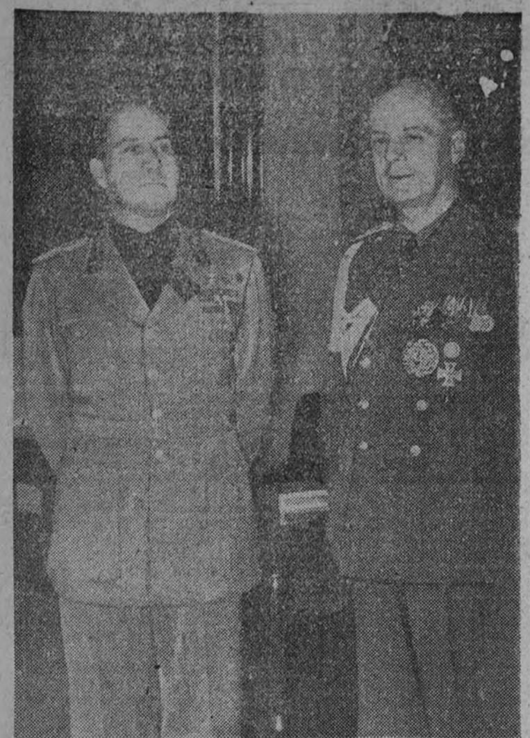
Italia, en la persona del conde Ciano, ha sido informada detalladamente de las recientes conversaciones de Moscú y del llamamiento a la paz que ha lanzado Hitler ante el Reichstag. Fotografía de los dos ministros de Negocios Extranjeros obtenida en la reciente visita de Ciano a Berlín.