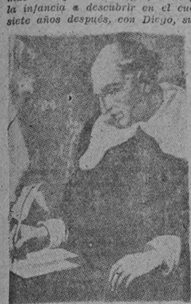
Fray Bartolomé de las Casas

Hemos amado siempre en Fernando Colón, hijo del Almirante, más aún que el bibliófilo, el viajero que va con su progenitor en la infancia a descubrir en el cuarto viaje la costa de Veragua y siete años después, con Diego, su hermano, nuevamente, a las Indias, y con el Emperador Carlos V, más tarde, a Italia, a Flandes y a Alemania, y al fin, consigo mismo, como Adriano, a ver más tierra en tres continentes. Del viajero, con todo, no hablamos hoy; del bibliófilo, tampoco. El historiador de su padre es el que, ocasionalmente, nos entregará un momento. Porque en 1939 se rompen aún lanzas en pro y en contra de la autenticidad de los cuatro libros de Fernando Colón sobre la vida y los descubrimientos de su padre. En esto tornó el juez de campo recusa más de una vez golpes prohibidos, pero los contendientes tornan a la carga.