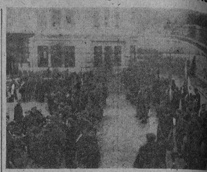
Continúan llegando trenes a Madrid con las representaciones de las Organizaciones Juveniles que tomarán parte en la Demostración Nacional del día 29.

Más tarde se celebró una misa solemne en la catedral. El templo catedralicio estaba totalmente lleno de público. La misa fue oficiada por el arcipreste, doctor Cuesta, asistido por los doctores Ortiz y Trubiano. Durante la ceremonia cantaron los coros de la