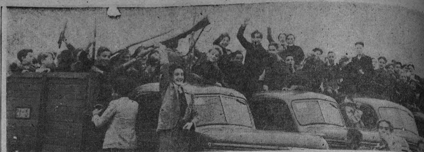
Momento de la llegada a Madrid de una expedición de O. J. que tomará parte en la Demostración Nacional del día 29.

Se le aplicó una nueva terapia en la herida, y debido a esto y a su estado de fiebre, se decidió por los facultativos no autorizar su proyectado traslado a Sevilla. El proceso de la curación es, no obstante, normal. Y deseamos se acelere.