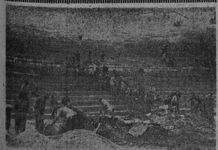
Aspectos del Stadium Metropolitano mientras se verifican los trabajos de ampliación del campo para la II Demostración Nacional de las Organizaciones Juveniles que se verificará el 29 del actual.

Por falta de espacio aplazamos para mañana el tercer reportaje de la serie "ESPAÑA UNA", PRIMER FRENTE NACIONAL EN LA ZONA ROJA, por nuestro camarada JULIO FUERTES.