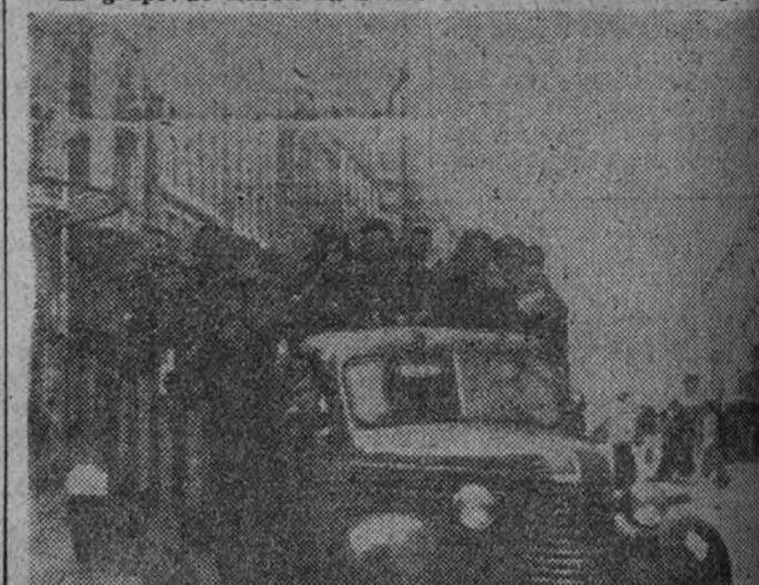
Las calles de Madrid aparecen animadísimas durante estos días. Constantemente desfilan camiones ocupados por los muchachos que llegan a Madrid procedentes de todos los puntos de España.