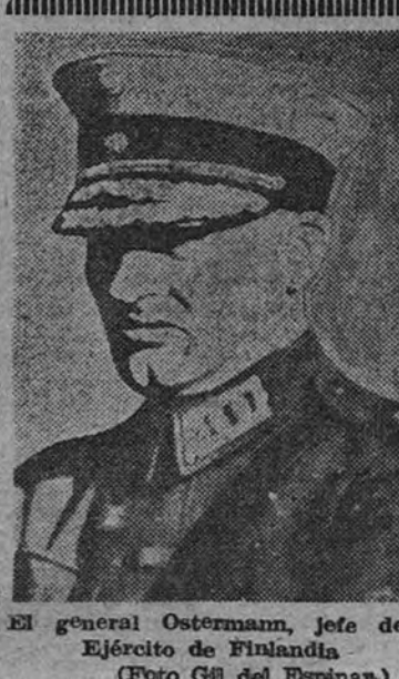
El general Ostermann, jefe del Ejército de Finlandia.

PARIS 17.—El jueves por la mañana se reunirá el Consejo de ministros en el Eliseo. (Efe.)