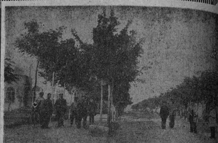
Tomelloso, paseo de la Estación