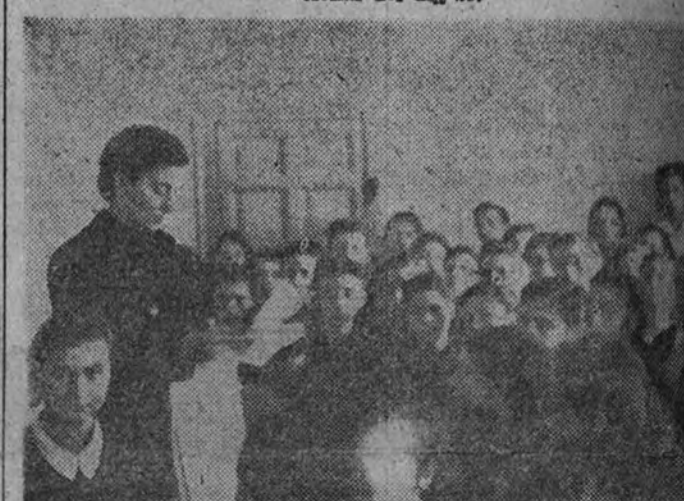
El grupo de Barcelona recibe instrucciones de su regimiento.