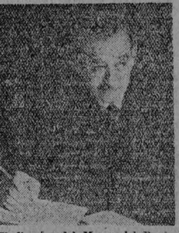
El director del Museo del Prado, D. Fernando Alvarez de Sotomayor, en su despacho oficial.

—Allí permanecí retenido por las funciones de mi cargo. Me nombraron alcalde, y, aparte de esto, como fundador en aquella capital de la "Asociación de mu- jeres al servicio de España", in- tegrada por diez mil afiliadas, tu- ve que conllevar las actividades