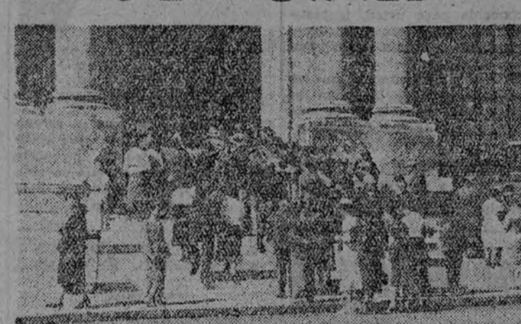
El público entrando en la Exposición de nuestras obras del Museo del Prado, celebrada recientemente en Ginebra.

—No se ha ocupado la Prensa debidamente — dice — del inmenso éxito de ese acto sin precedentes en el mundo. La exposición se re-