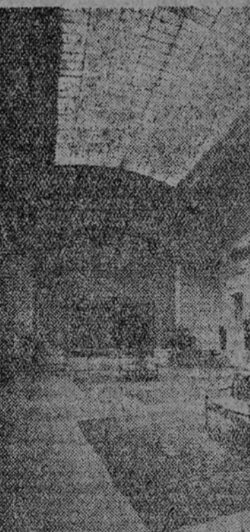
Una de las salas de la exposición de nuestras obras del Museo del Prado, celebrada en el Museo de Arte e Historia de la capital de Suiza.

pass a habiarnos después de lo concerniente al Museo, de su via- je a Ginebra, delegado por el Go- bierno de Franco, inmediatamente después de la liberación de Ma- drid, para hacerse cargo del tesoro artístico de España — del pic- torico, naturalmente —, asesorado por el entonces ministro marqués de Aygüenza, el cual, accidental- mente, habíase hecho cargo del ingente tesoro allí depositado.