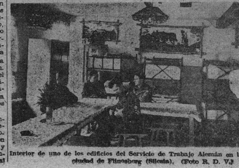
Interior de uno de los edificios del Servicio de Trabajo Alemán en la ciudad de Pilsen (Bohemia).

EL CAIRO 2.—El primer ministro egipcio ha declarado que su Gobierno participa activamente desde hace dos meses en negociaciones con el Gobierno británico para inducirle a reconocer los derechos árabes en Palestina. Egipto ha pedido que veinte mil árabes, que están en campos de concentración, sean puestos en libertad. (Efe.)