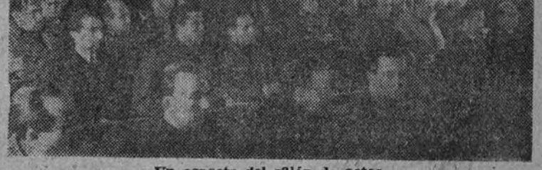
Un aspecto del salón de actos.

«Con vuestra colaboración—les dice el general Yagüe a los alumnos—crearemos un magnífico Ejército del Aire»