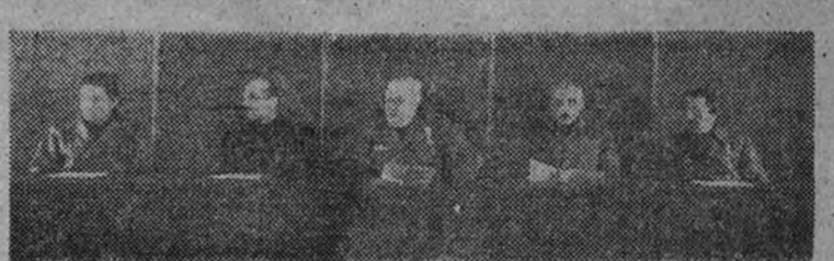
La presidencia del acto inaugural de la Escuela de Ingenieros de Aeronáutica.