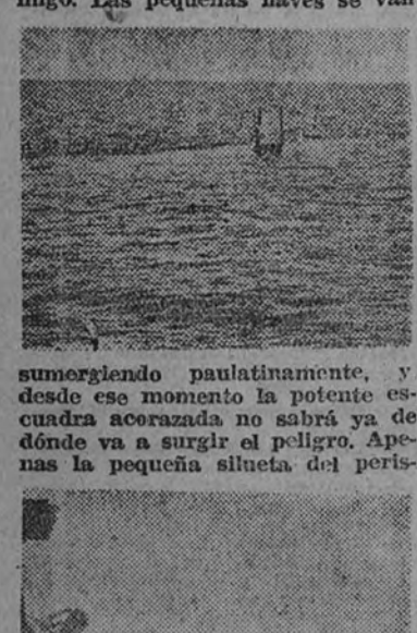
El mar ya no es un camino triunfal para los grandes cruceros de batalla. Esa flotilla de sumergibles, que navega por el mar del Norte, puede ser la sentencia de